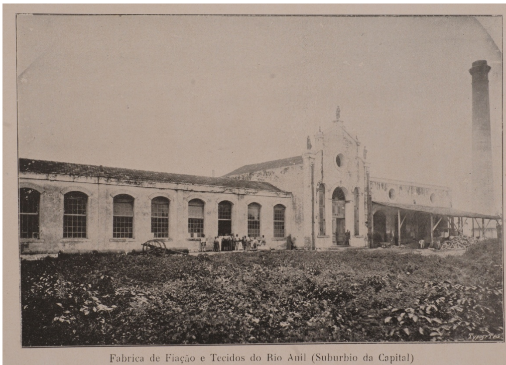
Fábrica de Fiação e Tecidos do Rio Anil (Suburbio da Capital)