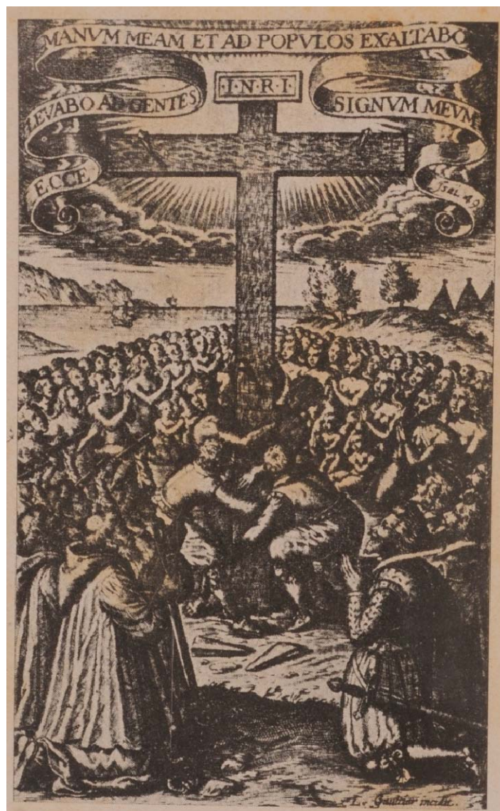
Imagem 3 - Implantação da cruz durante a primeira missa em 1612 no Maranhão

Conforme venho argumentando, os organizadores do tricentenário realizaram um trabalho de produção de lugares de memória (NORA, 1993). Estes lugares foram apropriados no discurso do álbum por um trabalho de enquadramento das referências sócio-históricas e culturais do maranhense. Nesta configuração, a imagem da implantação da cruz durante a primeira missa em São Luis é um lugar de memória, conforme a formulação de Nora (1993), pois responde às três exigências para que um objeto qualquer venha a ser um lugar de memória. A primeira delas é que seja um objeto material que remonte à memória de um acontecimento, personagem, lugar, etc.