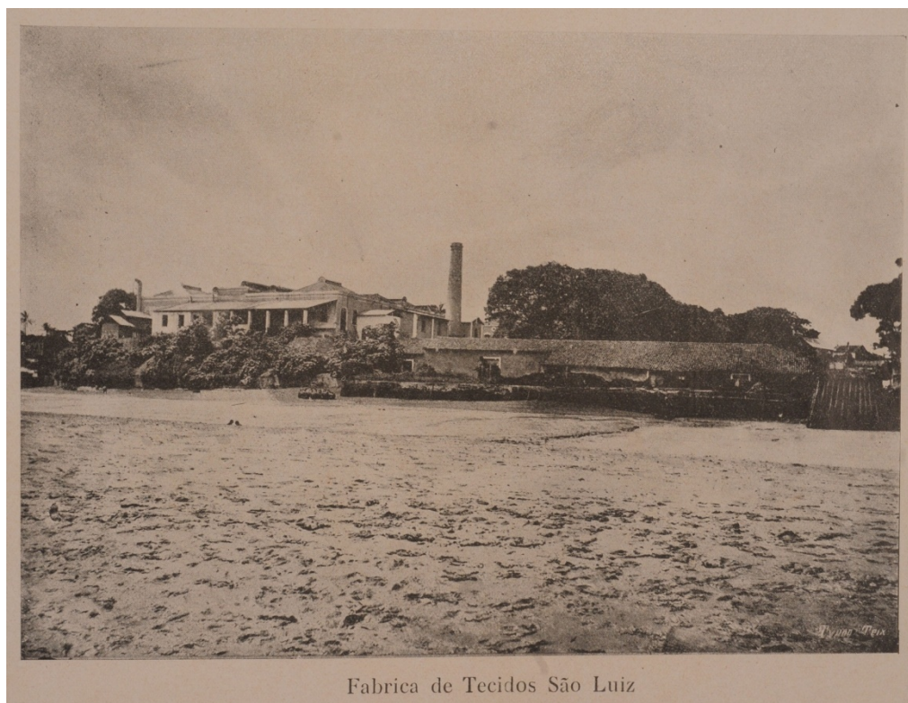
Fábrica de Tecidos São Luiz