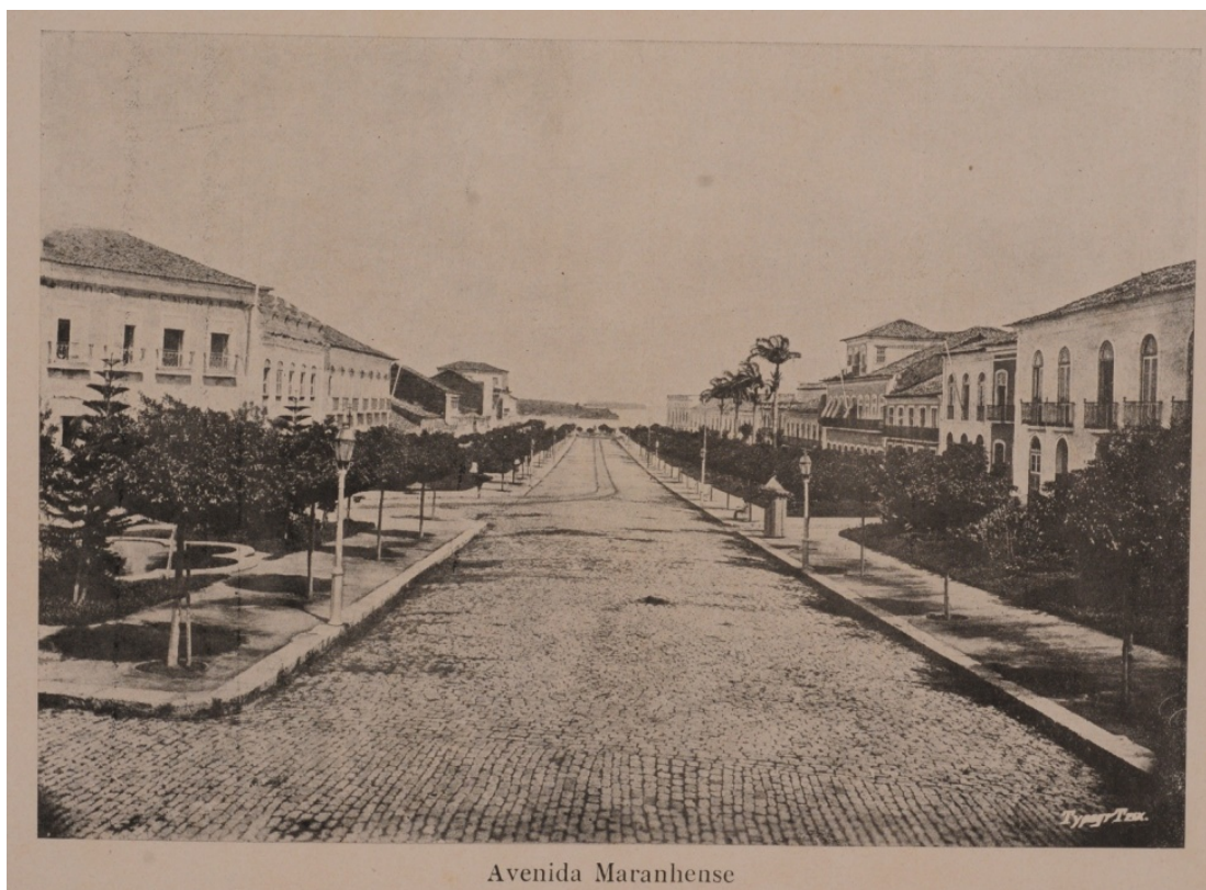
Imagem 4 – Avenida Maranhense

No álbum, a imagem da Avenida Maranhense tem a função de remeter o espectador aos lugares onde o poder se materializa, pois é o lugar físico e também simbólico de concentração e exposição do poder, tendo em vista que na Avenida Maranhense se localizavam os espaços clássicos do poder: a sede do governo estadual e municipal, do jurídico, bem como o religioso. Se na imagem da cruz a relação entre o ontem e o hoje se dá de modo subjetivo, na imagem da Avenida Maranhense as marcas visuais estabelecem relação direta com o relato histórico da fundação, ou seja, o local onde se dão os festejos de 1912 é o mesmo em que se deu a fundação, em 1612.