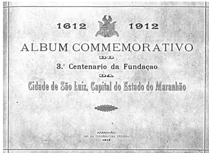
Imagem 1- Capa da primeira parte do álbum comemorativo

A segunda parte do álbum é composta pelo relatório da Sociedade “Festa Popular do Trabalho”, produzido pelo seu Presidente e dirigido aos seus membros. Relata as condições materiais e econômicas de que dispunha a Sociedade para realizar a comemoração. Descreve cada uma das cinco seções que compuseram a Exposição, os prêmios concedidos e o valor total gasto.