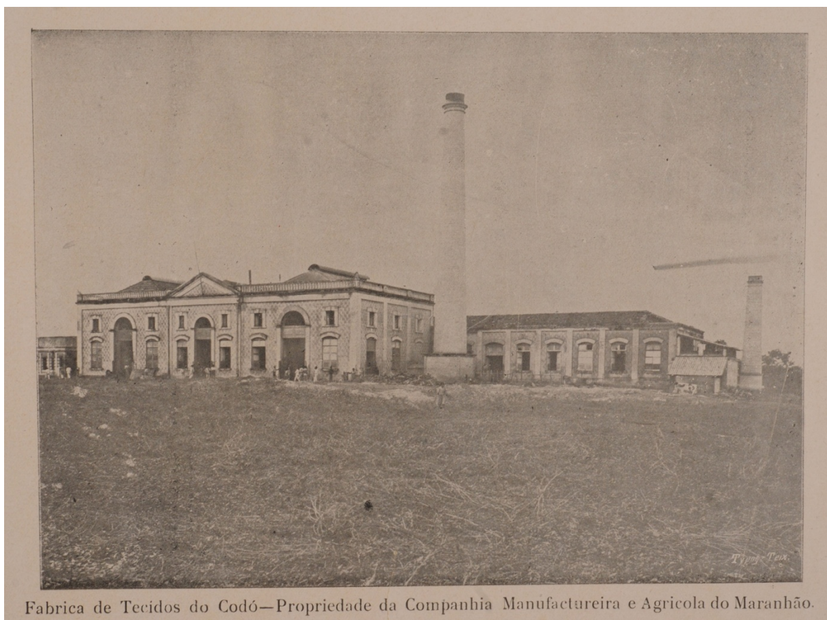
Imagem 6 – Fábrica de Tecidos de Codó

No sentido de reiterar esta imagem de grandeza foram publicadas no álbum duas imagens relativas à agricultura e à pecuária. Do setor da indústria foram publicadas três imagens que trago a seguir para analisar o seu uso no discurso do álbum em relação a essa imagem de prosperidade.