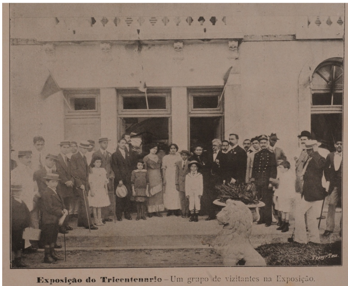
Imagem 5 – Um grupo de visitantes na Exposição

Esta imagem fotográfica foi produzida na porta de entrada do Palácio do Governo, onde estava sendo realizada a exposição do tricentenário e de acordo com a legenda é um registro de uma visita ao local do evento.