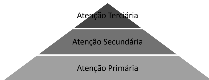
Figura 1 – Pirâmide de um Sistema de Saúde. Adaptado de Lacerda e Traebert (2006)

Conforme a Figura 1, que representa o modelo hierárquico dos serviços de saúde, o nível de atenção primária é formado por domicílios e unidades de saúde; no secundário encontram-se as clínicas de especialidades e, no topo da pirâmide, o terciário, estão os hospitais e centros reabilitadores (LACERDA; TRAEBERT, 2006).