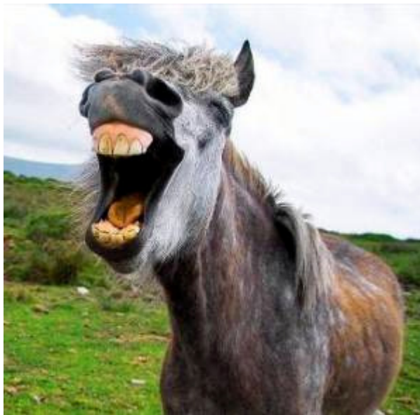
Figura 2 – Cavallo supostamente sorrindo

Aqui torna cômica a cena o fato de o fotógrafo ter conseguido captar imagem do cavalo muito parecida com um riso. Quando observamos alguns animais percebemos gestos parecidos com um riso humano, como abrir a boca expondo os dentes, ou vocalizações altas e repetitivas, parecidas com granidos. Rimos de tais situações porque fazemos um paralelo com nossos próprios gestos.