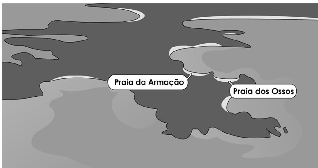
Reprodução de mapa geográfico do litoral de Búzios desenvolvida por Gabriel Brasil. 63

presente na pintura de Taunay - o que nos possibilita afirmar a regularidade na escolha dos locais para a instalação de armações baleeiras no Brasil colonial.