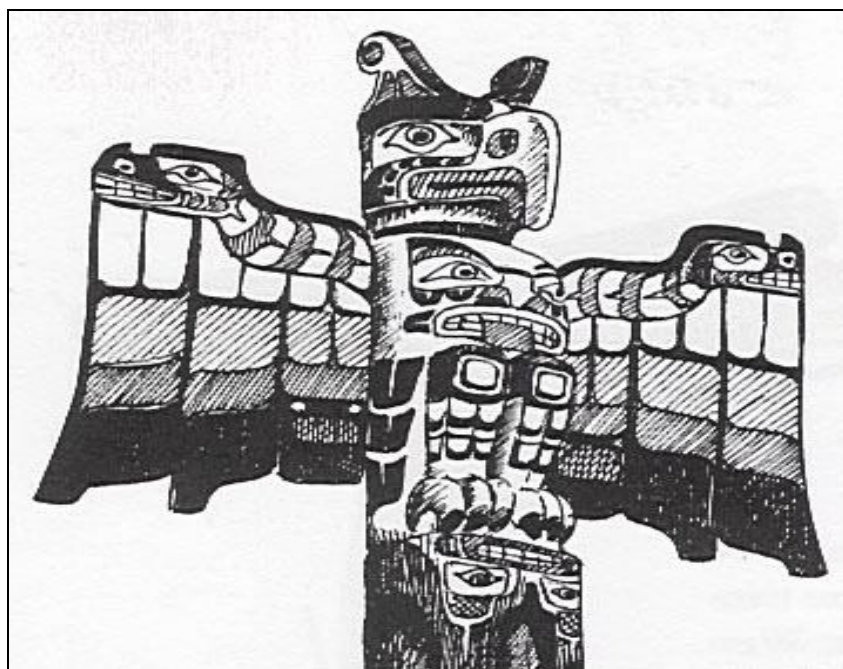
Figura 1. Imagens de Arte Kwakiutl.

outros grupos indígenas daquela região (e.g. os Haida, os Tlingit e o Tshimshan) a tribo é amplamente conhecida pela variedade e complexidade da arte e do artesanato que produz, inclusive a pintura de máscaras, gravura e escultura em madeira, e mais notavelmente a qualidade do entalhe nas colunas totêmicas (Hawthorn, 1967), ver Figuras 1 e 2.