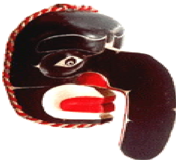
Figura 2. Imagens de Arte Kwakiutl.