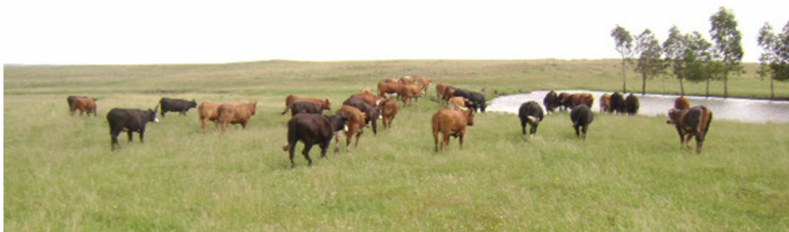
Figura 2. Animais e área experimental.

Um vermífugo injetável a base de Ivermectina foi subministrado aos animais utilizando uma dose de 200 µg/kg de peso vivo.