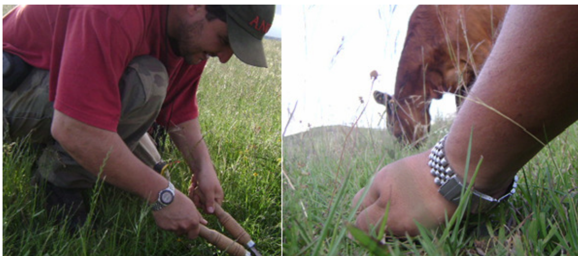
Figura 4. Coleta de amostras de disponibilidade e simulação de pastejo

manhã e após jejum de sólidos e líquidos. O ganho de peso no período e o ganho médio diário (GMD) foram calculados.