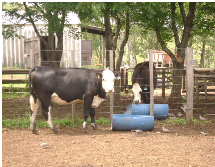
Figura 1. Centro de manejo e baias utilizadas no experimento