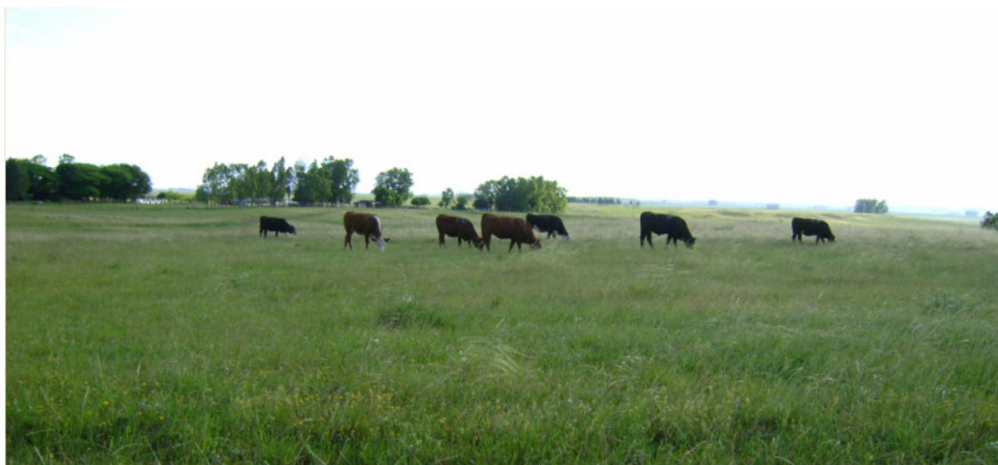
Figura 3. Campo nativo melhorado utilizado no experimento

do qual podem ocorrer restrições ao consumo voluntário de forragem (NRC, 2000).