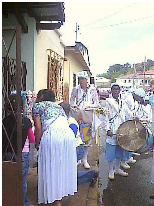
Terno de Moçambique de Nossa Senhora das Mercês buscando a bandeira, na casa de sua mordoma, para ser erguida junto com os mastros. 287