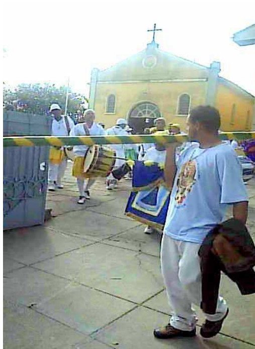
Os mastros sendo retirados da capela para serem erguidos na Praça XV de Novembro. 285