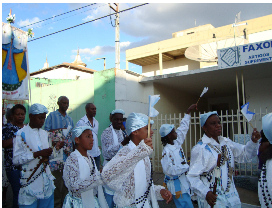
Terno de Moçambique de Nossa Senhora das Mercês se despedindo, indica que a festa acabou. 406

Porém, independente dos conflitos que ocorreram e ocorrem na comunidade congadeira os participantes da festa se unem durante uma semana para louvarem, agradeceram á Senhora do Rosário, a seus santos de devoção e afirmarem sua identidade de negros do Rosário . É isso que faz com que passados tantos anos de festividade e superação de dificuldades e preconceitos, os congadeiros ainda permaneçam e continuem encontrando sentido para a manifestação de sua devoção e para a luta contra o preconceito e discriminação.