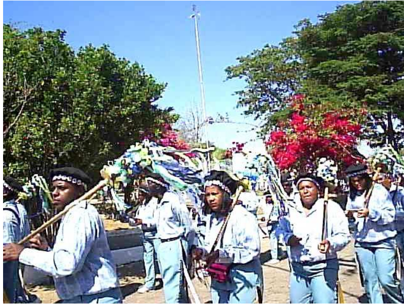
Terno de Catopé 253

Atrás dele vêm os ternos de Catopés, que assim como as guardas de Vilão e de Congo, abrem os caminhos para a passagem da coroa que o terno de Moçambique traz. Sua função é alegrar o ambiente e seus instrumentos são as caixas, sanfonas e o reco-reco. O capitão tem o tamborim como símbolo de seu comando.