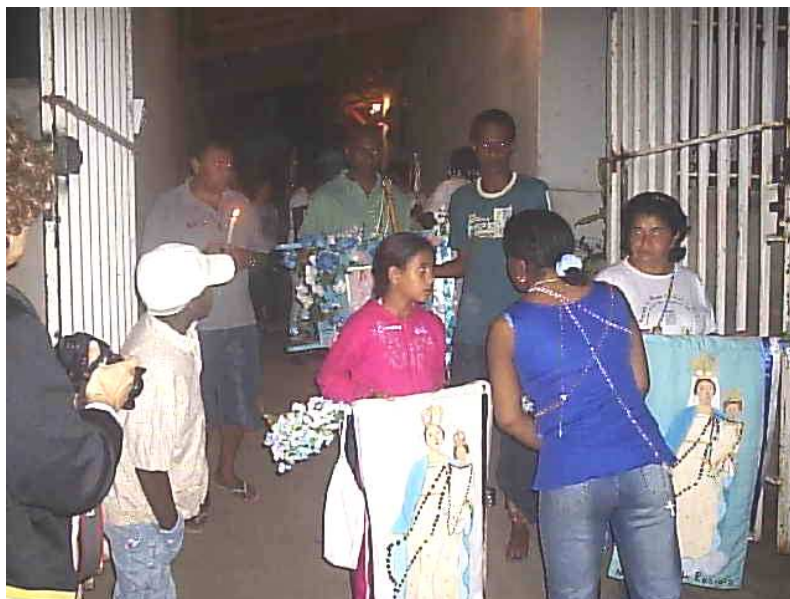
Dia do Levantamento dos mastros no terreiro pesquisado. 342