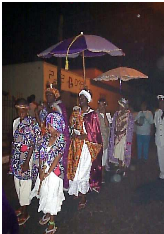
Reis e príncipes congos do Reinado de São Benedito. 265