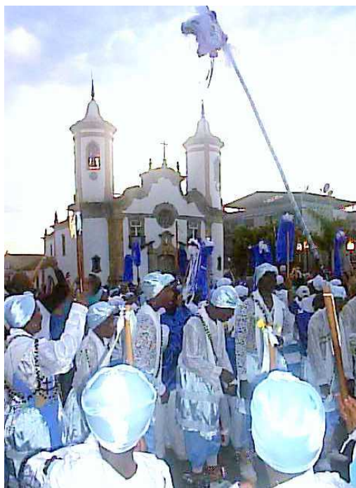
Levantamento da bandeira de Nossa Senhora das Mercês na Praça XV de Novembro. 289

Ao chegar à Praça XV de Novembro os mastros são colocados na beira da praça e os ternos de Moçambique referentes ao santo do mastro ficam em volta dele, cantam e dançam os pontos específicos para o momento de levantá-los. É erguido um mastro de cada vez, e segundo a tradição congadeira os ternos de Moçambiques não podem parar de dançar e cantar enquanto o outro mastro está sendo levantado. Eles ajudam, com suas músicas, a levantar o mastro do outro santo padroeiro.