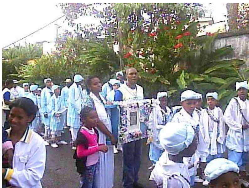
Reis congos do Reinado de Nossa Senhora das Mercês carregando a bandeira. 288