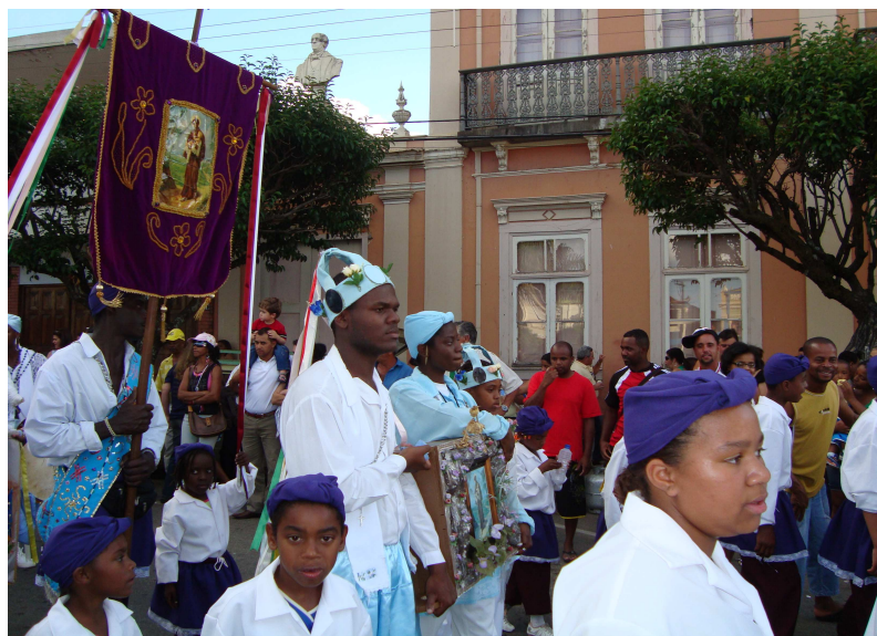
Procissão de encerramento da festa. 295