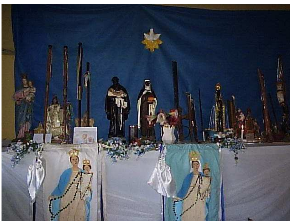
Altar congadeiro, que fica localizado no terreiro pesquisado. No altar ficam as imagens dos santos padroeiros da festa e os bastões dos capitães de terno. 23