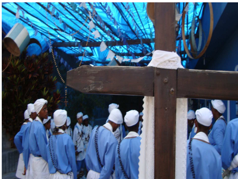
Congadeiros do terno de Moçambique de Nossa Senhora das Mercês se preparando para saírem para as ruas da cidade. 214