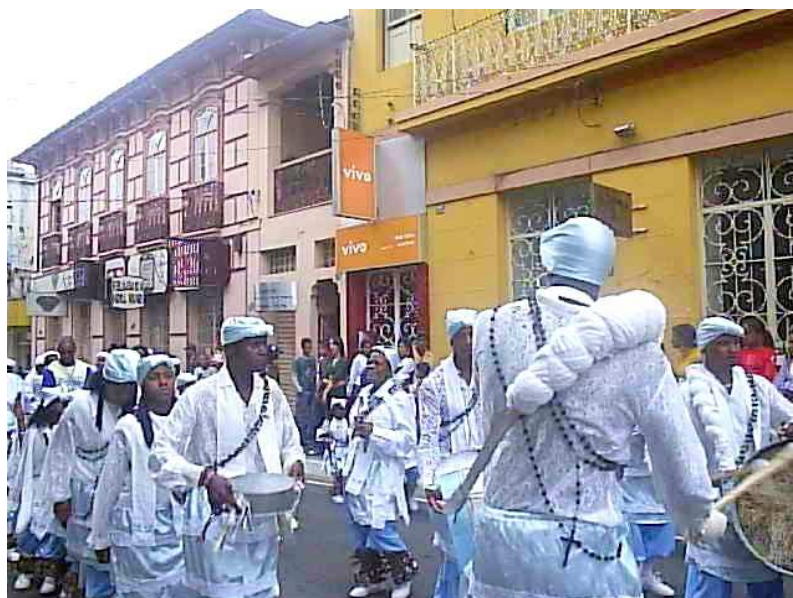
Terno de Moçambique de Nossa Senhora das Mercês na Rua Direita, local nobre da cidade. 222

Entendo que a ida para o local de prestígio da cidade deve-se à luta dos antigos congadeiros que desejavam expressar ali seus valores, especialmente à devoção a virgem do Rosário. Não se deve pensar que o poder público concedeu esse direito aos negros do Rosário , mas sim que houve uma luta dos próprios agentes sociais para transporem as barreiras cotidianas impostas, como já foi demonstrado no capítulo anterior.