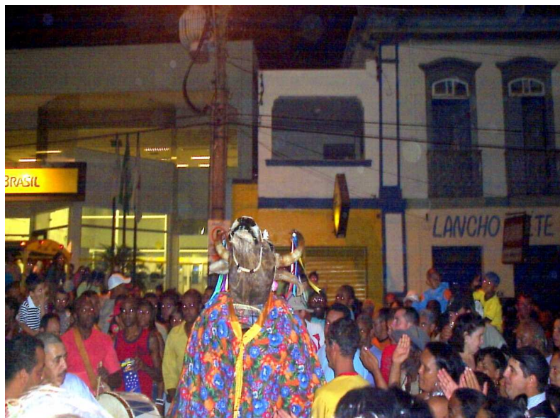
Boi do Rosário na Praça XV de Novembro. 292

Os capitães de terno devem acompanhar o trajeto do boi, seguindo-o em oração, e também devem ficar ao pé dos mastros quando o mesmo por ali passar. O boi ao percorrer os bairros da cidade passa nas casas dos reis e rainhas congos e perpétuos.