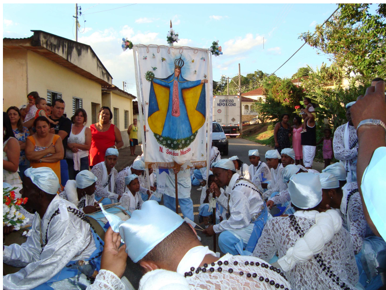
Terno de Moçambique de Nossa Senhora das Mercês em frente à casa da mordama de sua bandeira. 296