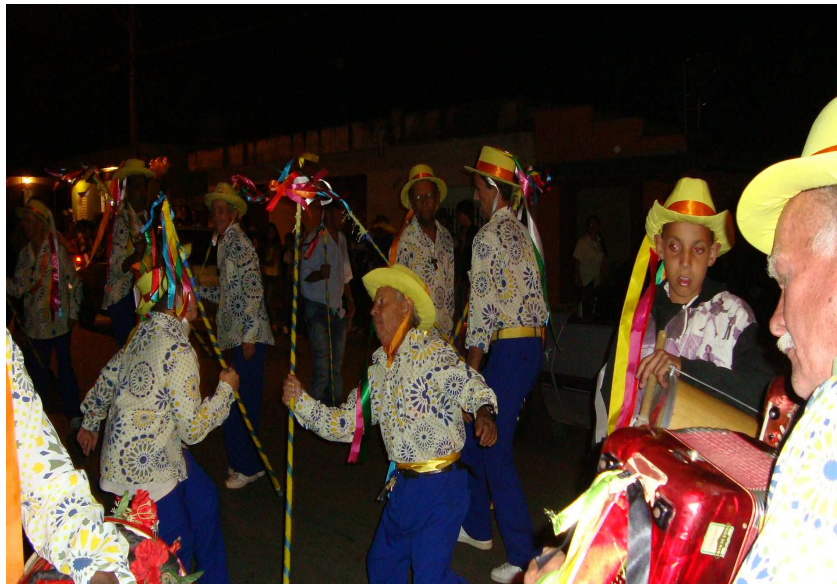
Terno de Vilão. 252

O terno de Vilão é o que vai à frente do cortejo, têm como instrumentos as caixas, sanfona, cavaquinho e varinha e um outro elemento: os facões de caça. Conta-se que eles são de uma tribo de índios, caçadores e vão à frente para afastar qualquer coisa ruim que possa ter no caminho para os outros ternos, reis, rainhas, príncipes e princesas que vão ao final do cortejo. No momento da apresentação do Vilão à frente do palanque, seus integrantes batem as varinhas com as de seus companheiros e também fazem com as facas de caça: é uma representação da defesa que fazem da coroa que o terno de Moçambique traz. Em Oliveira só existe um terno de Vilão, o de Nossa Senhora do Rosário. É um dos mais antigos da cidade, que se apresentou nas comemorações do Centenário do Rio de Janeiro na década de 1960, apenas alguns integrantes não são mais os daquela época.