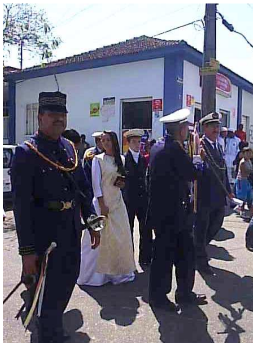
Representação da princesa Isabel e seu marido junto com o Estado-Maior. 269