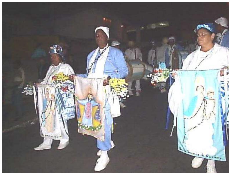
As três bandeireiras juntas à frente, indicando a união dos ternos. 367