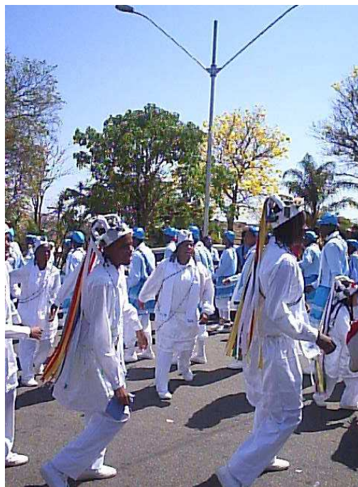
Terno de Congo de Nossa Senhora do Rosário. 254