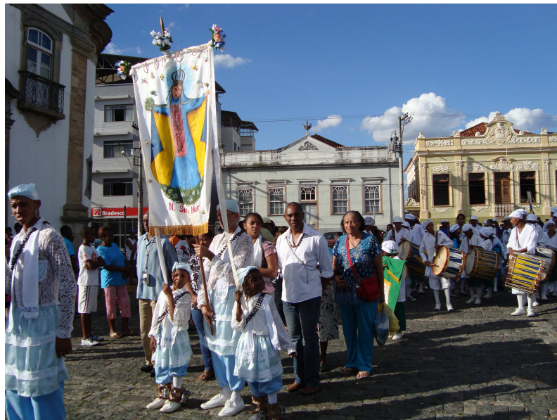
Procissão de encerramento da Festa de Nossa Senhora do Rosário. 294

perpétuos e a jovem que representa a Princesa Isabel, os dançadores e capitães de terno carregam em um andor as imagens dos santos homenageados durante a semana da festa. Após a procissão há o descimento dos mastros que marca o fim do festejo congadeiro. Depois do descimento dos mastros, os ternos de Moçambique entregam a bandeira para a mordoma, que irá guardá-la durante mais um ano, e os ternos de Catopés levam os mastros para serem guardados novamente na capela anexa ao Ginásio Mário Campos e Silva.