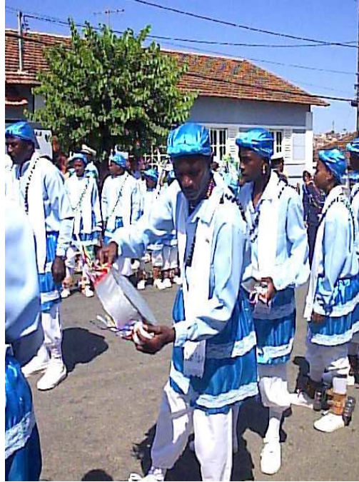
Terno de Moçambique de Nossa Senhora das Mercês O instrumento nas mãos do dançador é o pantangome e o que está nos pés são as gungas. 256