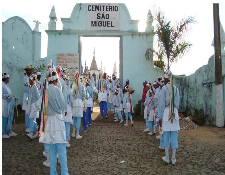
Vista dos ternos de Moçambique e Congo de Nossa Senhora do Rosário. 298

Além dessas visitas, algumas pessoas da cidade oferecem um lanche para o mesmo terno há alguns anos.