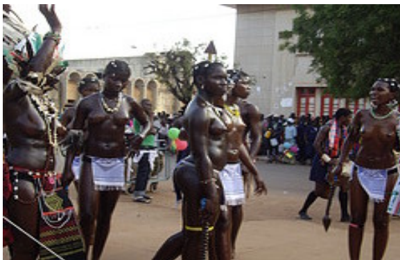
Figura 1 – REPRESENTAÇÕES ÉTNICAS EM DESFILES CARNAVALESÇOS NA GUINÉ-BISSAU

Nessas fotografias, podemos considerar o corpo africano como espelho cultural, que permite visualizar e ler as tradições, e os significados dos desenhos tatuados no corpo e as texturas de tecidos, como formas de expressão de uma determinada cultura. Desta forma, temos várias formas de descrever o pertencimento étnico e as tradições culturais nas sociedades africanas através do corpo, cor, cabelo, etc.