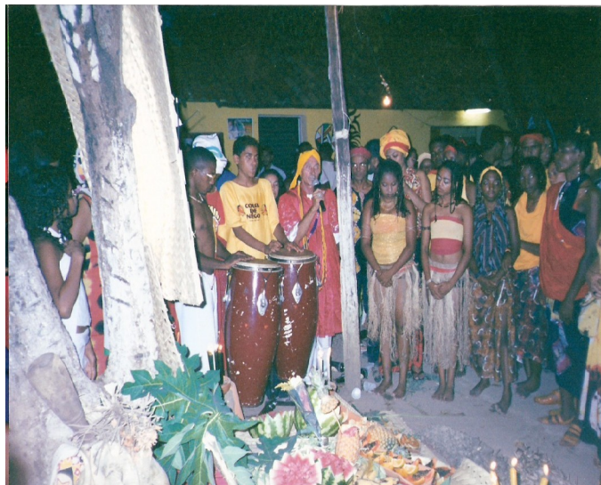
Figura 3 –FESTA DE BELEZA NEGRA EM TERESINA- PI 2005

Ainda em 1990, já na segunda versão dirigida por outros membros do grupo, devido à criação oficial do Grupo Afro-Cultural Coisa de Nêgo, a Festa de Beleza Negra teresinense se transformou em uma festa pública, mais abrangente, com a mesma função político-social, i.e., homenagear os(as) negros(as), no dia 20 de novembro, pela resistência de Zumbi dos Palmares, e divulgar os projetos que o grupo implementava em prol dos(as) negros(as). A partir desta data, o referido grupo afro-cultural teria como objetivo promover, anualmente, a Festa da Beleza Negra. Atualmente, a Beleza Negra é uma festa de identidade e auto-afirmação étnico-racial, alicerçada na religiosidade, como bem o demonstram as benções e pedidos de proteção que antecedem as batidas de tambor. Como se vê na foto abaixo: