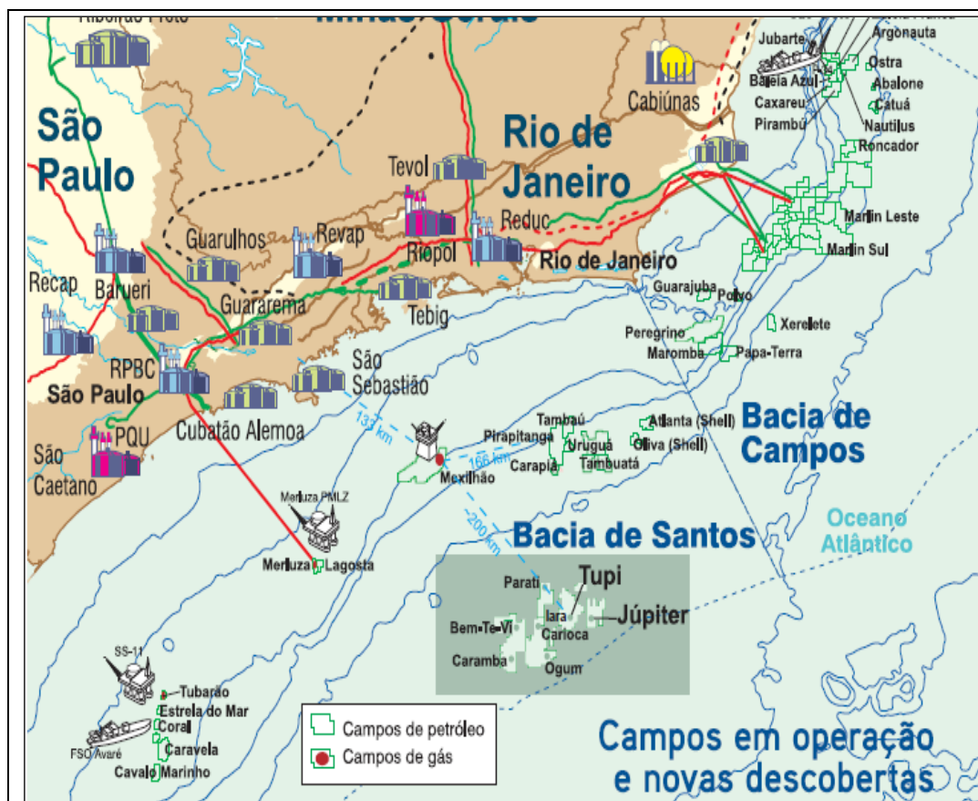
Mapa 01: Localização dos campos em produção e novas descobertas na Bacia de Campos

Fonte: TN Petróleo – Guia do Estudante, p. 32. Disponível em: http://www.tnpetroleo.com.br/uploads/guia_estudante/05_Guia_do_Estudante_Petroleo.pdf . Acesso em: 11 mar. 2003.