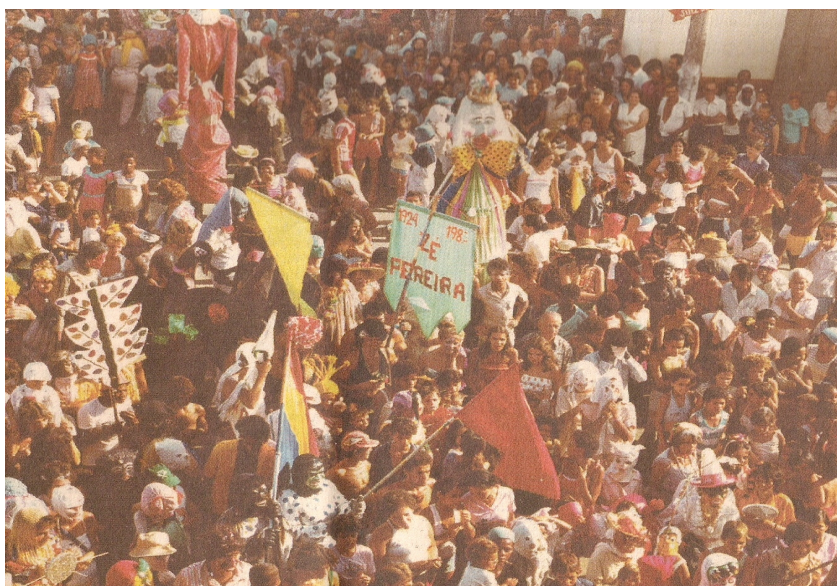
Fotografia 8 Estandarte de cor verde data a existência do Bloco do Zé-Pereira de 1924 a 1983.

Mesmo assim, com a memória perdida ou camuflada nos vastos anos que se foram, para muitos a data de 1924 tornou-se o marco inicial deste bloco. Isso é visível quando encontramos um estandarte nas fotos do bloco, que se refere à existência do Zé Pereira de 1924 a 1983.