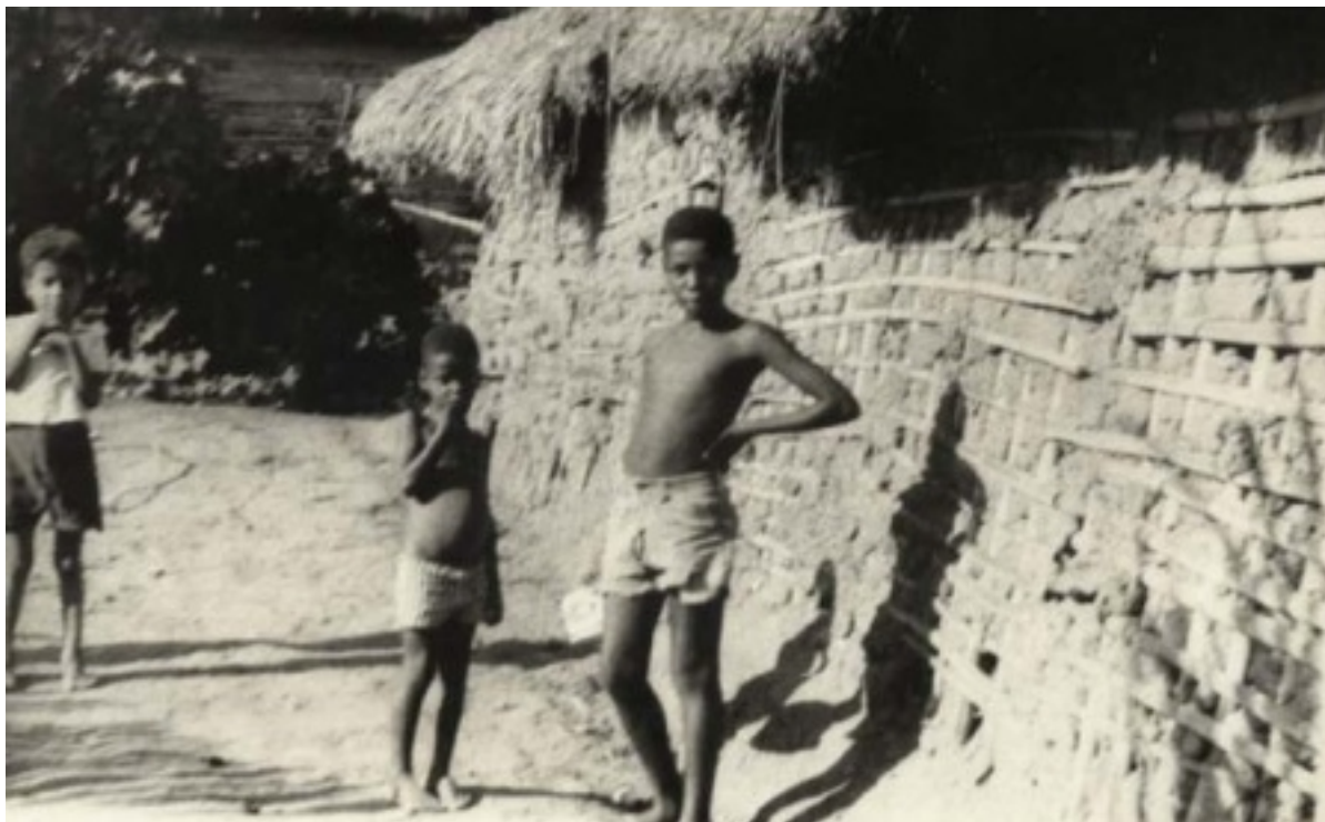
Fotografia 27 Algumas crianças habitantes do “Morro do Supapo”, hoje bairro Santa Clara.