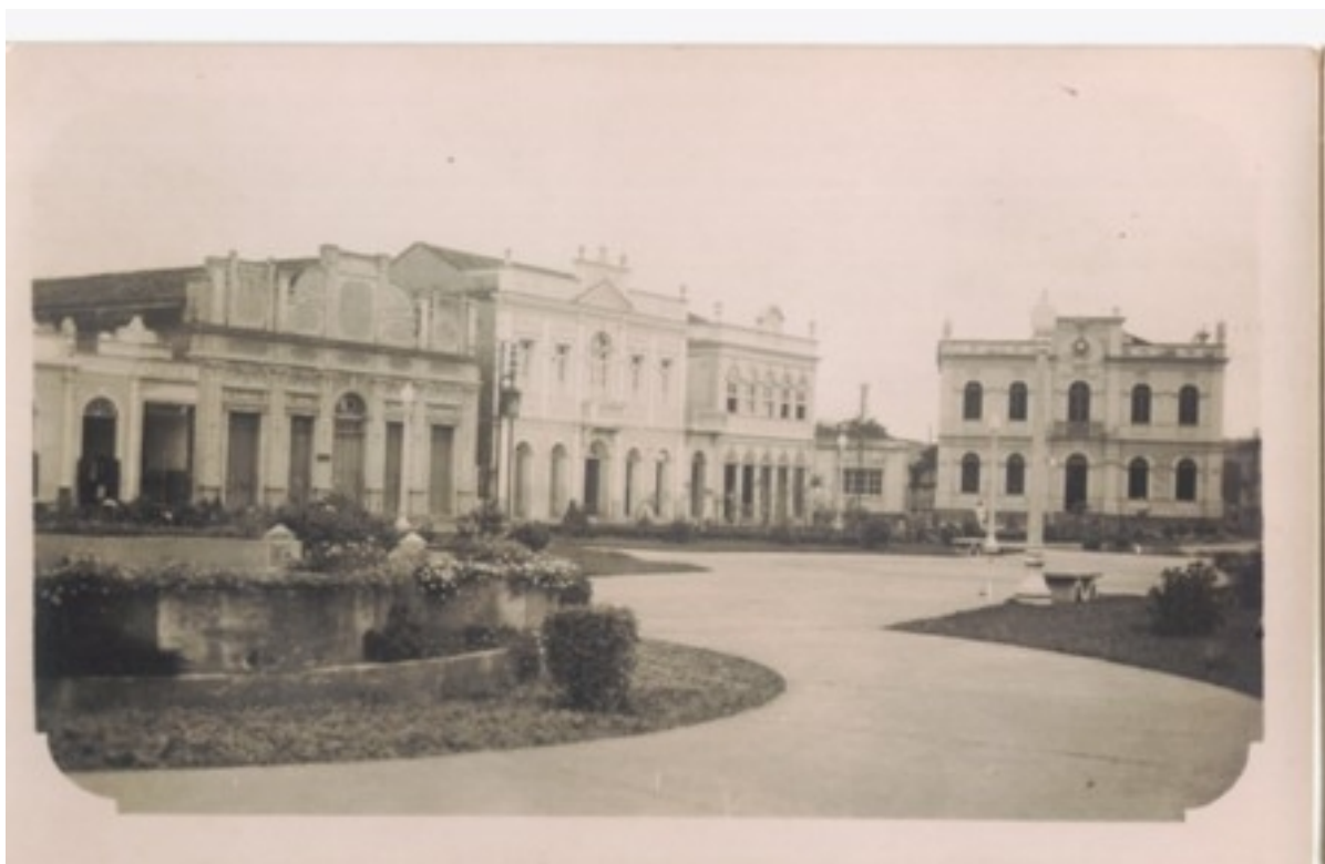
Fotografia 11 Praça Marechal Floriano (década de 1940). Ao fundo, da esquerda para direita, antiga sede do “Clube Paladinos Carnavalescos”, o prédio do “Clube dos Renitentes Carnavalescos”, casarão da família Ferreira e a Prefeitura Municipal de Rio Novo.