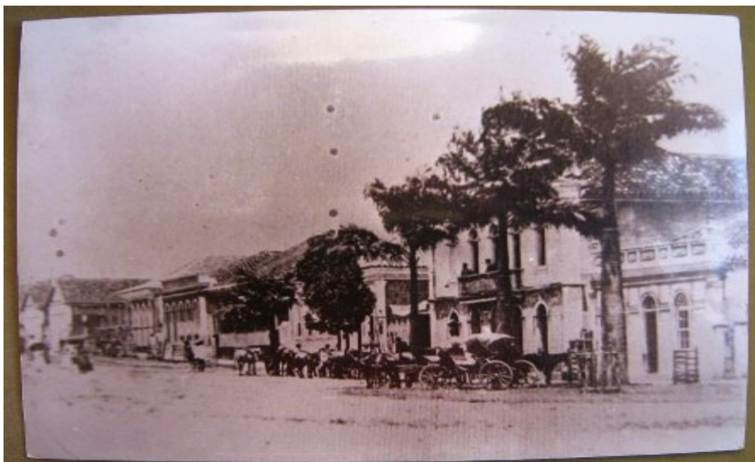
Fotografia 19 O Largo da Matriz no final do século XIX.