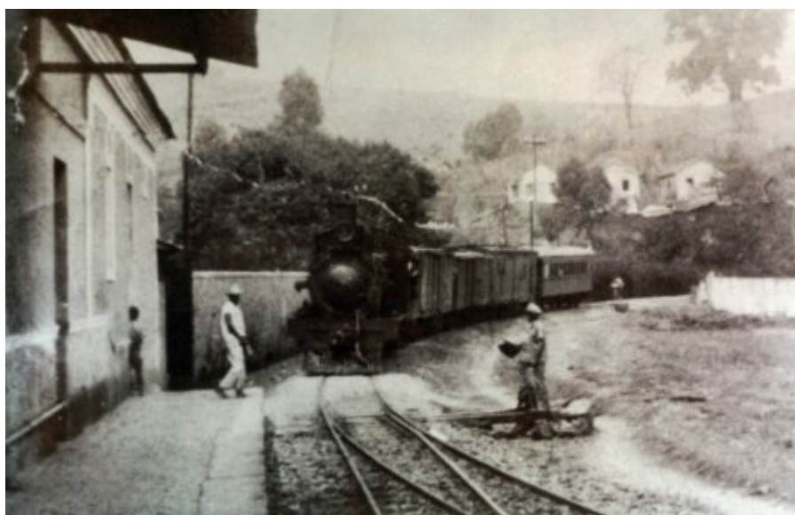
Fotografia 2 Antiga Estação de Trem da linha férrea que ligava Rio Novo a Juiz de Fora, onde se fazia a baldeação para a antiga capital do país, Rio de Janeiro.

Construídas na segunda metade do século XIX, as linhas férreas, que tinham como principal objetivo escoar as sacas de café da região da Zona da Mata até o Rio de Janeiro, por muito tempo se apresentaram como um elo entre Rio Novo e o universo exterior. Foi por intermédio deste meio de transporte que chegavam os visitantes junto às novidades da moda e dos costumes da capital, as novas tecnologias e as notícias dos jornais, entre outros fatos, que eram repassadas pela imprensa local.