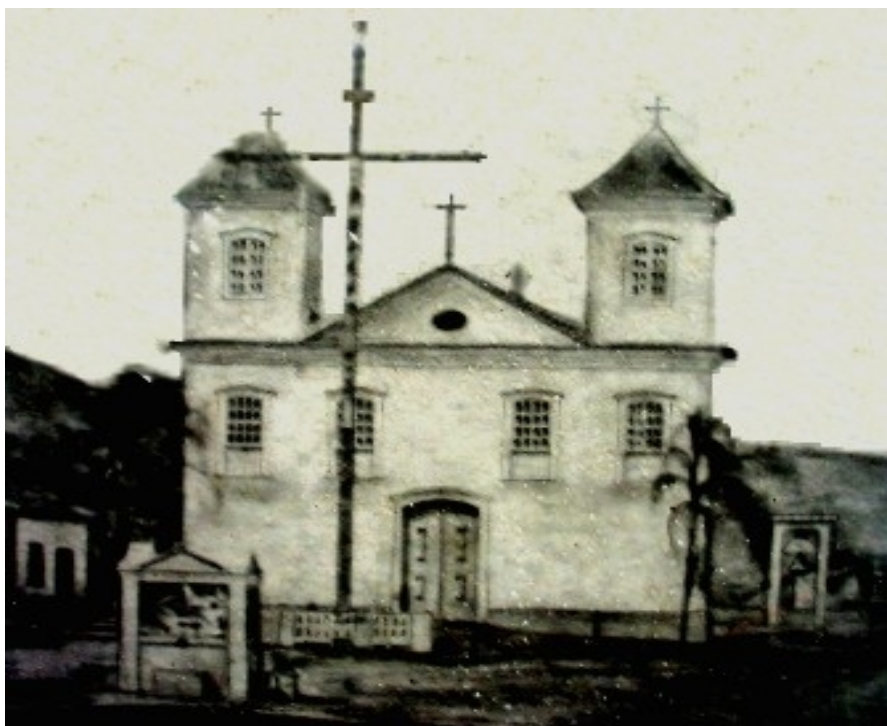
Fotografia 18 Capela de Nossa Senhora da Conceição do Rio Novo, no final do século XIX.