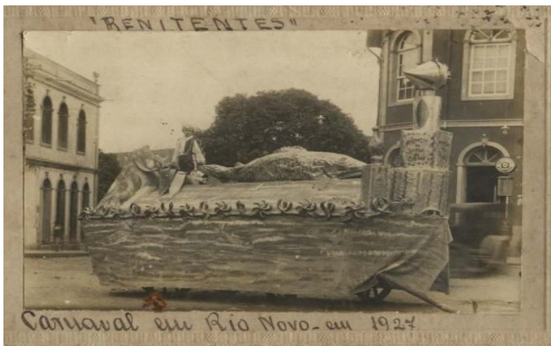
Fotografia 29 Carro do Clube dos Renitentes Carnavalescos de Rio Novo do carnaval de 1927. Fonte: acervo particular de Ernesto Soares.

Fonte: acervo particular de Ernesto Soares.