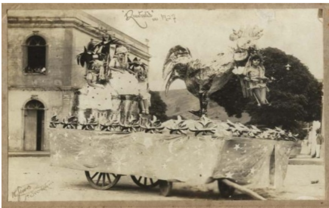
Fotografia 28 Carro do Clube dos Renitentes Carnavalescos de Rio Novo do carnaval de 1927.