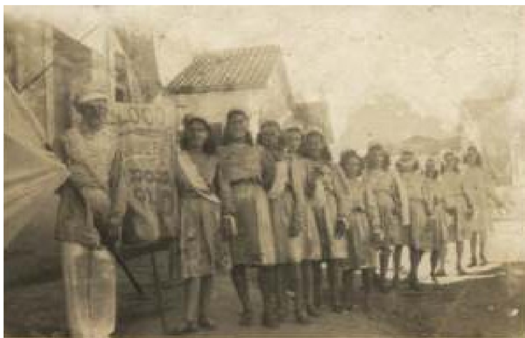
Fotografia 30 O bloco carnavalesco "As Cigarras" do O Nosso É Outro (1947).