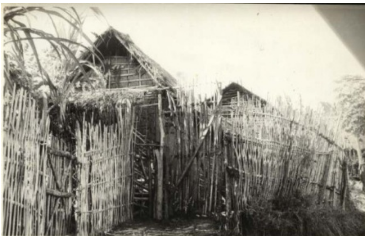
Fotografia 26 Uma habitação de pau-a-pique nos intermédios do Arraial dos Crioulos, região que ficou conhecida como “morro do Supapo”, pela maneira que as casas eram construídas.