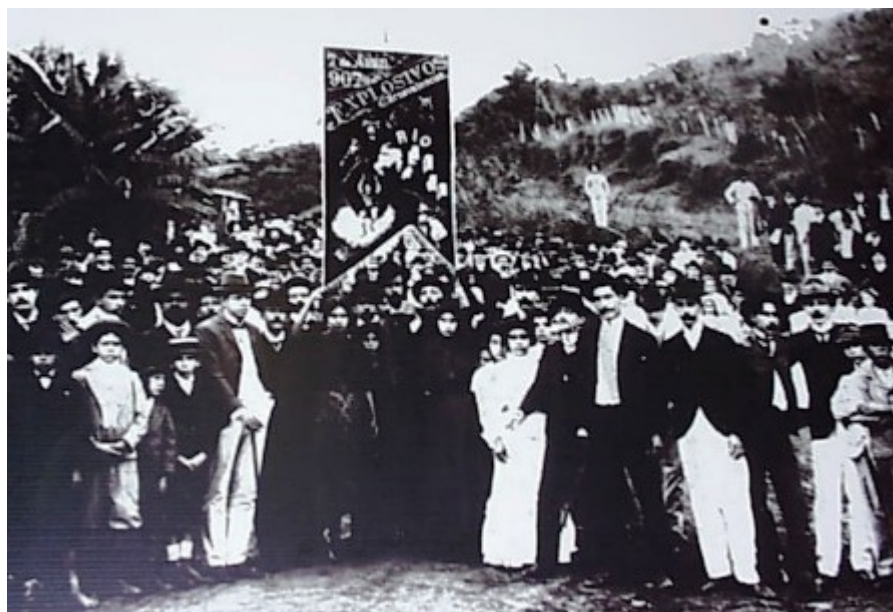
Fotografia 9 fundação do Club Explosivos Carnavalescos de Rio Novo , datada de 1907.

Diferente do primeiro, como o próprio nome nos indicia, este novo clube tinha suas energias voltadas principalmente para as festividades do carnaval. Apesar de não se limitar a esse tipo de evento, os demais festejos tinham o objetivo de conduzir o entretenimento na cidade e, talvez indiretamente, estavam voltados para arrecadar renda e divulgar a eficácia e o deleite das noites ali festejadas durante o ano, conseqüentemente, solidificando suas celebrações carnavalescas que eram as principais festividades promovidas pelo clube.