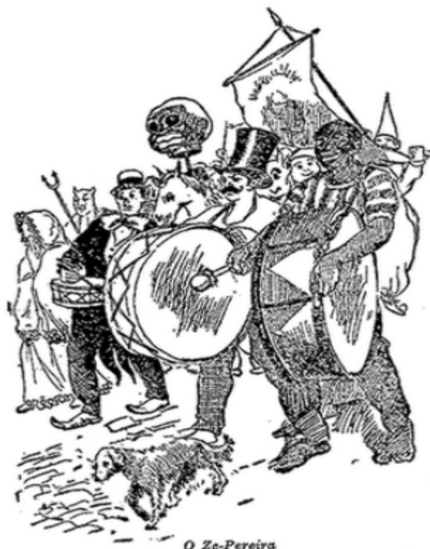
Desenho 2“Um zé-pereira”. Ilustração de Arnaldo Pacheco.

Visões como estas, que mencionam o zé-pereira como uma manifestação pejorativamente popular, foram naturalmente pronunciadas pelas elites cariocas, que ao assistirem os desfiles zé-pereiras e seus diabos, pierrôs, dominós, princês e outros personagens mascarados de origem marginal, reforçavam as críticas a estes cortejos que se tornavam cada vez mais comuns nas ruas do Rio de Janeiro no século XIX.