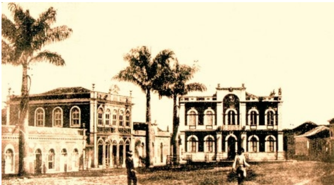
Fotografia 20 Largo da matriz em direção oposta à Igreja Matriz de Nossa Senhora da Conceição (1907)