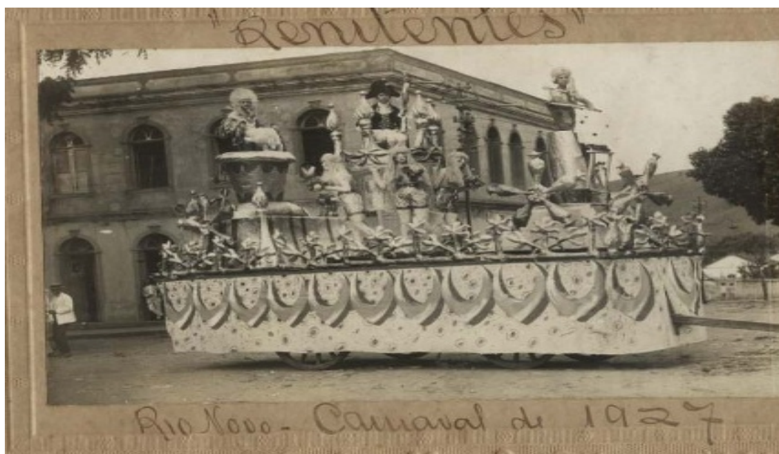
Fotografia 14 Carro alegórico apresentados pelos Renitentes no carnaval de 1927.

Neste meio de embates simbólicos, a ostentação como modo de diferenciação ganhava espaço nas estratégias de se apresentarem num status distinto aos opositores. Pável, em seu livro, já tratava de apresentar o sucesso dos Renitentes no carnaval de 1925, sendo fruto do rico aparato dos seus carros alegóricos confeccionados por seus sócios. Segundo suas memórias, causaram admiração a todos os habitantes da cidade, principalmente para os sócios dos Explosivos , que julgavam terem sido feitos na capital, Rio de Janeiro, não aceitando a grandiosidade do trabalho dos Renitentes . Este episódio valeria a seguinte frase em seu trabalho: “Apesar de protesto de “ Os Explosivos ” a palma da vitória coube aos “ Renitentes ”, só um contrário apaixonado pensaria de outro modo.” 262