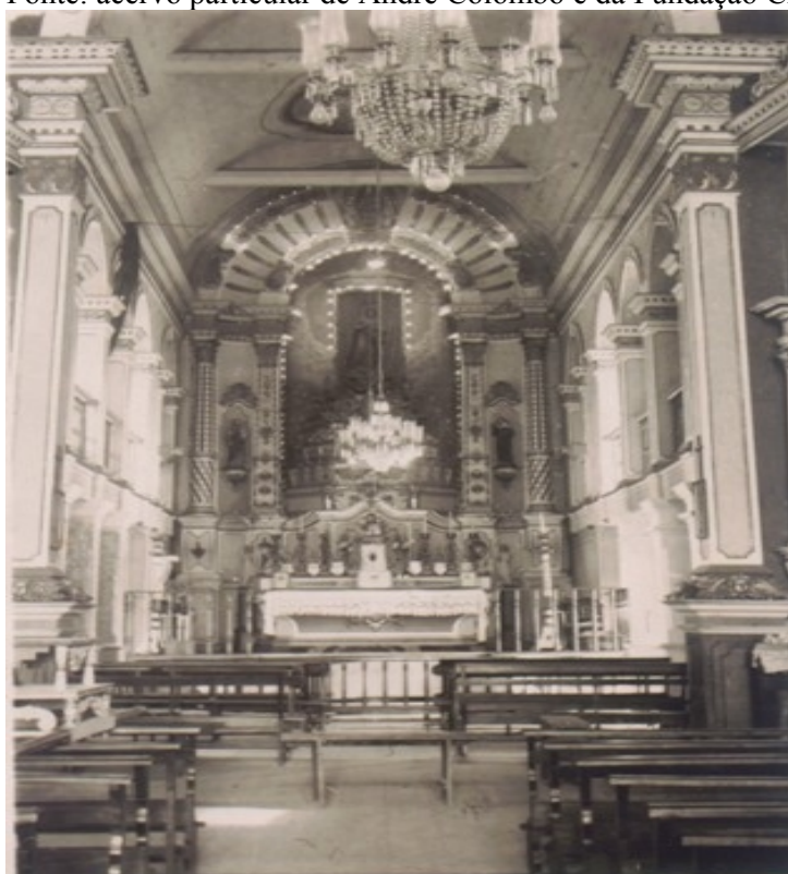
Fotografia 22 O altar da Igreja (1940).