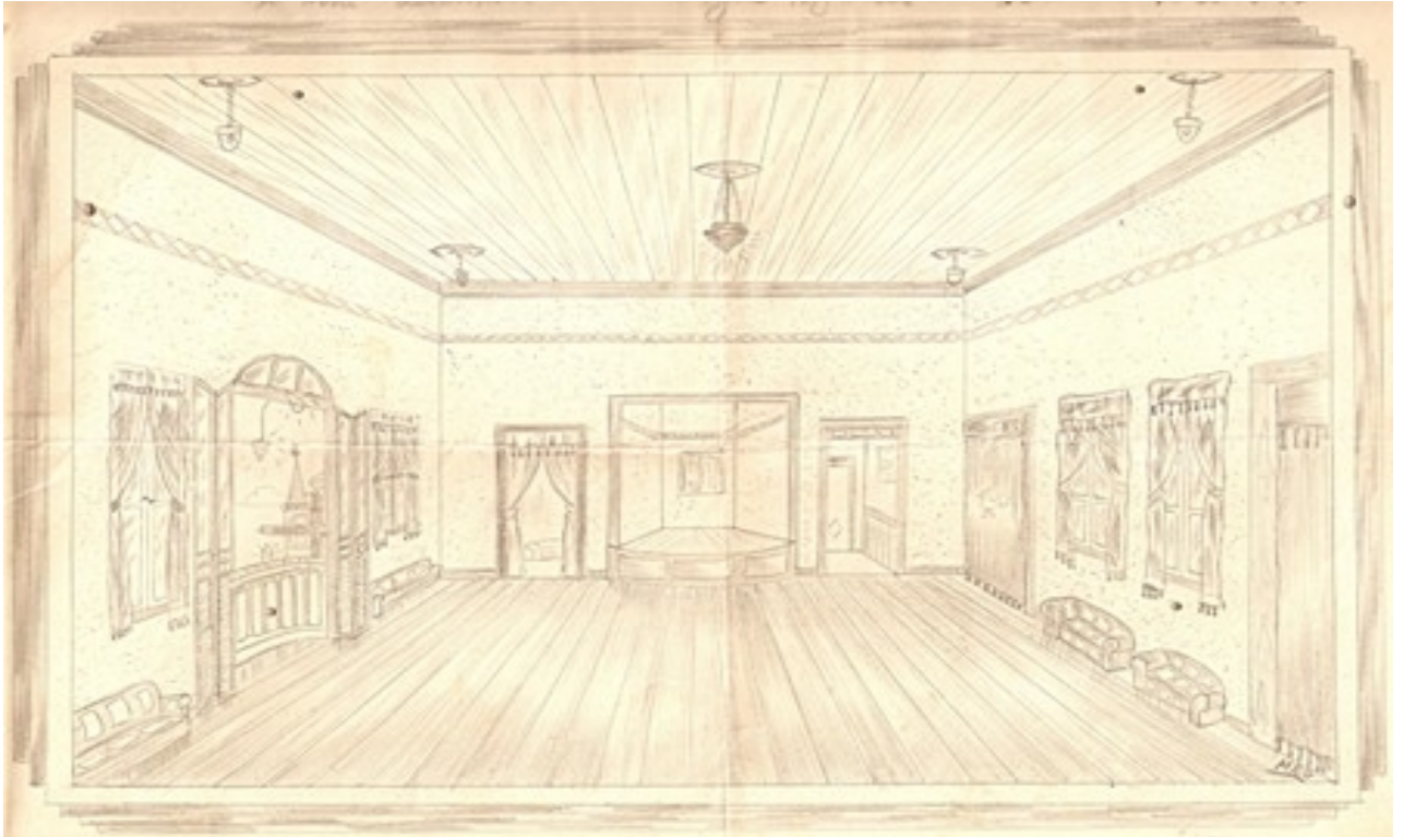
Desenho 3 luxuoso salão do Clube Renitente Carnavalescos . Autoria de Miguel R. Gomide, datado do dia 20 de março de 1943.