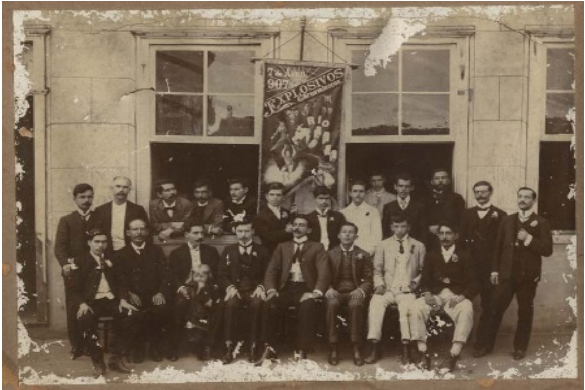
Fotografia 10 diretoria e sócios do Clube Explosivos Carnavalescos de Rio Novo (1920).

Porém, os jornais, entre 1909 e 1914, projetaram uma outra imagem do carnaval. Nesta ocasião afirmara-se o juízo de um carnaval frígido e quieto, sem os mesmos anúncios que convocavam os foliões às comemorações do Momo. Uma das carentes matérias que se assistiu nesses anos foi a seguinte: