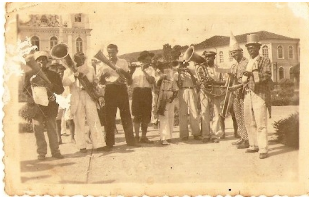
Fotografia 4 “Banda de Música” que promovia o Bloco do Juvenil (1949).

aqueles animados, muitas vezes alcoolizados, e tradicionais foliões mascarados que tomavam as ruas de Rio Novo.