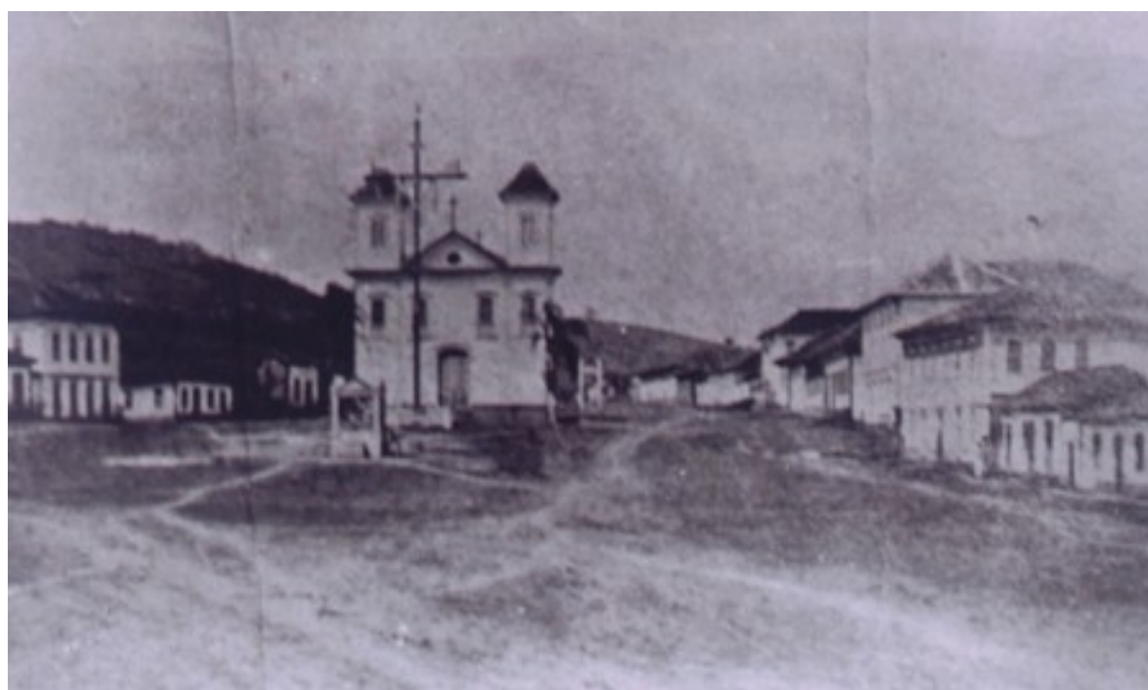
Fotografia 17 Capela de Nossa Senhora da Conceição do Rio Novo o “Largo da Igreja” (1875).