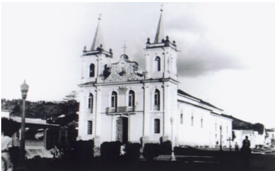
Fotografia 21 A Igreja Matriz em 1940.