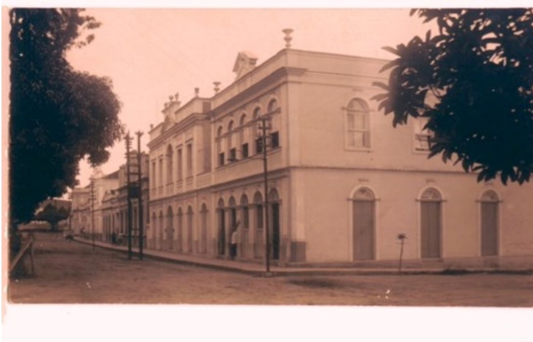
Fotografia 6 Clube dos Renitentes Carnavalescos de Rio Novo ao lado do prédio da esquina (década de 1920).