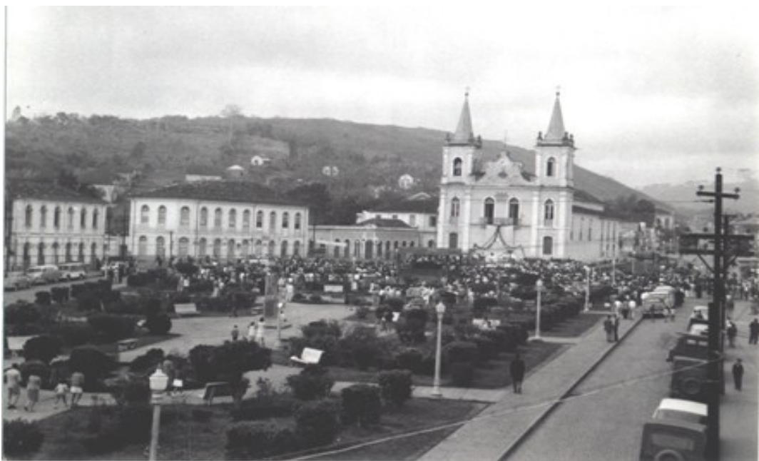
Fotografia 23 A Praça Marechal Floriano Peixoto (1950).