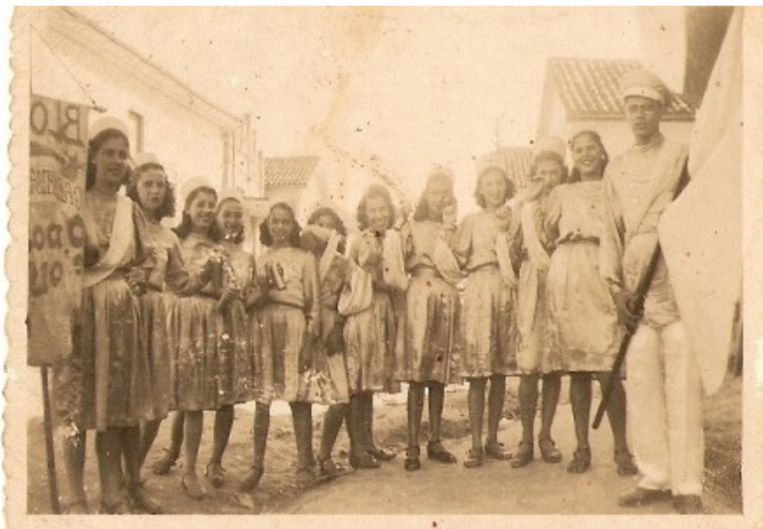
Fotografia 13 O Bloco do Clube Carnavalesco O Nosso É Outro , composto pelas Cigarras e o porta-bandeira, no carnaval de 1947.

Fonte: Acervos particulares de Luiz André Xavier Gonçalves e Hyla Salma.