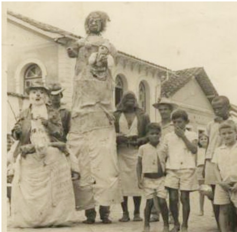
Fotografia 5 As Mulinhas do João Rinco seguida por foliões avulsos dos Blocos de Sujos. Rio Novo – MG.

“Não é assim/ assim não é / não é assim que se maltrata uma mulher/ ela ontem coitadinha / ela me pediu chorando / que andava cansadinha de andar me carregando/ meu senhor minha senhora / todos tenham pena dela/ isso é pra comprar cavalo pra num montar mais nela. (risos) Todo mundo com um chapéu (...) pedindo. (...)” 130