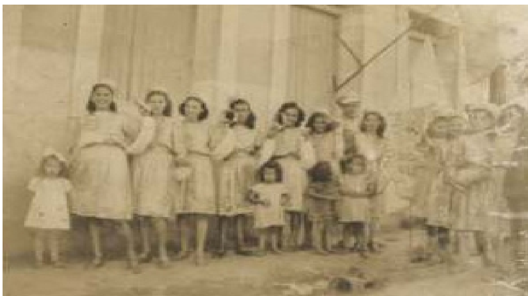
Fotografia 31 O bloco carnavalesco “As Cigarras” do O Nosso É Outro (1947). Fonte: acervos particulares de Luiz André Xavier Gonçalves e Hyla Salma.

Fonte: acervos particulares de Luiz André Xavier Gonçalves e Hyla Salma.