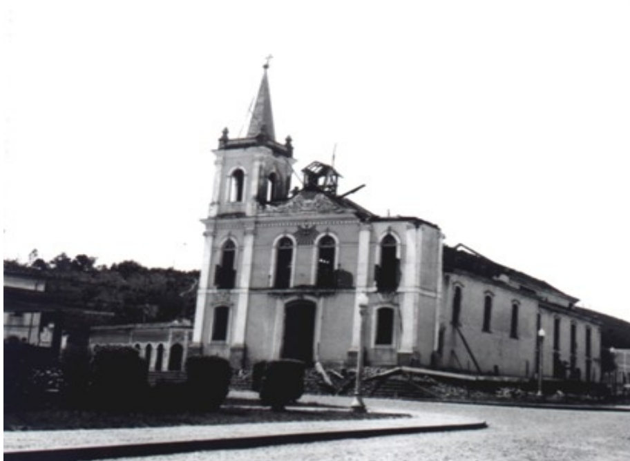
Fotografia 24 A demolição da Igreja Matriz em 1965.