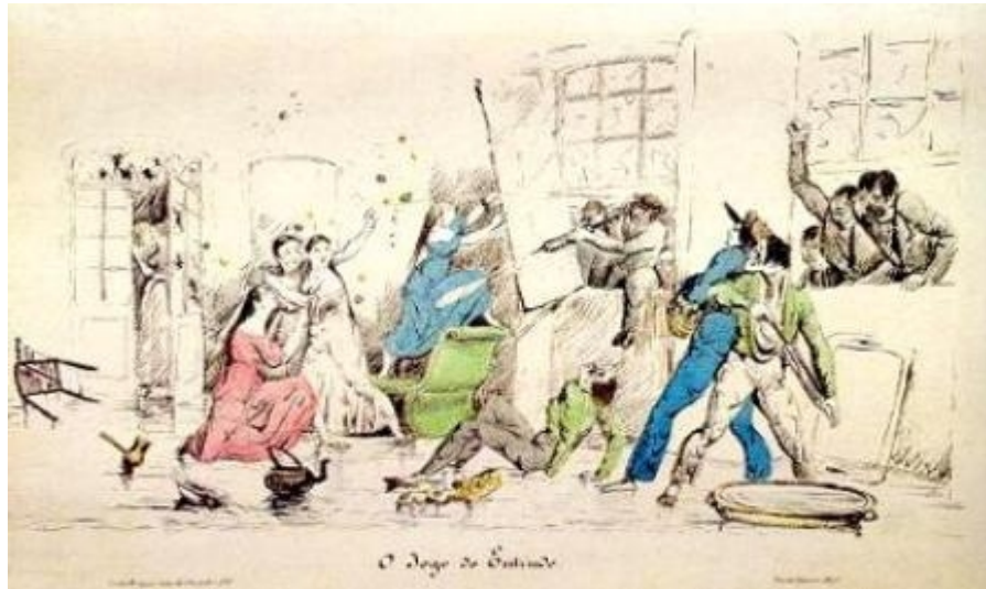
Desenho 1 O Jogo do Entrudo.

No Rio de Janeiro, os zé-pereiras eram uma das folganças em meio às brincadeiras do entrudo. Armados com seus bumbos a esmurrar, ritmavam os demais foliões fantasiados com suas bisnagas prontas para travarem um jogo de molhadelas. Ambos de origens lusas, o entrudo e os zé-pereiras se difundiram pelos mais variados locais da antiga capital, sendo praticados pelos diferentes grupos sociais cariocas e dividiram espaço com outras folganças, como os negros dos cucumbis e os fantasiados avulsos com suas guerras às cartolas. 86