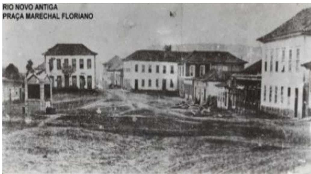
Fotografia 16 Antigo Largo da Matriz em 1875. Reprodução de Idelfonso Gonçalves. Fonte: acervo particular de André Colombo e da Fundação Chico Boticário.