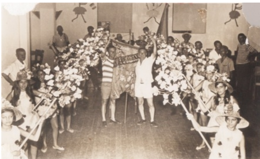
Fotografia 32 do bloco dos Explosivos “As Turmalinas” (1969).