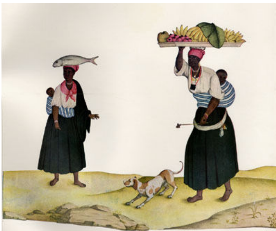
Figura 2- Figurinha dos uzos do Rio de Janeiro e Serro do Frio 201

Contemplar a materialidade da pequena atividade comercial desempenhada pelos indivíduos de ascendência africana é, por um lado, um dos aspectos mais complexos de nossa pesquisa, porém é também um dos mais interessantes, pois torna quase ‘palpável’ o olhar sobre tais comerciantes. O pintor Carlos Julião, que esteve na América portuguesa setecentista, ao representar iconograficamente o mundo do trabalho retrataria diversas vezes as negras comerciantes, dando algumas indicações importantes quanto ao modo de fazer da pequena atividade comercial.