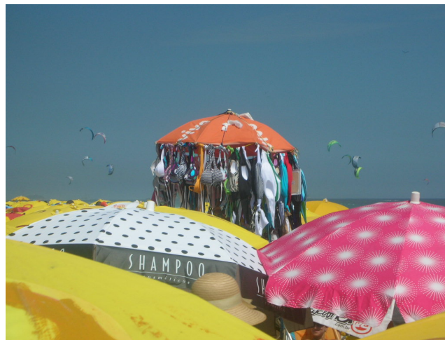
Foto 4 – Praia do Pepê completamente lotada.

O Rio de Janeiro, por suas paisagens exuberantes, e por ser uma “cidade praieira”, é uma academia de ginástica a céu aberto que propicia as práticas sociais relacionadas aos usos do corpo de forma bem peculiar ao ritmo agitado das cidades urbanas. A “Praia do Pepê”, localizada na Zona Oeste da cidade do Rio de Janeiro, na Barra da Tijuca, é um espaço privilegiado das camadas médias urbanas, com grande visibilidade no Rio de