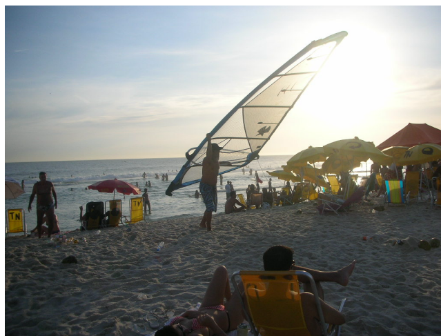
Foto 17 – Pôr do sol na Praia do Pepê.

Porém, na “Praia do Pepe” as pessoas celebram o convívio, o colorido do verão até o pôr do sol e exibem seus corpos adornados. Como tem muita gente bonita, acontece uma “azaração” discreta tipo “olhar 43”, quando não, uma piscadela de olhos do tipo “ give us a wink! ”, para não se tornar vulgar. Para mim, a “Praia do Pepê” é o lugar da celebração da amizade, da sociabilidade,