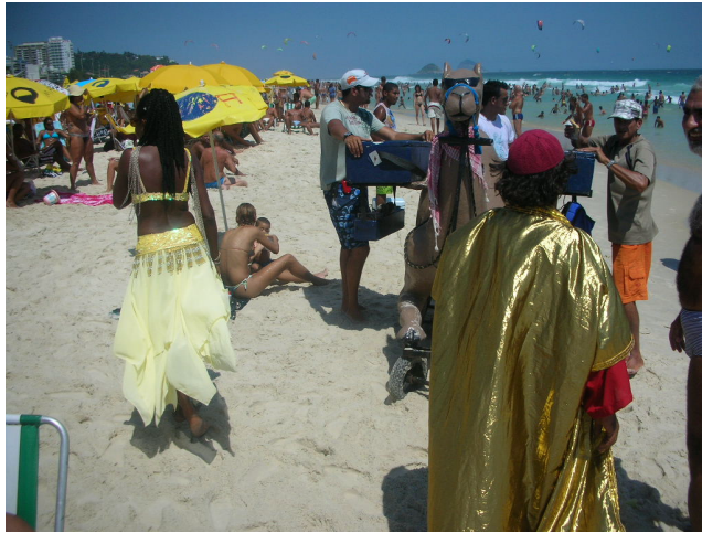
Foto 16 – O “Árabe” vendedor de sandwiches na Praia do Pepê.

Porém, na “Praia do Pepe” as pessoas celebram o convívio, o colorido do verão até o pôr do sol e exibem seus corpos adornados. Como tem muita gente bonita, acontece uma “azaração” discreta tipo “olhar 43”, quando não, uma piscadela de olhos do tipo “ give us a wink! ”, para não se tornar vulgar. Para mim, a “Praia do Pepê” é o lugar da celebração da amizade, da sociabilidade,