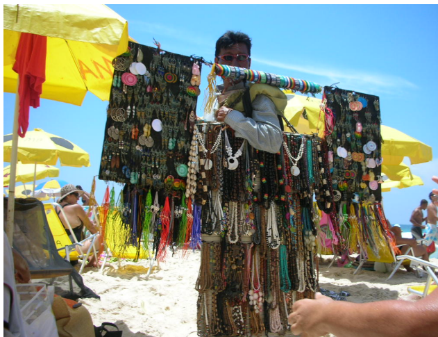
Foto 11 – Vendedora de bijuterias na Praia do Pepê.