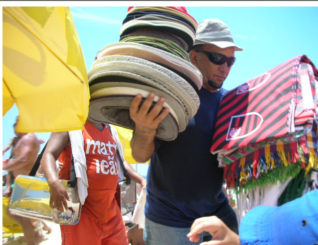
Foto 15 – Vendedor de chapéus na Praia do Pepê.