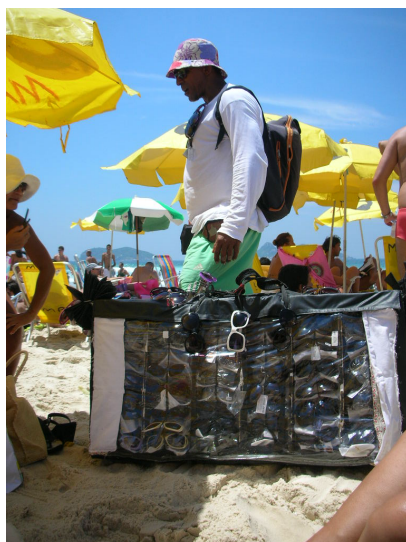
Foto 9 – Vendedor de óculos na Praia do Pepê.

brincos e pulseiras), cangas e vestidos. Tudo parece uma boutique ambulante, ao ar livre, ao sol quente de 40°.