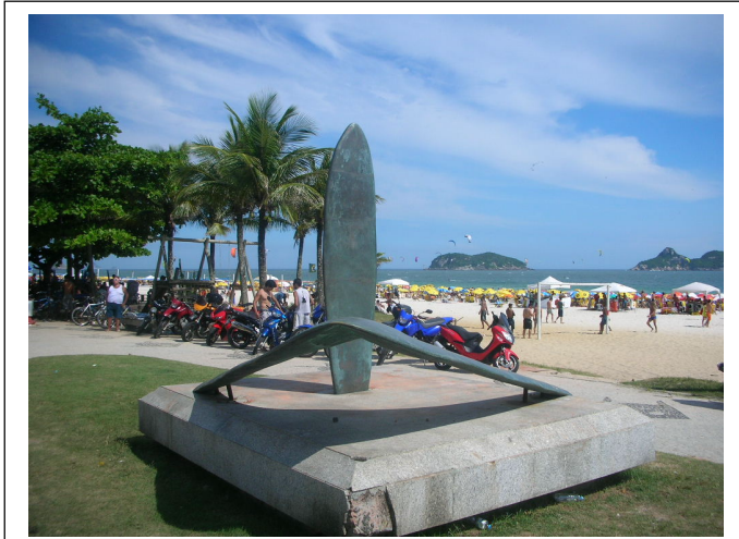
Foto 1 – Símbolo da “Praia do Pepê”.

A “Praia do Pepe” é uma praia da cidade do Rio de Janeiro, Brasil. Estende-se ao longo da “Avenida do Pepê”, próximo ao quebramar, na Barra da Tijuca, zona Oeste da cidade. A praia e a avenida foram assim batizadas em homenagem ao empresário e esportista Pedro Paulo Guise Carneiro Lopes, mais conhecido como Pepê.