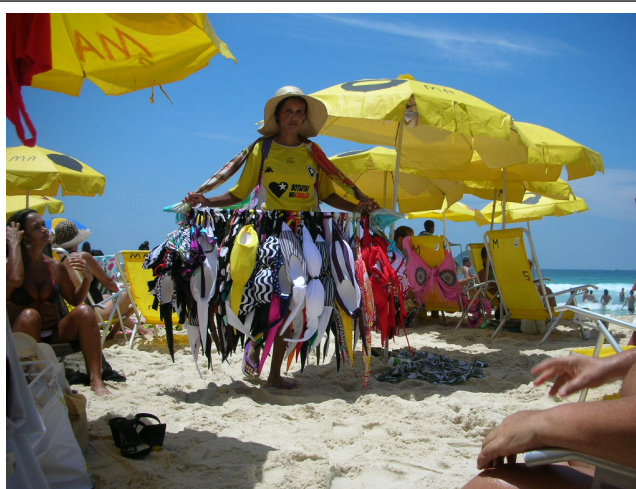
Foto 13 – Vendedora de biquínis na Praia do Pepê.