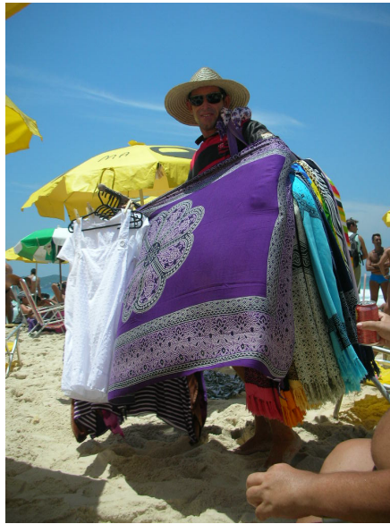
Foto 10 – Vendedor de redes na Praia do Pepê. Fonte: Arquivo pessoal do Autor