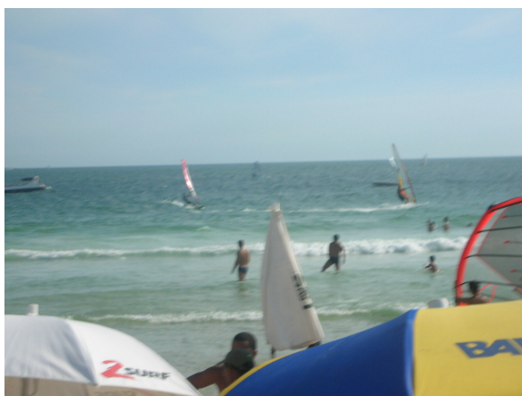
Foto 7 – Wind-Surf na Praia do Pepê.

“Parapentes”, que, além de colorir a praia, não são esportes baratos, muito pelo contrário.