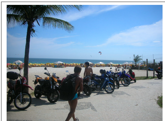
Foto 6 – Estacionamento de motos.

O que diferencia o espaço da “Praia do Pepê” das demais praias cariocas é justamente, o fato de ser conhecido pela mídia e por seus freqüentadores como o lugar dos “corpos sarados”, adornados, esculpidos, trabalhados, coloridos e belos, que enfeitam essa praia. À exaltação da corporalidade se junta o culto à diversidade de práticas sociais esportivas que ali se desenvolvem. A maioria das pessoas que ali vão freqüenta academias de ginástica ou até mesmo, praticam diversas modalidades de surf , tendo como ideologia principal o discurso da “saúde do corpo” e seus cuidados. Entrei no campo munido dessas informações disposto a investigar se, de fato, existe um imaginário social sobre os usos sociais do corpo nesse espaço da “Praia do Pepê”.