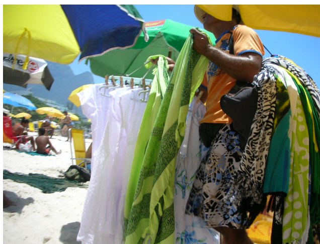
Foto 12 – Vendedora de vestidos na Praia do Pepê.