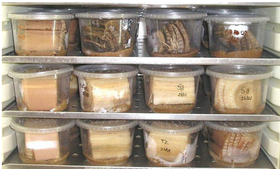
FIGURA 4 – Recipientes fechados com tampas perfuradas mantidos em câmara incubadora.

Os bioensaios foram realizados em delineamento inteiramente causalizado, com 6 repetições, cada uma constituída de um grupo de 5 indivíduos adultos de C. sordidus reunidos em recipientes plásticos.