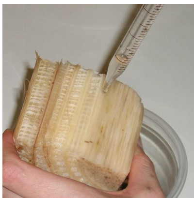
FIGURA 2 – Aplicação da suspensão de NEPs sobre pedaço de pseudocaule de bananeira.