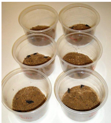
FIGURA 1 – Potes com areia umedecida e adultos de C. sordidus .

Em seguida, com auxílio de uma pipeta, a suspensão de água destilada com 100 Jls/cm 2 em um volume mínimo de 1 mL e máximo de 5 mL foi aplicada nos pedaços de pseudocaule de bananeira previamente cortados (FIGURA 2), sobre a face que posteriormente foi colocada dentro do recipiente voltada para baixo, em contato com a areia e os insetos (FIGURA 3). Na testemunha foi aplicado somente 1 mL de água destilada. Desta forma, todas as repetições de ambos os tratamentos sempre tiveram umidade variando entre 11 e 15%.