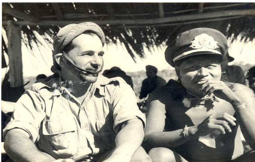
Figura 3 – Baldus em uma comunidade indígena.

científico é um mundo social que faz imposições que não são independentes das pressões do mundo social global que o envolve. Um dos problemas que o campo científico enfrentava, então, era a falta de recursos para desenvolver pesquisas. Baldus desejava estabelecer uma articulação com o S.P.I que permitisse a continuidade das pesquisas, principalmente, com a finalidade de obter financiamento para grupos que se destinavam a explorar, pesquisar e estudar em caráter científico as regiões do Planalto Central e da Amazônia.