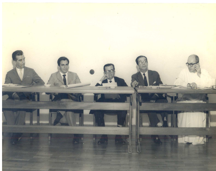
Figura 6 – Darcy Ribeiro em conferência com Anísio Teixeira. Da esquerda para a direita do leitor, Darcy é o segundo e Anísio é o quarto.

Vale registrar que a questão indígena foi objeto de preocupações de Darcy por toda a vida. No período em que atuou no S.P.I, entre os anos de 1947 e 1957, esse órgão viveu um período excepcional. "... foi uma época em que civis estiveram à frente do SPI, e em que pesquisas de caráter científico, promovidas pela Seção de Estudos, passaram a subsidiar a elaboração da política indigenista nacional". (LÔBO et alii, 2008, p.10). Comprometido com o destino dos povos indígenas, Darcy lutou pela defesa intransigente da integridade desses povos, suas culturas e territórios.