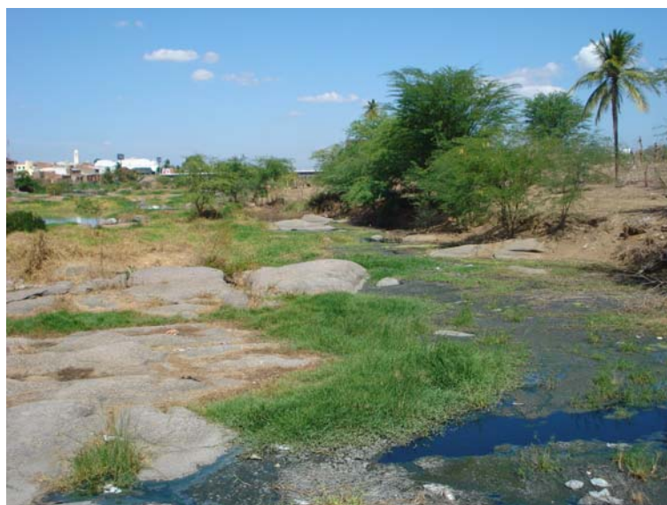
Figura 3.5.6 Carga poluidora de corantes no rio Capibaribe

Nessa área, há muitas empresas de pequeno porte distribuídas na extensão das margens do rio Capibaribe até a ponte onde é realizada a coleta da água do Rio a jusante do lançamento do efluente investigado. A figura 3.5.6 ilustra a poluição do rio Capibaribe pelo lançamento de efluentes ao corpo receptor sem o devido tratamento ( in natura ), contribuindo em muito para o processo de poluição ambiental, caracterizando um transporte de poluentes de natureza difusa além da descarga de esgotos domésticos localizados às margens do Rio.