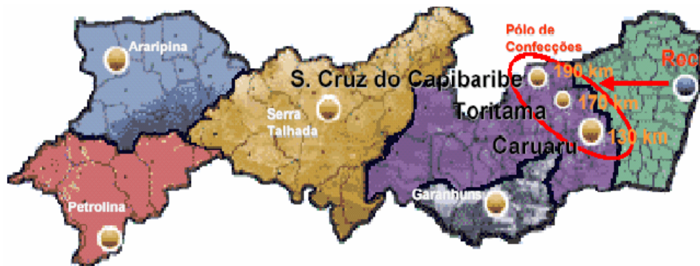
Figura 2.3.1 Localização do Pólo de Confecções do Agreste Pernambucano

O pólo de confecção pernambucano está localizado no Agreste abrangendo três importantes municípios: Caruaru, Santa Cruz do Capibaribe e Toritama que respondem por 15 % da produção nacional de jeans. No ano 2000, o município de Toritama foi responsável pela maior concentração de tinturarias e lavanderias, demandando um consumo mensal de 50.000 a 300.000 litros de água (IBGE, 2007).