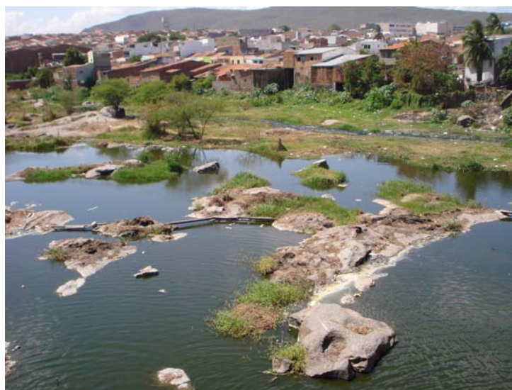
Figura 3.5.2 Lançamento de esgotos domésticos in natura nas margens do rio Capibaribe

Os resultados obtidos de OD são indicativos da presença de elevada concentração de matéria orgânica na água. Considerando que nessa região não há esgotamento sanitário, parte dessa poluição provavelmente é originada de esgotos domésticos,. A figura 3.5.2 ilustra o lançamento de esgotos domésticos ao longo das margens do rio no trecho investigado.