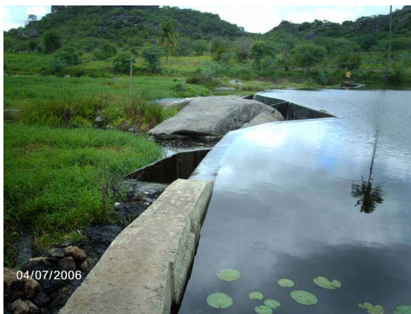
Figura 3.5.3 Barragem de água no rio Capibaribe a montante do descarte do efluente tratado de lavanderia e tinturaria industriais

Com relação ao transporte de materiais no rio Capibaribe no trecho analisado, próximo a ponte localizada a 340 m acima do nível do mar e que se constitui como a principal via de acesso ao município de Toritama e elo de ligação com as cidades de Caruaru e Santa Cruz do Capibaribe, do Pólo de confecções do Agreste, o fenômeno da advecção é desprezível considerando as duas barragens de água existentes. Uma dessas barragens é uma fonte de abastecimento de água de uma empresa de beneficiamento de confecções, onde as amostras E1 foram coletadas (figura 3.5.3). Essa fonte de água é regularizada oficialmente, pela Secretaria de Ciência, Tecnologia e Meio Ambiente do Governo de estado de Pernambuco, através da Secretaria Executiva de Meio Ambiente e Recursos Hídricos, que outorga o direito de uso de água do rio Capibaribe (Barragem), a um volume máximo de 300 m 3 /dia (4,17 L/s) para o abastecimento industrial. Após o processo industrial, a água tratada é devolvida ao manancial em condições de preservação do meio ambiente conforme os limites permitidos pela legislação em vigor (CPRH, 2006). A outra barragem de água é utilizada por outra indústria que trabalha no mesmo segmento têxtil e fica localizada próxima à estação de coleta E3 (figura 3.5.4).