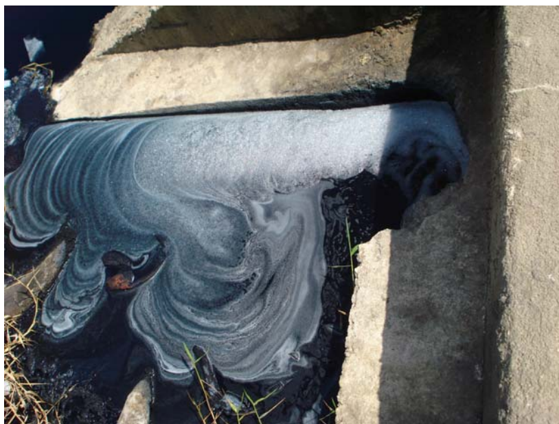
Figura 3.5.1 Lançamento de efluente de lavanderia e tinturaria industriais no rio Capibaribe em Toritama

As amostras de água do rio Capibaribe e do efluente tratado apresentaram aspecto visual límpido e incolor apesar do efluente da lavanderia e tinturaria industrial in natura ser de coloração azul intensa. A figura 3.4.3.1 ilustra o descarte do efluente sem tratamento prévio no rio Capibaribe realizado por Empresas do segmento.