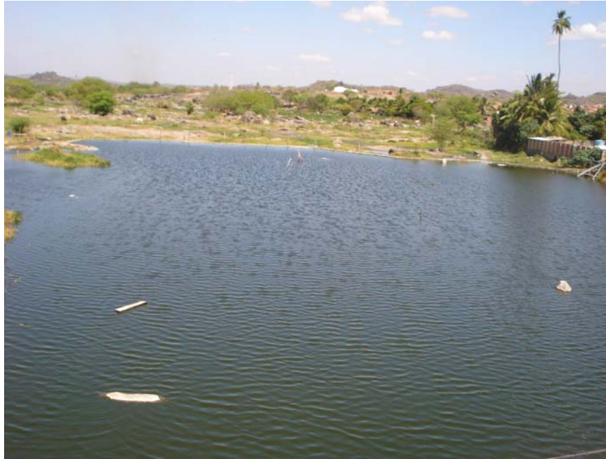
Figura 3.5.4 Barragem de água no rio Capibaribe a jusante do descarte do efluente tratado de lavanderia e tinturaria industriais

A indústria têxtil pesquisada em Toritama apresenta licença de operação de nº 02089/2007 concedida pela Agência Estadual de Meio Ambiente e Recursos Hídricos – CPRH (2007), enquadrando a empresa na tipologia de acabamento em fios, tecidos e artigos têxteis, código 3.1.1.1.2 – 7.5, do Decreto Estadual de nº 28.787/05, com atividade de lavagem e tingimento de roupas jeans. A presente licença faculta como exigência que os efluentes sanitários sejam encaminhados à rede coletora de esgotos, e que a empresa deverá realizar a manutenção preventiva no filtro e que dará o destino adequado ao resíduo sólido provenientes do tratamento do efluente industrial, conforme legislação em vigor.