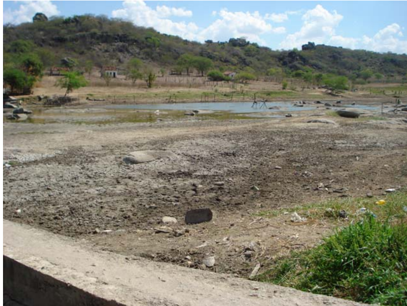
Figura 3.5.5 Barragem de água no rio Capibaribe no período de estiagem a montante do descarte do efluente tratado de lavanderia e tinturaria industriais

Nessa área, há muitas empresas de pequeno porte distribuídas na extensão das margens do rio Capibaribe até a ponte onde é realizada a coleta da água do Rio a jusante do lançamento do efluente investigado. A figura 3.5.6 ilustra a poluição do rio Capibaribe pelo lançamento de efluentes ao corpo receptor sem o devido tratamento ( in natura ), contribuindo em muito para o processo de poluição ambiental, caracterizando um transporte de poluentes de natureza difusa além da descarga de esgotos domésticos localizados às margens do Rio.