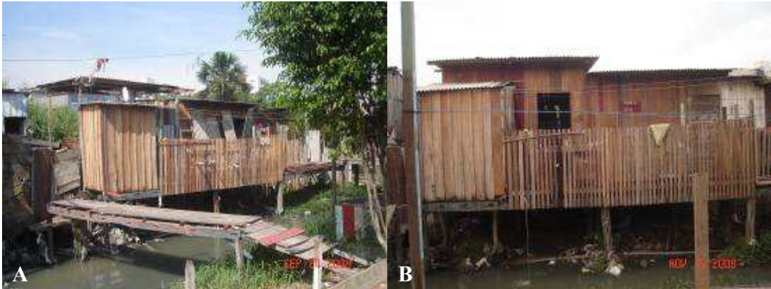
Figura 04 - Casa em reforma na localidade “Parte do Ouro Verde” - Manaus, 2008 (A) e Casa à venda na localidade “Parte do Ouro Verde” - Manaus, 2008 (B)

Um aspecto que pode ser destacado é que o movimento de um ou de alguns moradores na melhoria de suas casas parece estimular outros moradores a procederem da mesma forma, seja de modo real – também fazendo melhorias na sua própria casa - ou pela demonstração da intenção de fazê-lo ao armazenar material de construção na frente da casa. Este aspecto se assemelha ao apontado pelos estudos de Higuchi (1999; 2003), ao abordar que as mudanças realizadas nas estruturas das casas modificam também o status de seu morador dentro da comunidade e parece refletir na permanência ou não no local em decorrência das pressões exercidas pelos demais.