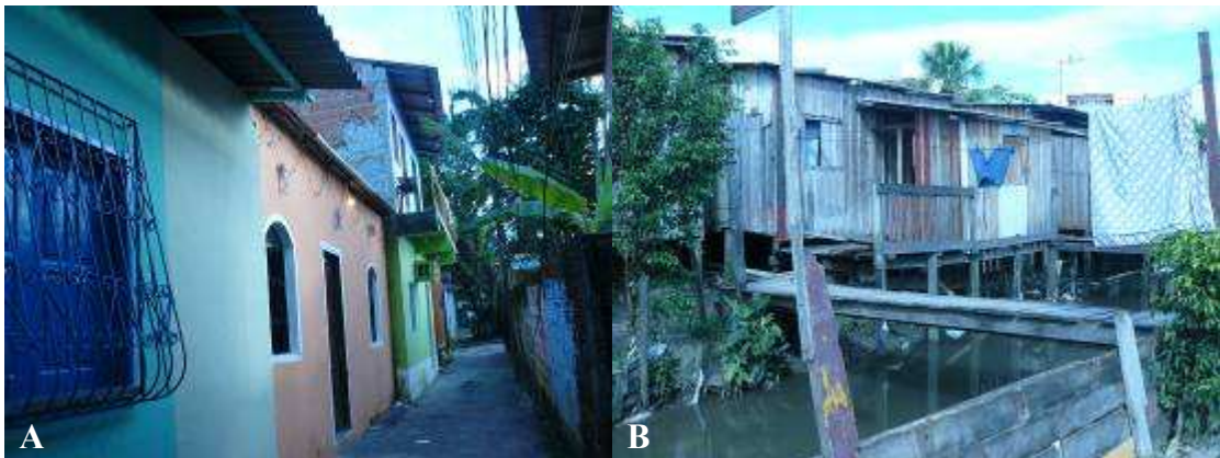
Figura 03 - Casas das primeiras etapas da localidade “Parte do Ouro Verde”- Manaus,2009 (A) e Casas mais recentes na localidade “Parte do Ouro Verde”- Manaus,2009 (B)

A transformação ocorrida no espaço ocupado e habitado reflete-se na reforma contínua das moradias que atualmente pouco lembram os barracos de compensado e papelão do seu início. Aos poucos os barracos foram ganhando formas de casas rústicas, de madeira com dois cômodos em sua maioria e hoje ao serem reformadas apresentam uma configuração bastante diferenciada das primeiras. Embora ainda construídas de madeira apresentam estruturas mais firmes e ampliadas. As primeiras etapas da ocupação são formadas por casas com melhor estrutura física e em sua maioria de alvenaria. As etapas posteriores especialmente as da margem esquerda e direita do igarapé bem como o meio situado entre as margens, ainda é formada por casas de madeira em sua maioria (Figura 03).