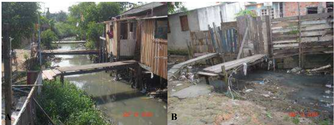
Figura 05 - As pontes se multiplicam na localidade “Parte do Ouro verde”- Manaus, 2008 (A) e se individualizam na localidade “Parte do Ouro Verde – Manaus, 2008 (B)

No interior da comunidade em virtude dos córregos, são necessárias estratégias de passagem para alcançar os becos de melhor acesso, deste modo são construídas pequenas pontes para circulação dos moradores na entrada de suas casas. Estas não diferem muito das pontes maiores tanto na sua estrutura quanto na sua finalidade, e igualmente retém o lixo que circula pelo córrego, razão pela qual também facilita o alagamento das casas quando das fortes chuvas. No entanto não parecem representar pontos de conflito visto que são construídas quase que individualmente atendendo a cada uma das moradias (Figura 05).