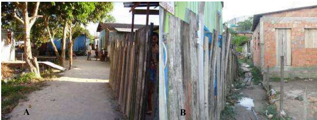
Figura 02 - O encontro possível/Beco Jesus Salvador na localidade “Parte do Ouro Verde”- Manaus, 2008 (A) Travessa São Lucas/margem direita na localidade Parte do Ouro Verde – Manaus, 2008 (B).

sentido, um beco pode expandir-se em diferentes direções ou mesmo cortar um igarapé e prosseguir em sua outra margem. Os becos estreitos também se apresentam como uma das poucas possibilidades de espaço para brincadeiras entre crianças e adolescentes e de encontro entre os moradores. São neles que se pode observar uma tentativa de compartilhamento seja no jogo de bola, na brincadeira com as pipas (papagaios), ou numa conversa entre os moradores. Também servem como espaço para a realização do assado de peixe no domingo ou no comércio de alimentação no dia-a-dia (Figura 02).