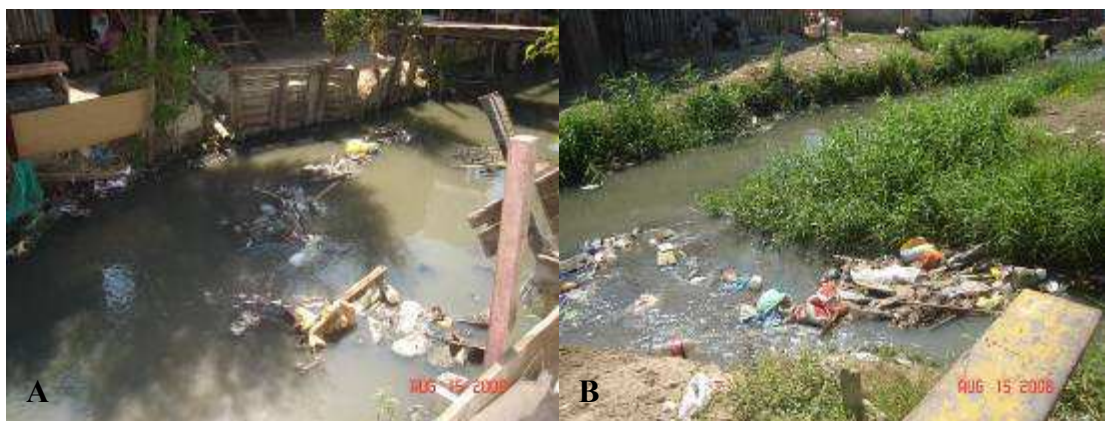
Figura 01 - Córrego atravessa a localidade “Parte do Ouro Verde”-Manaus, 2008 (A) e Igarapé onde deságuam os córregos na localidade “Parte do Ouro Verde”- Manaus, 2008(B).

Dessa forma, o panorama socioambiental do lugar encontra seus limites quanto a capacidade de suporte da densidade demográfica. Os buritizais cederam definitivamente o lugar às casas, em sua maioria de madeira e sem infra-estrutura básica, especialmente as que foram construídas na margem direita do igarapé nomeado Acariquara. O ambiente em que vivem os moradores atualmente é alagadiço, situado em área de charco e entrecortado por vários córregos bastante poluídos que deságuam no igarapé onde são jogados praticamente todos os dejetos e o lixo produzido pelos moradores. Essa situação vem causando problemas ambientais importantes e trazendo inúmeras dificuldades quando da época das chuvas, com o alagamento de várias casas, disseminação de ratos, baratas, cobras, problemas de saúde e em tempos mais secos, um odor fétido emanado do lixo que fica acumulado (Figura 01).