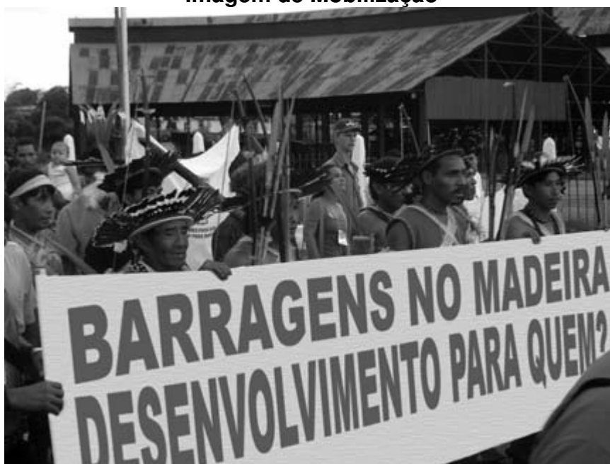
Imagem de Mobilização