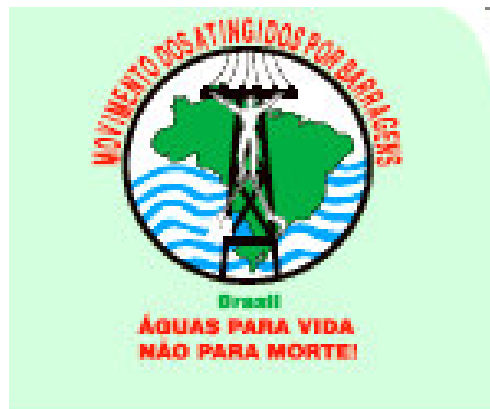
Figura 1 – recorte de material impresso I

Sob a perspectiva da Análise de Discurso, o enunciado “Águas para a Vida, Não para a Morte”, utilizado pelo MAB nas duas campanhas analisadas e nos demais materiais impressos de divulgação, encerra significados que remetem à uma percepção do ente “água” ancorada no cotidiano e na relação sócio-histórica estabelecida entre as comunidades atingidas e os recursos naturais, isso tudo colocado dentro de um apelo sensibilizador, pois destaca a oposição vida/morte associada à imagem de um homem sacrificado por uma torre de eletricidade.