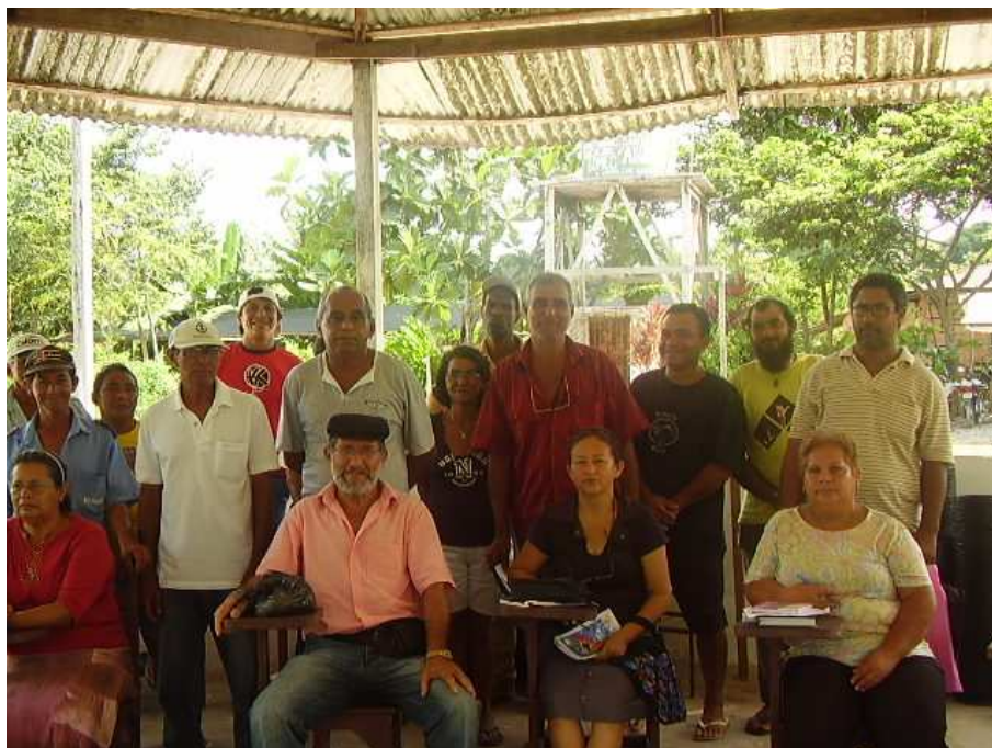
Figura 9: Término da Assembléia Geral na sede da COOPSANT Fonte: Edy Prado em dezembro de 2007