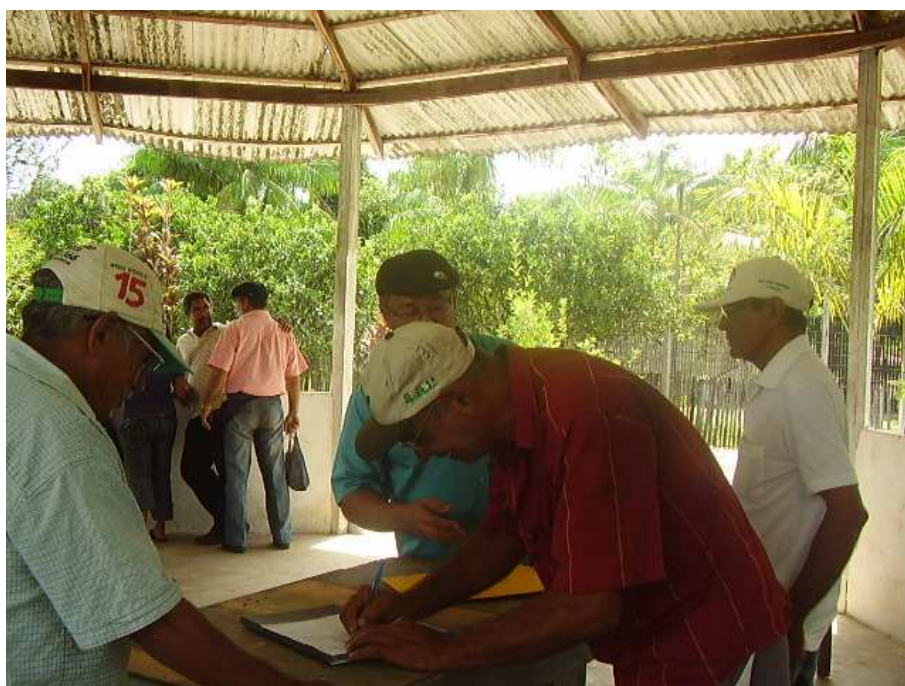
Figura 10: Assinatura da Ata no final da Assembléia Geral.