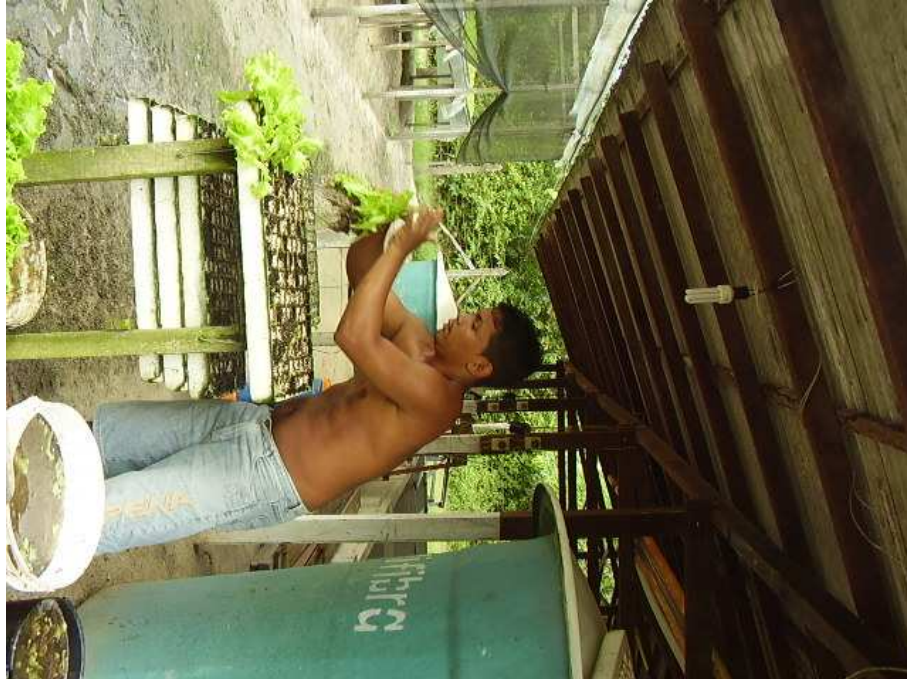
Figura 5: Familiar de cooperado no trabalho na atividade da hidroponia Fonte: Edy Prado em novembro de 2007