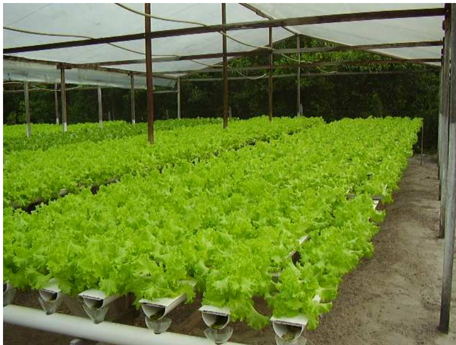
Figura 2: Produção de alface hidropônica na propriedade da cooperativa