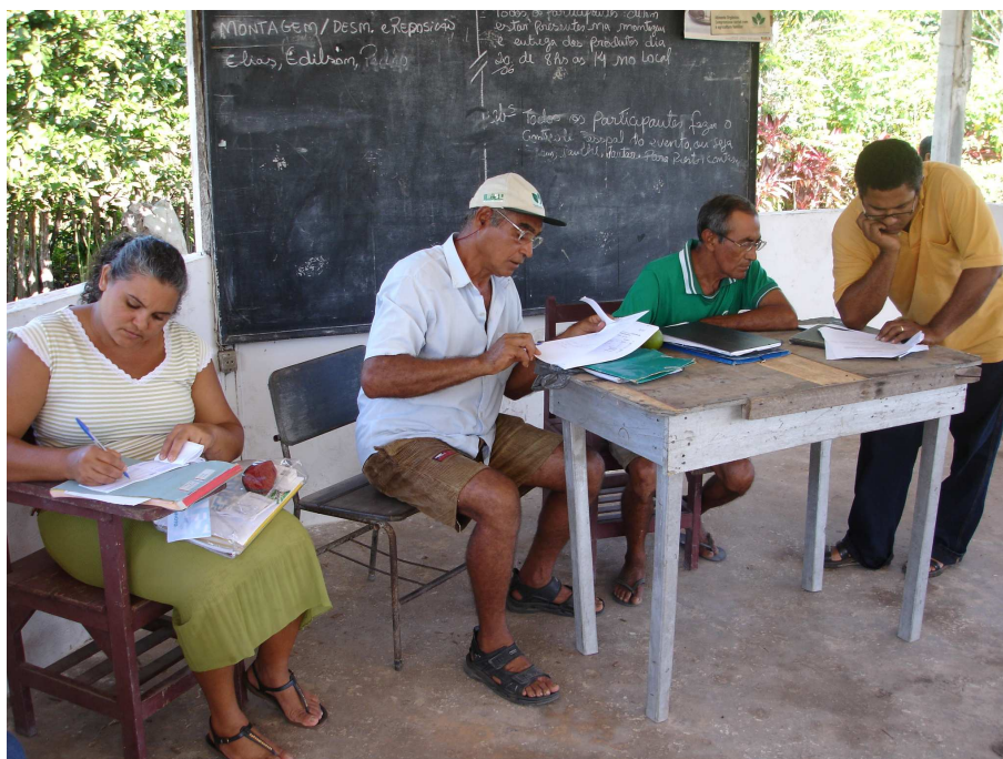
Figura 8: Assembléia Geral realizada em agosto de 2007 na sede da cooperativa. O presidente reunido com membros da diretoria