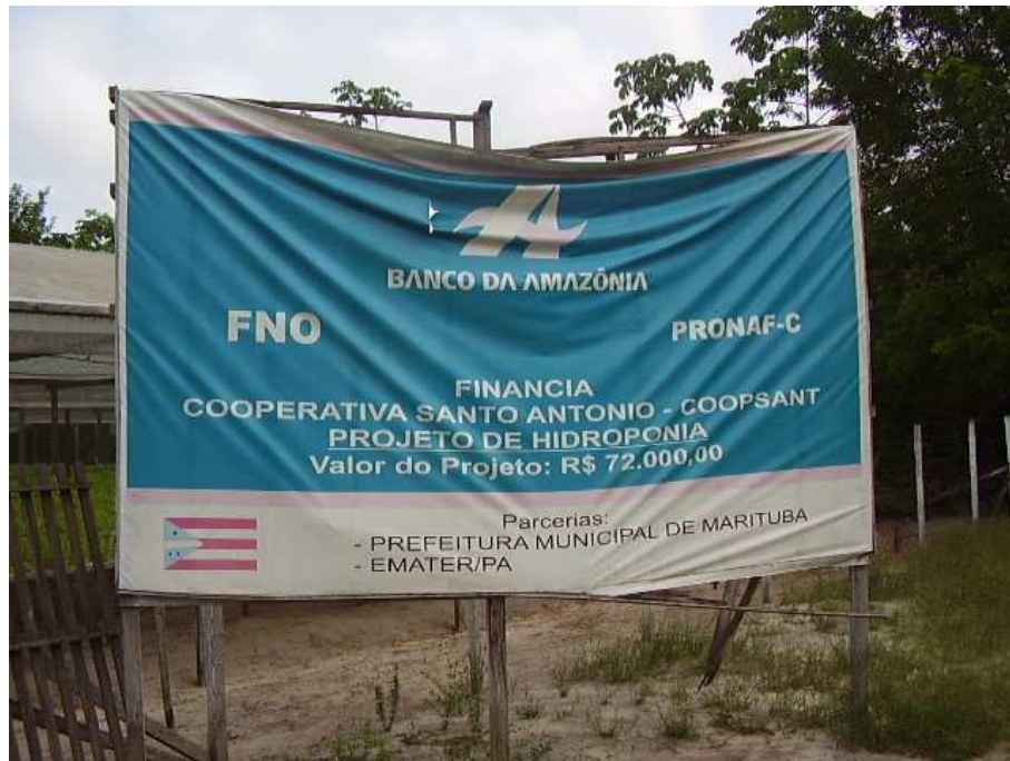
Figura 1: Entrada da produção de alface hidropônica. Banner que mostra a linha financiamento e os parceiros da cooperativa.