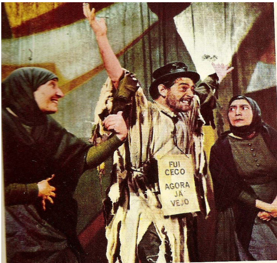
Figura 1 - O Cego e as Duas Comadres Fonte: Cardoso Pires, 1970 44

Um acontecimento ocorrido fora de cena insere na peça um momento de tensão dramática. Trata-se do assassinato do noivo de Maria Ricarda, o Acadêmico. A notícia chega à tropa de Alexandre, no Vilar, deixando Maria Ricarda transtornada a ponto de ela escrever uma carta ao pai, Dr. Silveira, insinuando que cometerá suicídio – mas isso de fato não acontece, como verificamos na primeira cena da terceira parte.