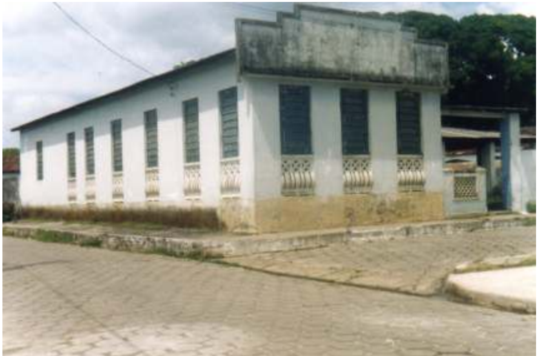
Fig. 09- Sede da Banda Milícia.