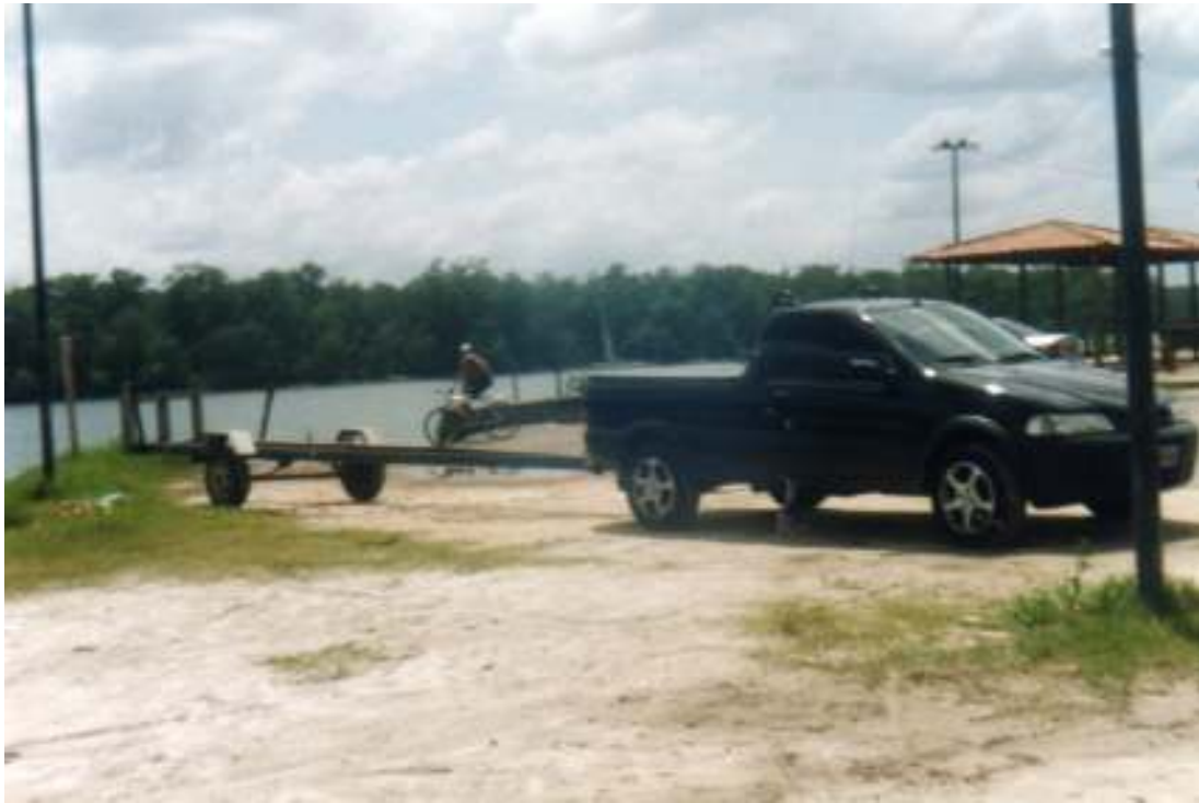
Fig.32- Parte da praia. Principalmente aqui neste trecho as pessoas que visitam São Caetano costumam estacionar seus carros até que voltem, em suas lanchas, da pescaria.