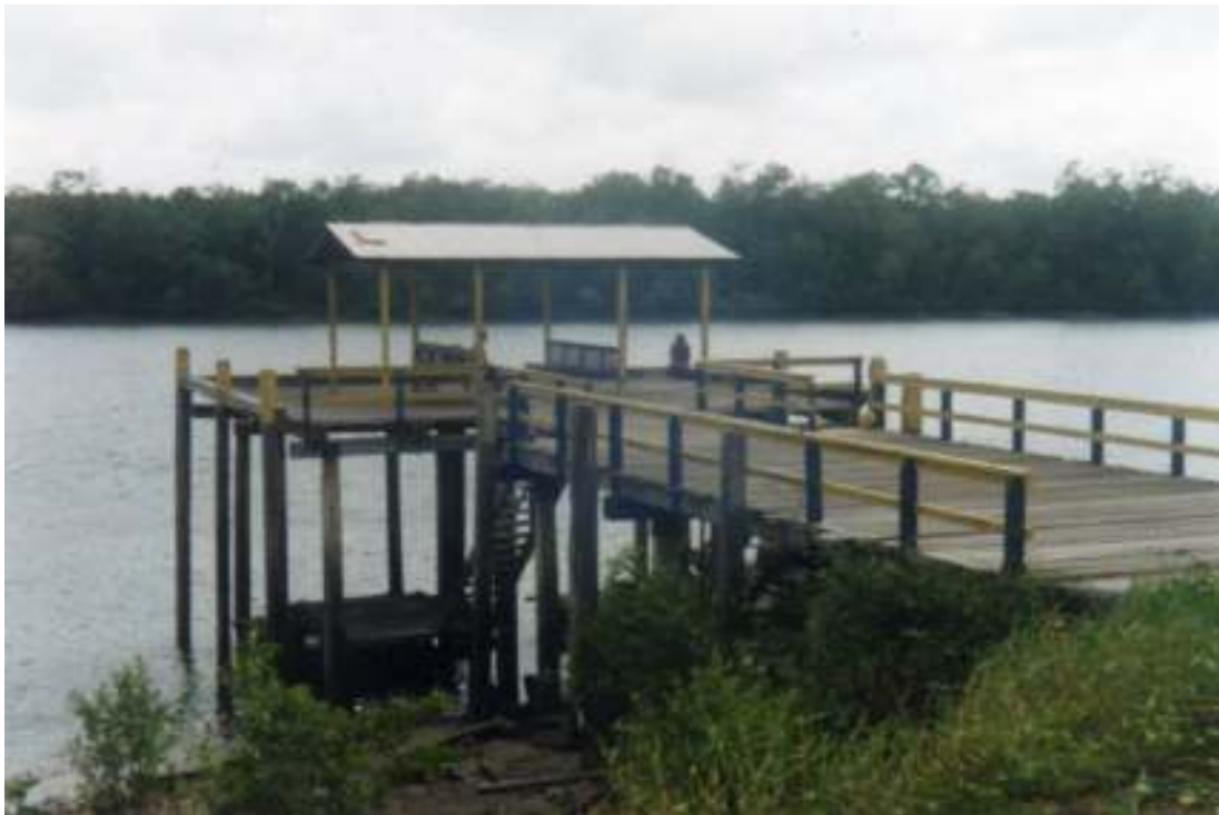
Fig.21- Trapiche, conversas e “viagens”.

É comum observar no comportamento do odivelense a ida à beira do rio, observar aquelas águas, que ora são verdes, ora são escuríssimas; olhar os vários furos que se perdem na visão de qualquer pessoa não revelando o seu término; assim como o movimento destas águas, permitindo um doce balançar dos currais ‘fincados’. Isto se perfaz em uma atividade muito constante na vida do odivelense. Esta beira de rio disputa esta função com as praças que são: Monsenhor Edmundo Igreja, Centenário e dos Pescadores que servem de ponto de encontro. Tais encontros também são realizados nos trapiches, principalmente por turistas, sobretudo naqueles que foram transformados em bares com o rio passando logo embaixo e servindo refeições baseadas na lógica da culinária local, peixes e crustáceos. Este lugar também serve para que as embarcações que chegam do rio ou do mar descarreguem tudo o que se conseguiu pescar, um pequeno comércio local logo se realiza aí, pois a maior parte do pescado não fica no município, por conta disto não é difícil encontrar situações sem ou com pouquíssimo peixe na cidade pelo escape deste para outros lugares, fator este que contribuiu para a mudança nos hábitos alimentares, complementando estes com o consumo de carne bovina e frango abatido.