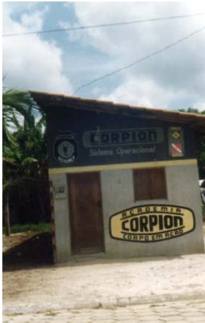
Fig. 31- Uma das duas academias que existem em São Caetano.

Recentemente foi construída uma praia pela atual administração do município que consistiu no aterramento de uma faixa de terra em frente ao rio Mojuim, bastante freqüentada no mês de julho pelos turistas e para a realização do Festival de Verão neste mesmo período. Há os que chamam para este local de “Praia do Jacó”, relacionando esta ao nome do atual prefeito.