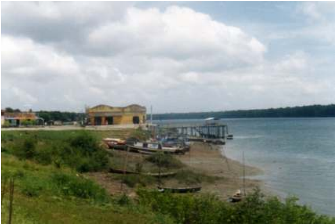
Fig. 10- Vista do rio Mojuim a partir da cidade. Ao fundo, em amarelo, o prédio do Mercado Municipal. E o trapiche que fica logo ali perto, o qual permite o desembarque do pescado.

Em São Caetano há duas escolas, uma mantida pelo governo estadual, é a Escola de Ensino Médio Osvaldo de Brito; e a outra mantida pela administração local, Escola Rosa Rocha, atendem não somente às necessidades dos moradores do núcleo São Caetano, ou da ‘cidade’, mas também das regiões vizinhas como é o caso do Camapú Miri, Monte Alegre, Aê, São João dos Ramos, Madeira, Ponta Bom Jesus, Boa Vista, Pererú de cima, Pererú de baixo-também conhecido como Pererú de Fátima- e Espanha. Há também outras escolas, estas, particulares e de ensino infantil.