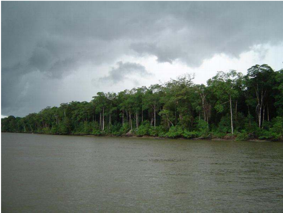
Fig.34- Visão do outro lado do rio Mojuim. 'A maré tava cheia'.