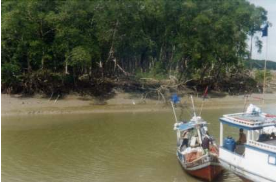
Fig. 13-Foto de cima do trapiche que fica próximo à PESCOL, o que facilita a chegada e desembarque do pescado que será aí beneficiado e logo deixará o município.

A pecuária e a agricultura não correspondem a maior parte do capital que circula naquela localidade, mas é esta que ainda representa maior expressão que aquela pela retirada do tucupi 15 , da goma 16 e da produção de farinha 17 , todos para consumo local, atrelada a esta agricultura de subsistência a população, para complementar sua alimentação explora o mangue de onde retira o caranguejo e o turu, que com a aparência de um verme é retirado das partes apodrecidas das árvores. Dos rios são consumidos a ostra, o siri e o mexilhão. Estes sendo mais encontrados no ‘tempo’ deles.