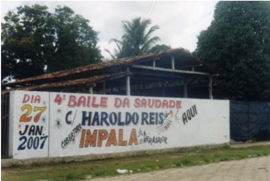
Fig.30- 'Sede do Impala' que é uma aparelhagem local.