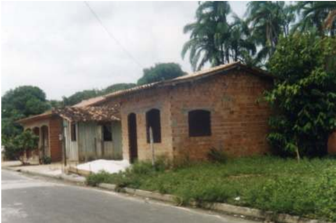
Fig. 02-Mostrando a mudança na arquitetura das casas.

É perceptível hoje que a arquitetura das casas tem ar de modernidade, construídas em alvenaria e cobertas por telhas de barro. Entretanto, durante muito tempo as casas foram construídas em barro ou madeira e cobertas com palha, conferindo ao lugar uma genuína aparência de região pesqueira. Mas, no bairro do Pepéua, pude observar um certo número de casas com as paredes em madeira e cobertas com palha. O local onde estão essas casas é um pouco afastado do centro de São Caetano e em alguma quantidade são de pessoas que migraram, principalmente do Maranhão para este município.