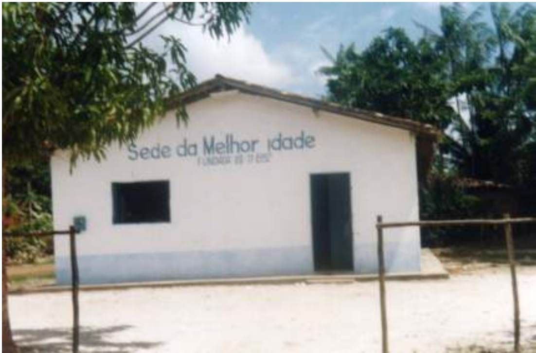
Fig.29- Localizada na estrada da Cachoeira.