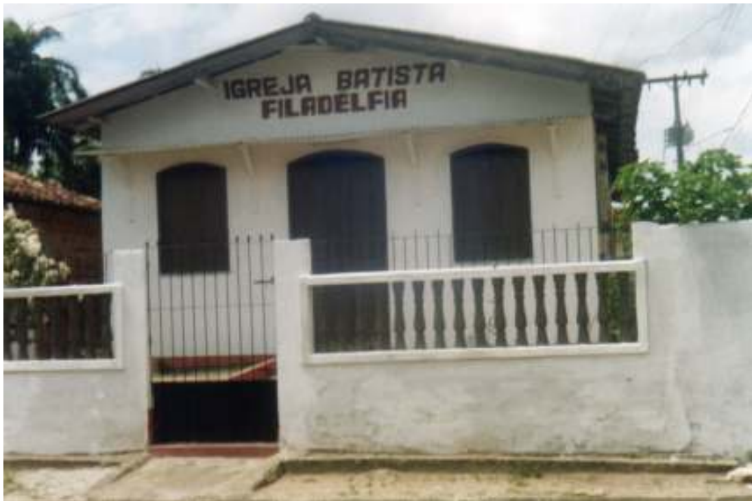
Fig.14- Igreja Filadélfia

No campo da religião há a igreja de São Caetano da Divina Providência, Adventista do Sétimo Dia, Deus é Amor, Filadélfia, Centro Espírita e o ‘trabalhos’ de curadores que aqui será aprofundado.