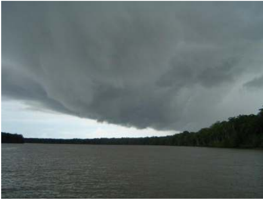
Fig.36-Rio Mojuim. Água, vegetação, céu e chuva se aproximando.

Cinco festas religiosas são realizadas anualmente com intensa participação da população: Bom Jesus, São João Batista, São João da Ponta, São Caetano (padroeiro da cidade) e Santa Cecília. As festas mais características são as de junho, onde os Bois, mascarados e pássaros juninos percorrem as ruas da cidade, destacando também o Festival do Caranguejo no mês de dezembro, atraindo muitos turistas para a região.