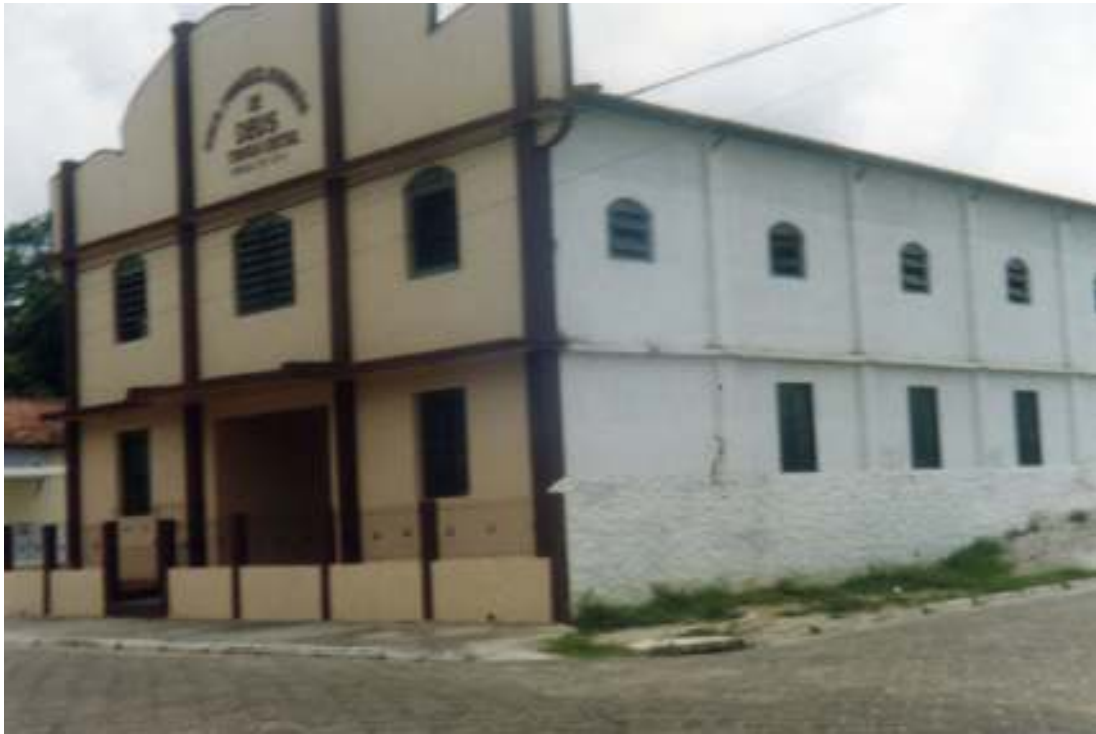
Fig.15-Assembléia de Deus.