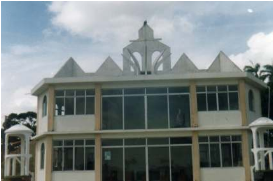
Fig.20- Igreja do Bom Jesus, em São Caetano.