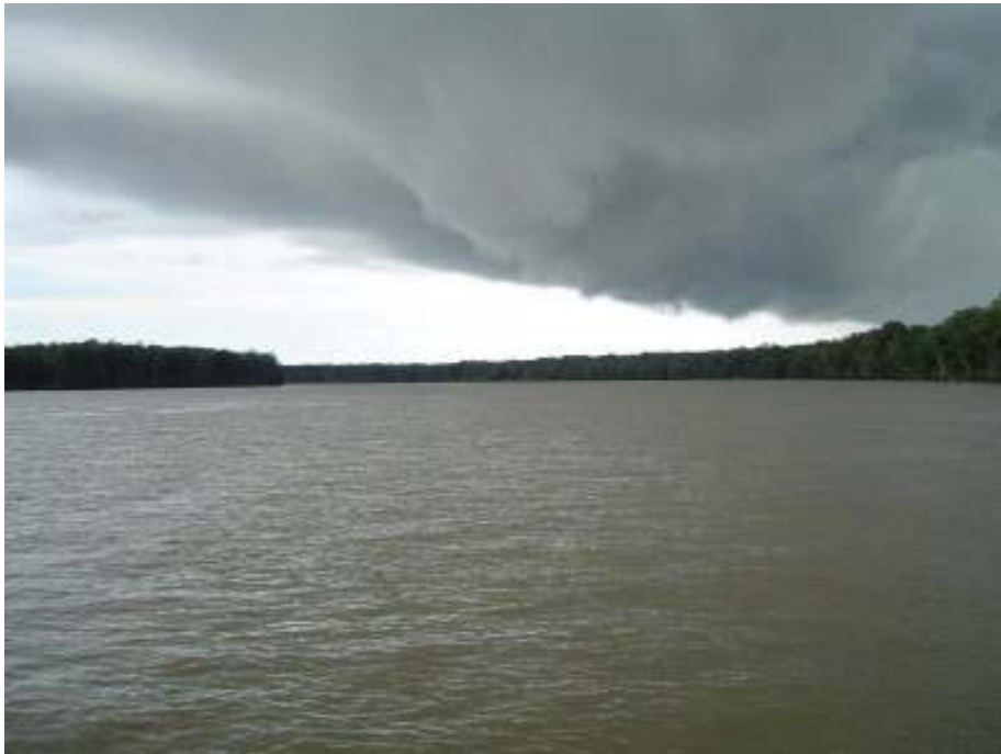
Fig.35- Rio Mojuim.