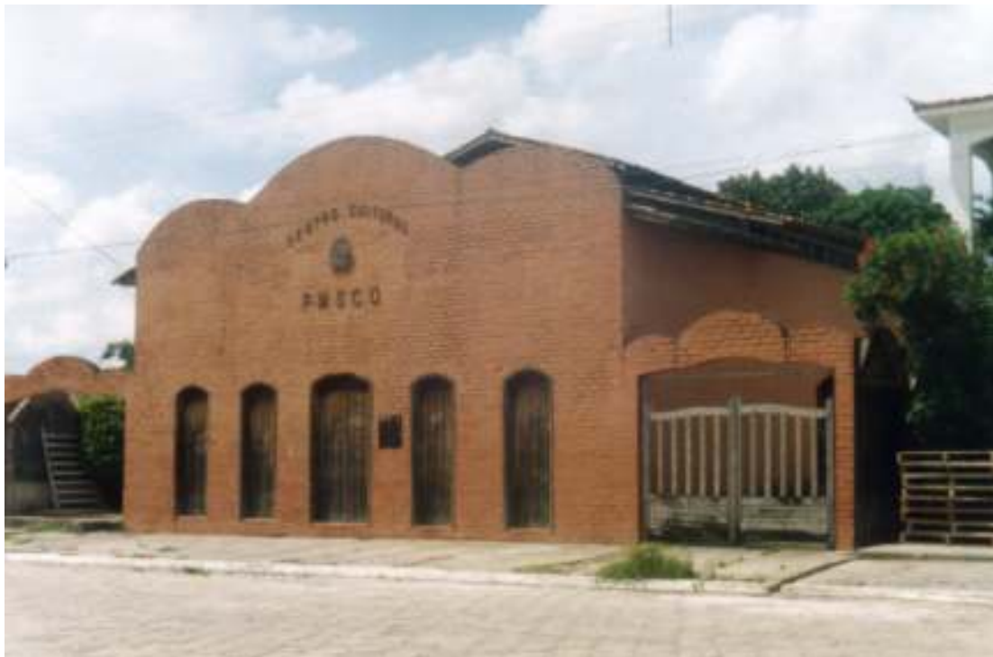
Fig. 07- Imagem do Centro Cultural.