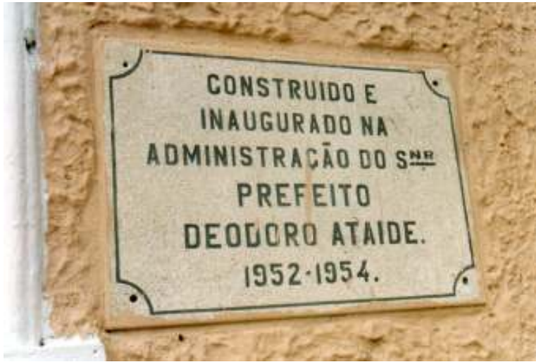
Fig.06- Placa que marca a fundação do prédio da Prefeitura.