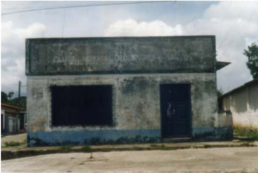
Fig.08- Sede da Banda Rodrigues.