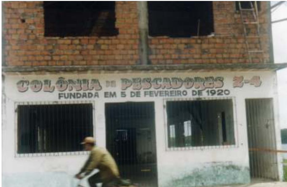
Fig. 05- Colônia dos Pescadores.

A Colônia dos Pescadores de São Caetano (Z-4) é fundamental para manter coesa esta parte dos indivíduos que garantem vida à economia local, possui uma hierarquia que permite a tomada de decisões para esta classe, mas nem sempre se verifica resultados práticos. Todavia, serve para reafirmar a condição daqueles que conferem a São Caetano sua característica de região pesqueira. Esta primeira colônia composta basicamente por homens, incentivou a criação da Colônia das Mulheres Pescadoras, não necessariamente composta por mulheres casadas com pescadores, mas por todas aquelas que desenvolvem esta atividade.