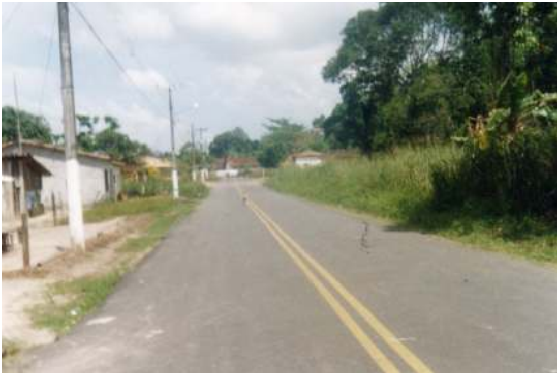
Fig. 11- Trecho da estrada que liga São Caetano ao bairro da Cachoeira.