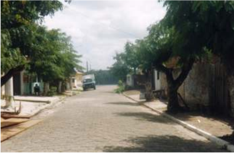
Fig.26- Uma rua.