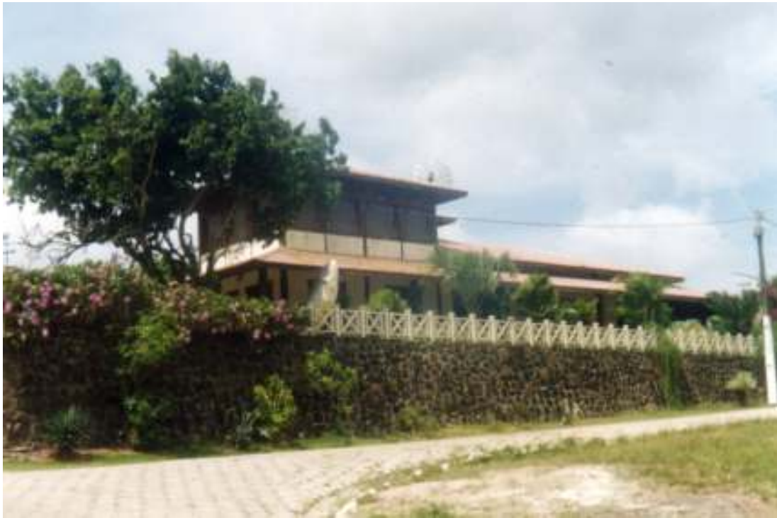
Fig. 03-Mais um exemplo de nova arquitetura.

Os prédios históricos, como o da Prefeitura, Câmara dos Vereadores e o Fórum, ainda possuem uma estrutura conservada de épocas anteriores, o máximo que se faz são sucessivas reformas para a conservação destes e da memória daquela cidade.