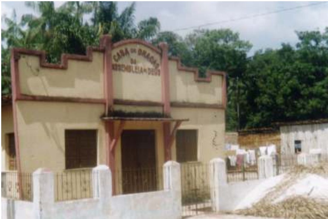
Fig.16 Assembléia de Deus situada no bairro da Cachoeira.