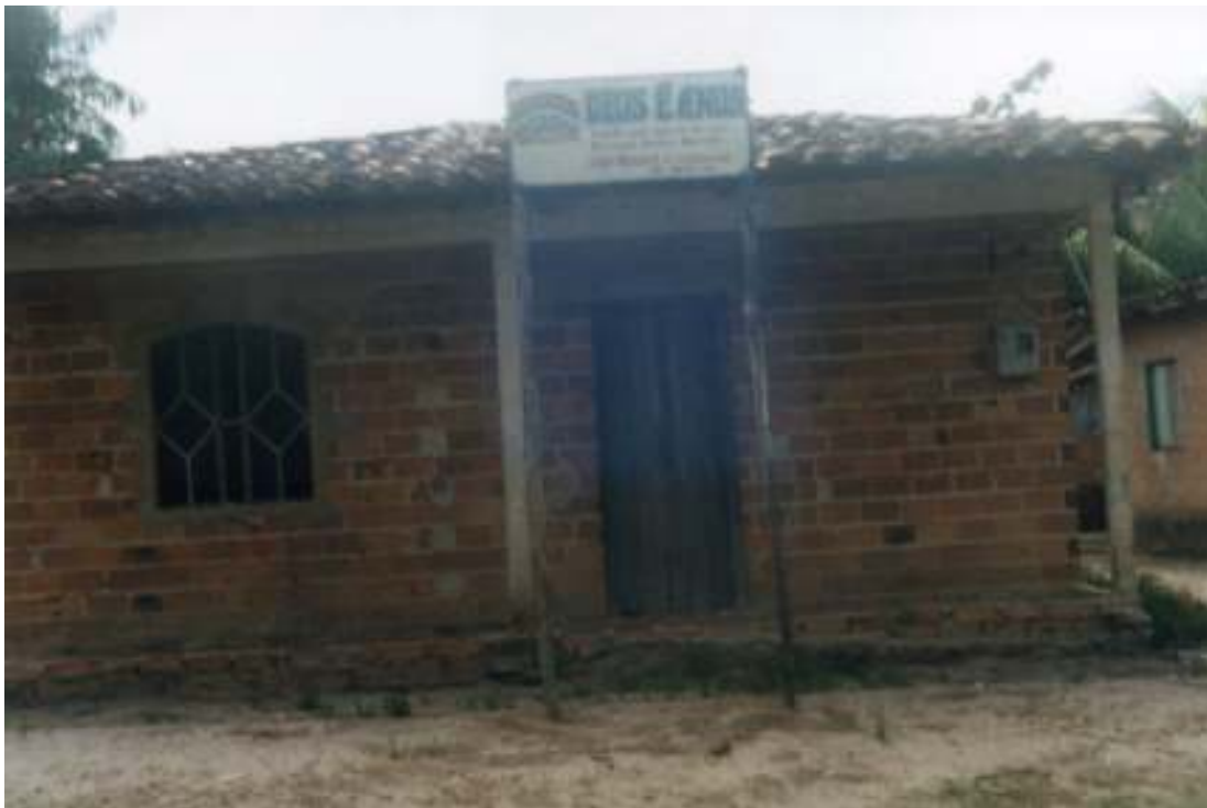
Fig.18- Outra Deus é Amor, em fase de construção, também na Cachoeira.