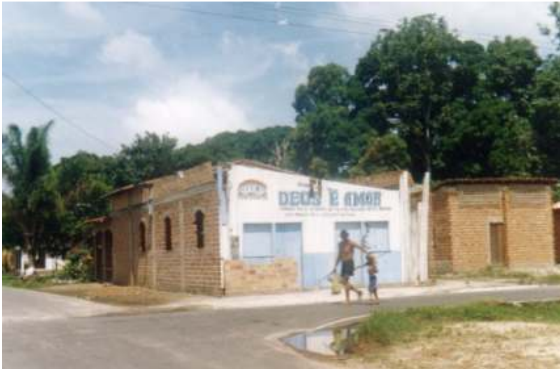
Fig.17- Deus é Amor na Cachoeira.