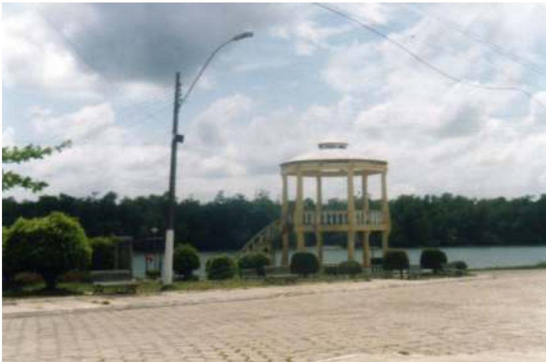
Fig.25- Praça em frente ao Centro Cultural.