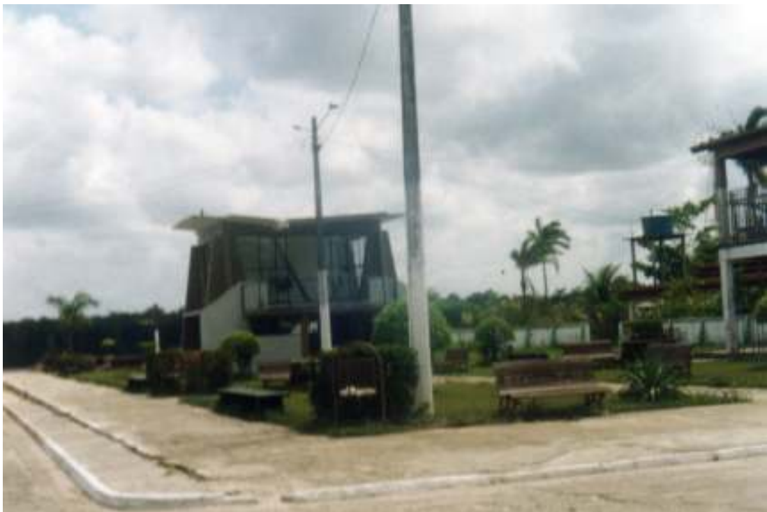
Fig.23- Praça em frente à Igreja do Santo Caetano.