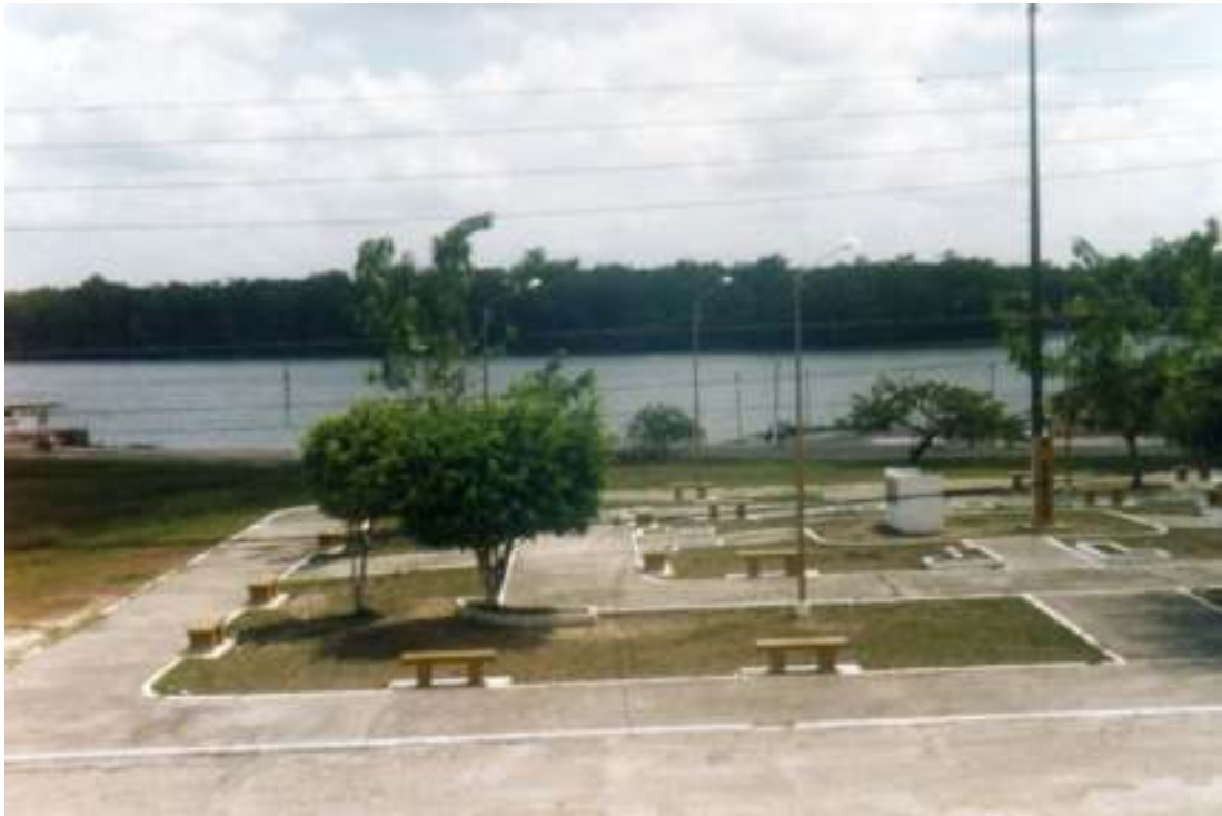
Fig.24- Praça em frente à Prefeitura.