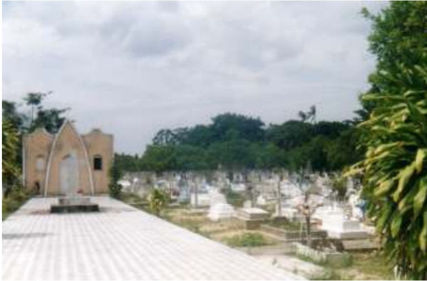
Fig.28- A capela e o lado direito do cemitério.