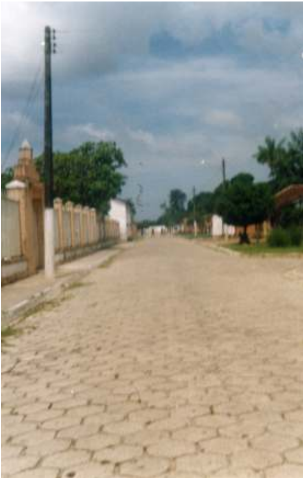
Fig.27- Outra rua. À esquerda, a entrada do cemitério.