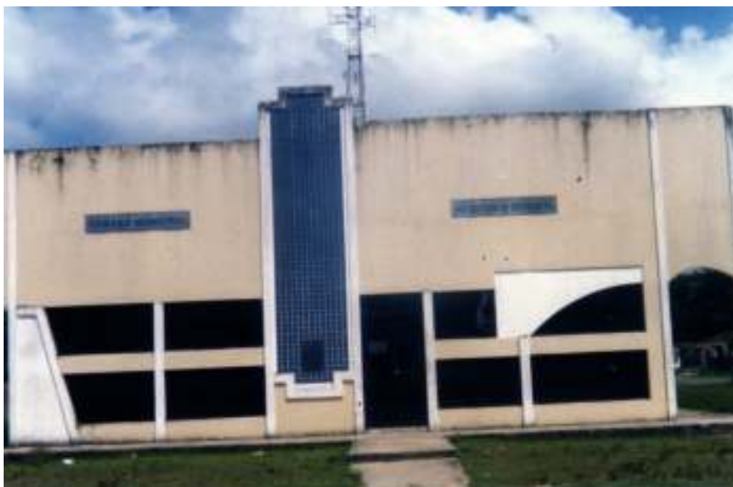
Fig. 04-Câmara dos Vereadores.

Os prédios históricos, como o da Prefeitura, Câmara dos Vereadores e o Fórum, ainda possuem uma estrutura conservada de épocas anteriores, o máximo que se faz são sucessivas reformas para a conservação destes e da memória daquela cidade.