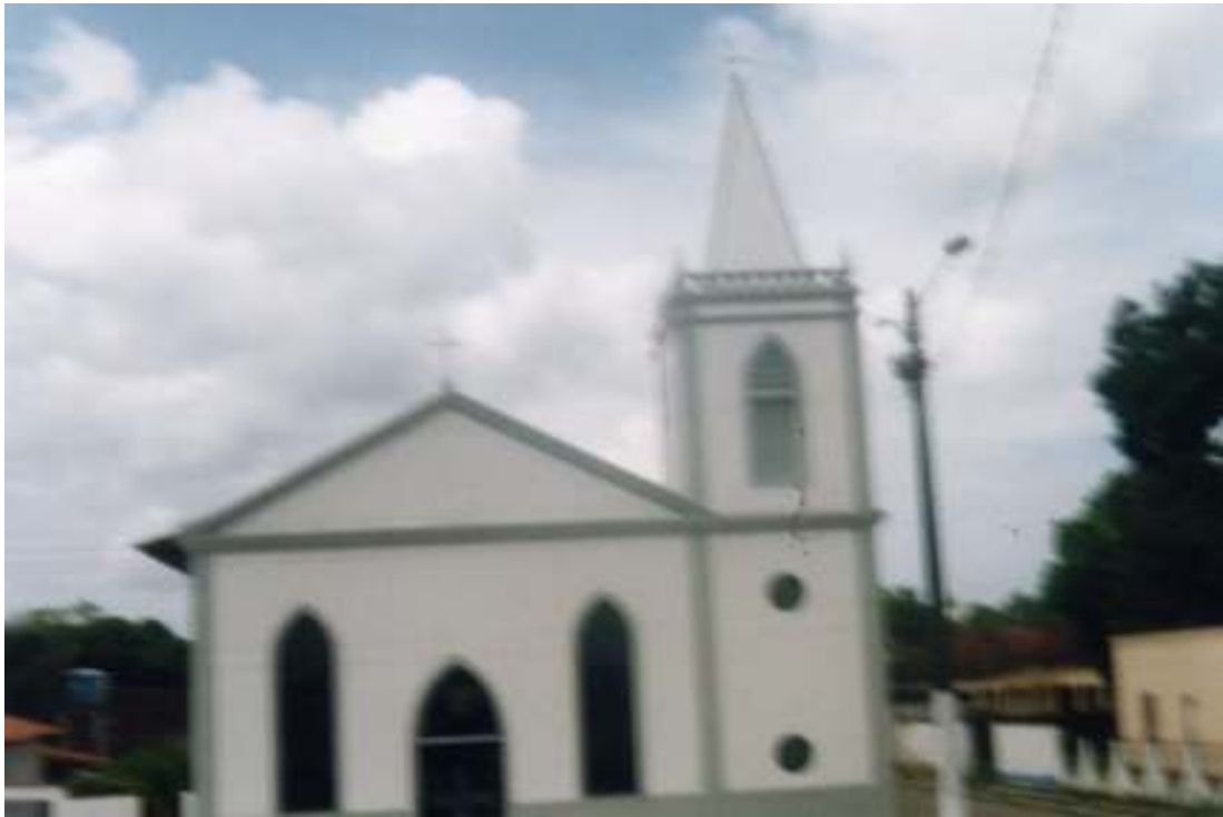
Fig.19-Igreja do Santo Caetano, em São Caetano.