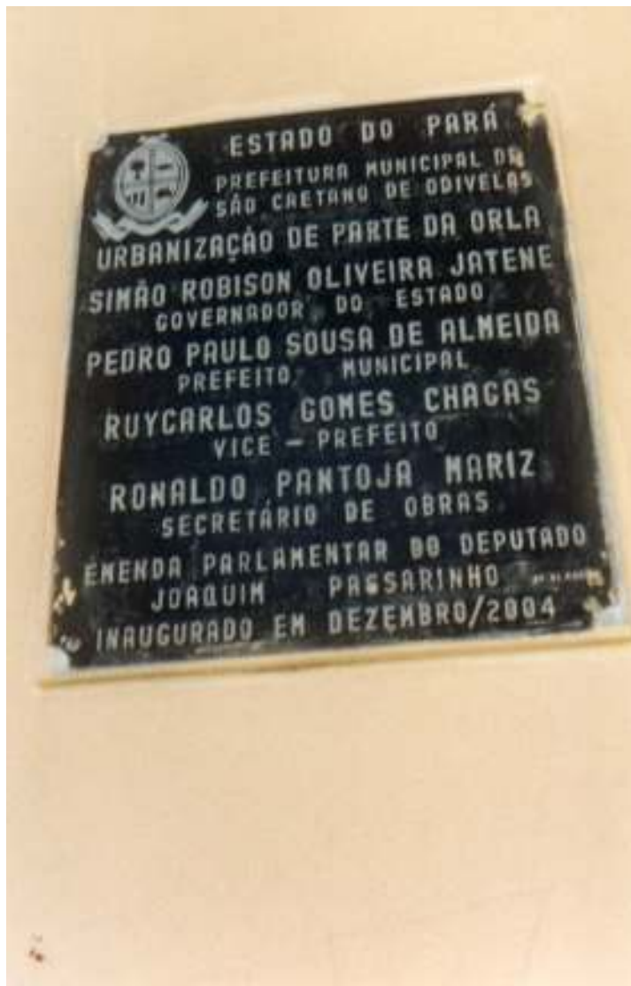
Fig.33-Placa que marca a entrega da orla à população odivelense.