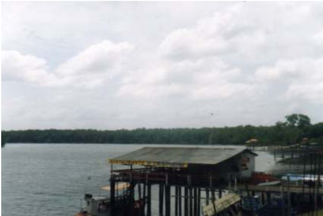
Fig.22-Um trapiche que é bar e restaurante.