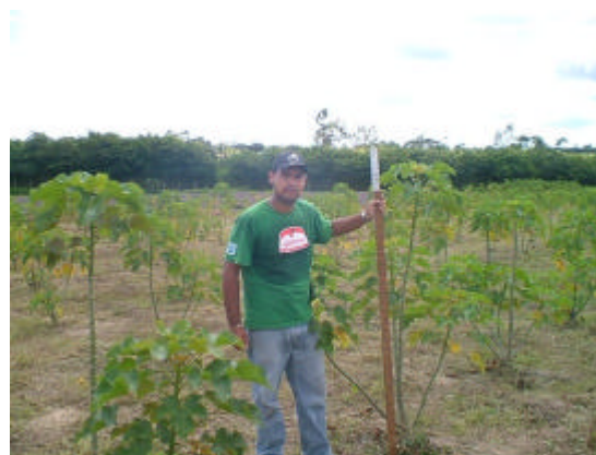
Figura 4A Leitura da altura da planta.