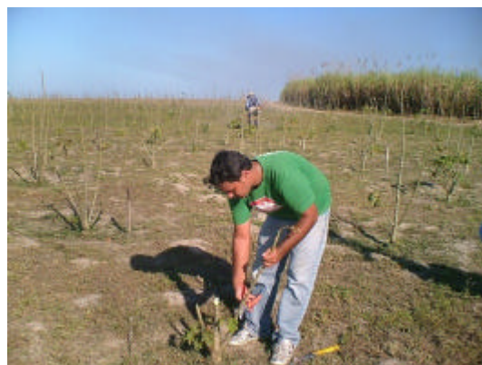
Figura 2A Poda da plantas