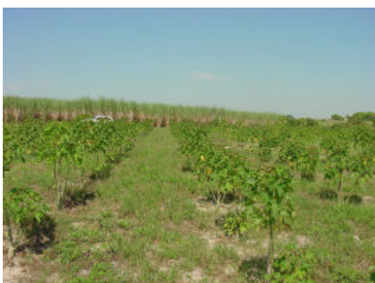
Figura 5A Visão geral da área