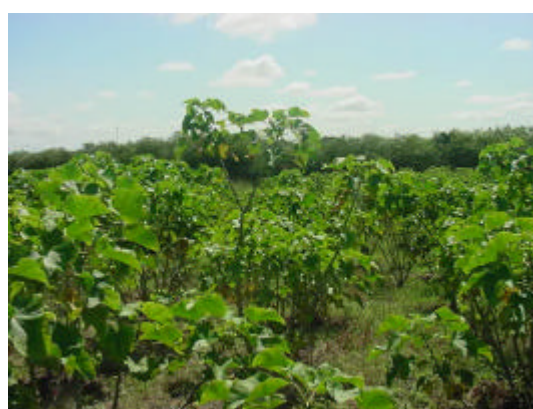
Figura 6A Visão das plantas