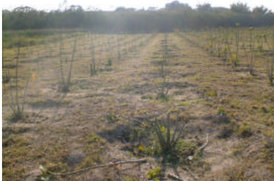
Figura 3A Área depois de podada.