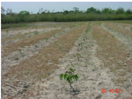
Figura 1A. Plantio