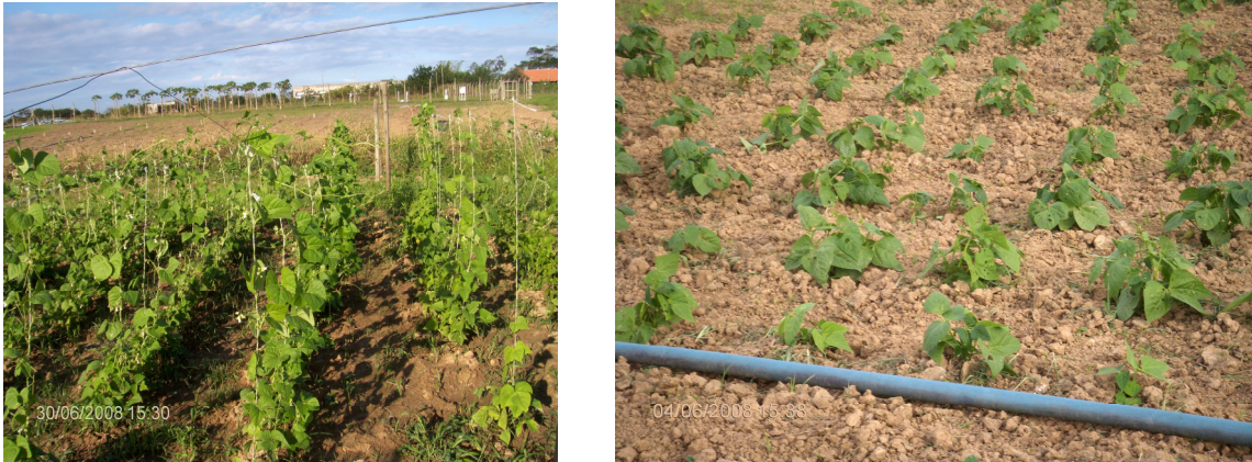
Figura 4. Foto ilustrativa do experimento com o feijão-de-vagem na Unidade Experimental da PESAGRO- CAMPOS/RJ.