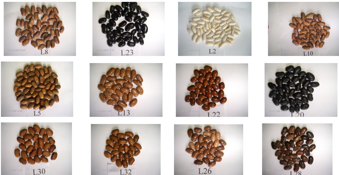
Figura 5. Fotos ilustrativas dos grãos do feijão-de-vagem colhidos nos experimentos de Campos dos Goytacazes e de Bom Jesus de Itabapoana.