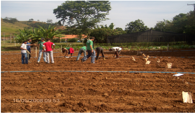
Figura 2. Plantio do feijão-de-vagem na Unidade Experimental de Bom Jesus do Itabapoana