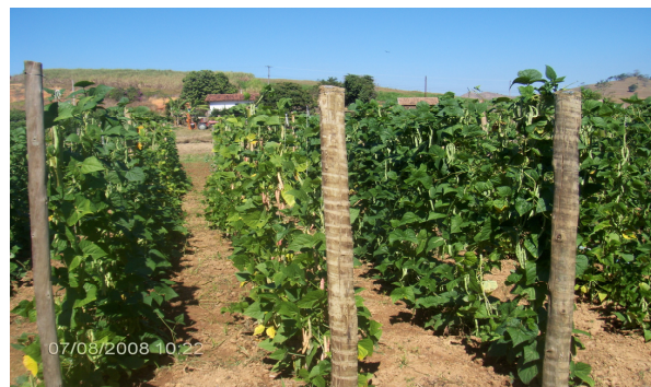
Figura 3. Foto ilustrativa do experimento com o feijão-de-vagem em Bom Jesus do Itabapoana