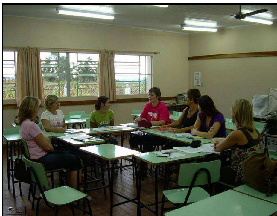
Figura 1: Grupo de estudos na Escola Piloto de Venâncio Aires