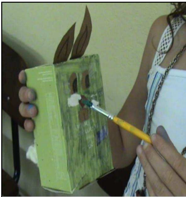
Figura 6: Os animais I