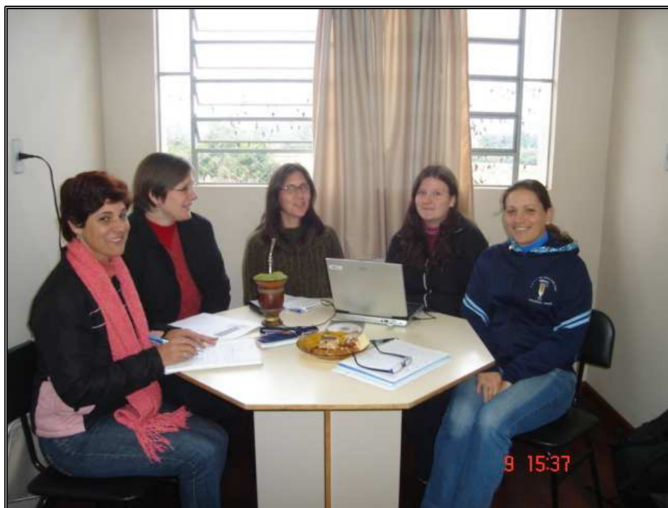
Figura 3: Escola Piloto de Venâncio Aires