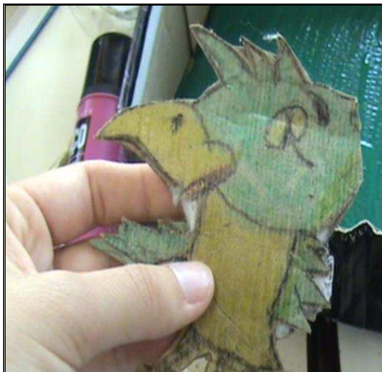
Figura 7: Os animais II