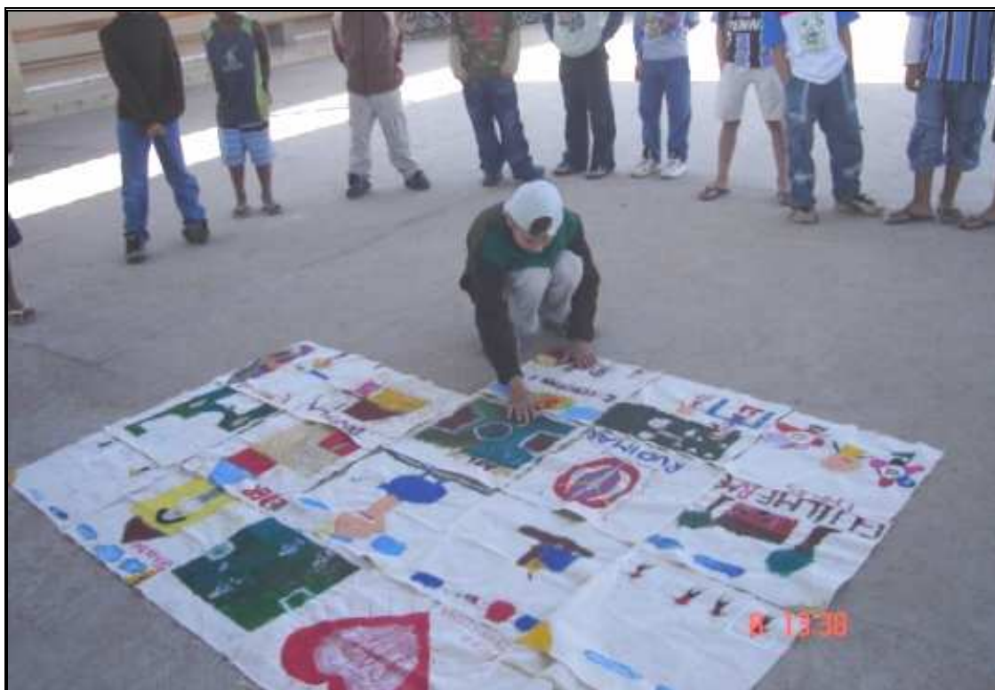
Figura 4: O lençol mágico