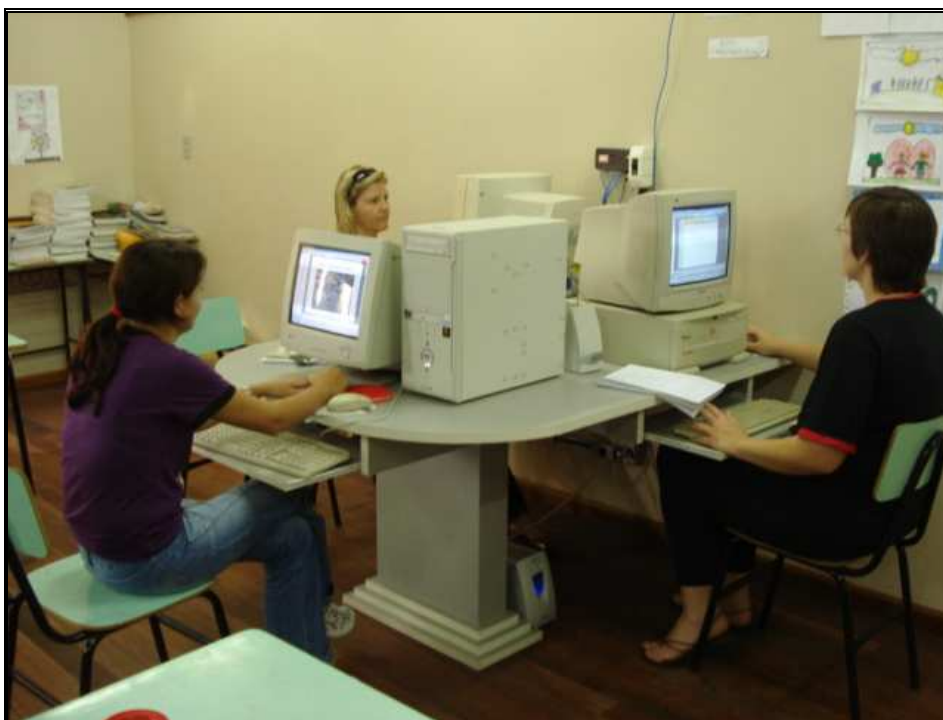
Figura 2: Oficina Tecnológica