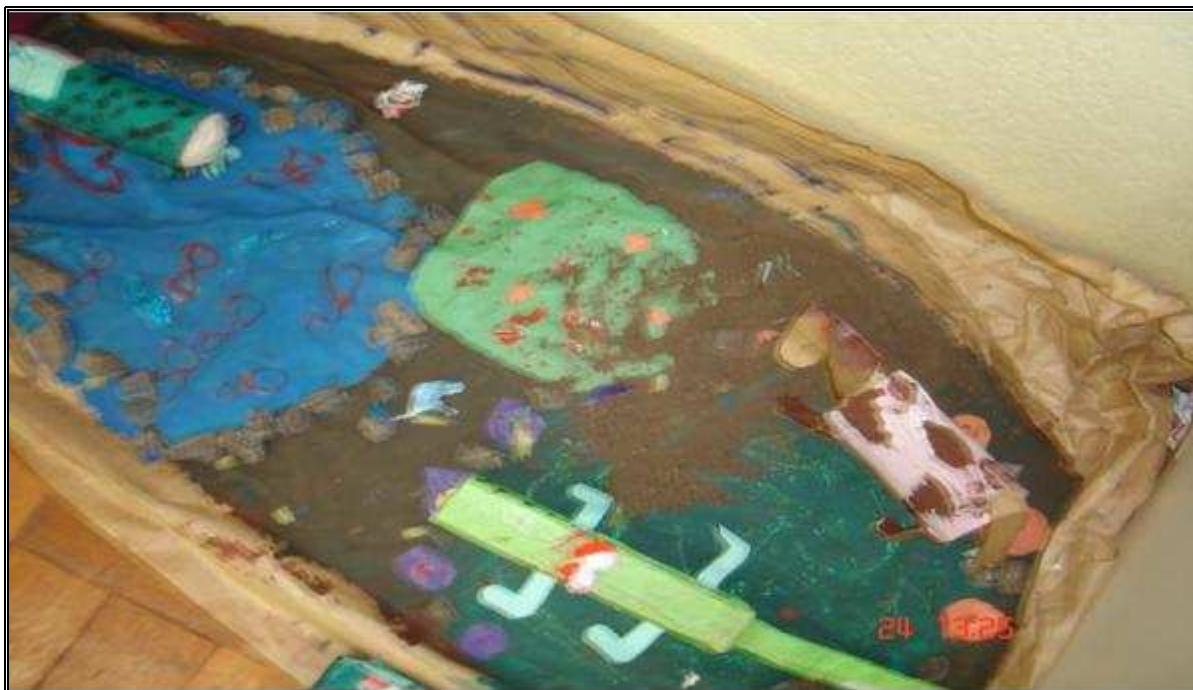
Figura 5: Os personagens e o habitat produzido pela turma