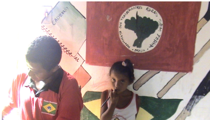
FIGURA 9 – Sala de aula da escola Raimundo Cabral.

pelas crianças. A Secretaria possui uma mesa, cadeira e armários; o que dá a ela uma aparência de biblioteca 41 , uma das grandes carências das escolas do Assentamento.