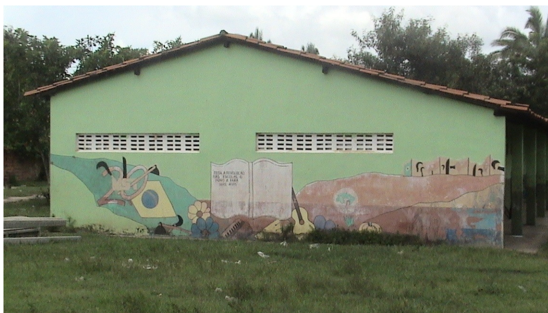
FIGURA 10 – Escola Luzia Mendes

seguinte frase de Florestan Fernandes: “feita a Revolução nas escolas, o povo a fará nas ruas”. Esta frase escrita num desenho semelhante a um livro aberto está rodeada de figuras, tais como; enxada, facão, foice, flores, a bandeira do Movimento, violão, bandeira do Brasil e o número 20, indicando à época, a comemoração dos 20 anos de MST no Brasil. Dentro da escola, os símbolos continuam, são cercas sendo rompidas, crianças em volta da bandeira do Movimento, além de muitas árvores demonstrando o verde do Assentamento e a necessidade de preservação das matas, florestas e rios.