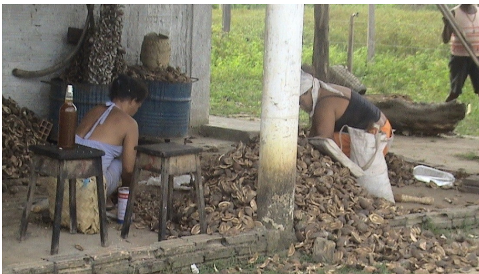
FIGURA 6 – Mulheres quebrando coco.

O coco desta região, rica em babaçuais, é também outra fonte de obtenção de sustento, pois, além das amêndoas aproveita-se o mesocarpo, rico em substâncias nutritivas, e o azeite. Este recurso natural foi objeto de disputa política e de poder, uma vez que muitos fazendeiros tentaram controlar sua extração, dificultando, assim, o acesso dos trabalhadores ao produto, provocando riscos e humilhações aos que se dedicavam a esta atividade. A estas dificuldades acrescentaram-se, ainda, os baixos preços 33 , do coco e dos seus derivados produzidos no Assentamento e em todo Maranhão.