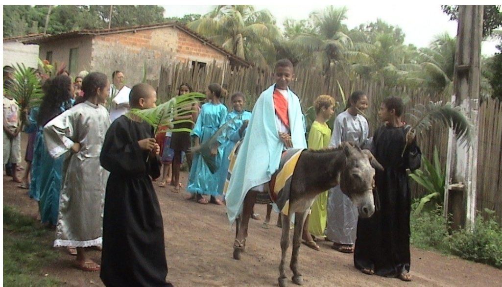
FIGUFIGURA 7 – Procissão de Domingo de Ramos

Os festejos, também, têm papel importante na vida e atuação da comunidade por propiciarem a integração e a lembrança lúdica das opressões, presente, por exemplo, na “comédia” do bumba-boi, durante as festas juninas. Nestas festas também há quadrilhas e brincadeiras que, muitas vezes realizadas informalmente, conseguem divertir e envolver a comunidade, seja pela preparação das roupas, de mingaus e bolos de milhos, como também pela alegria dos movimentos e dos passos.