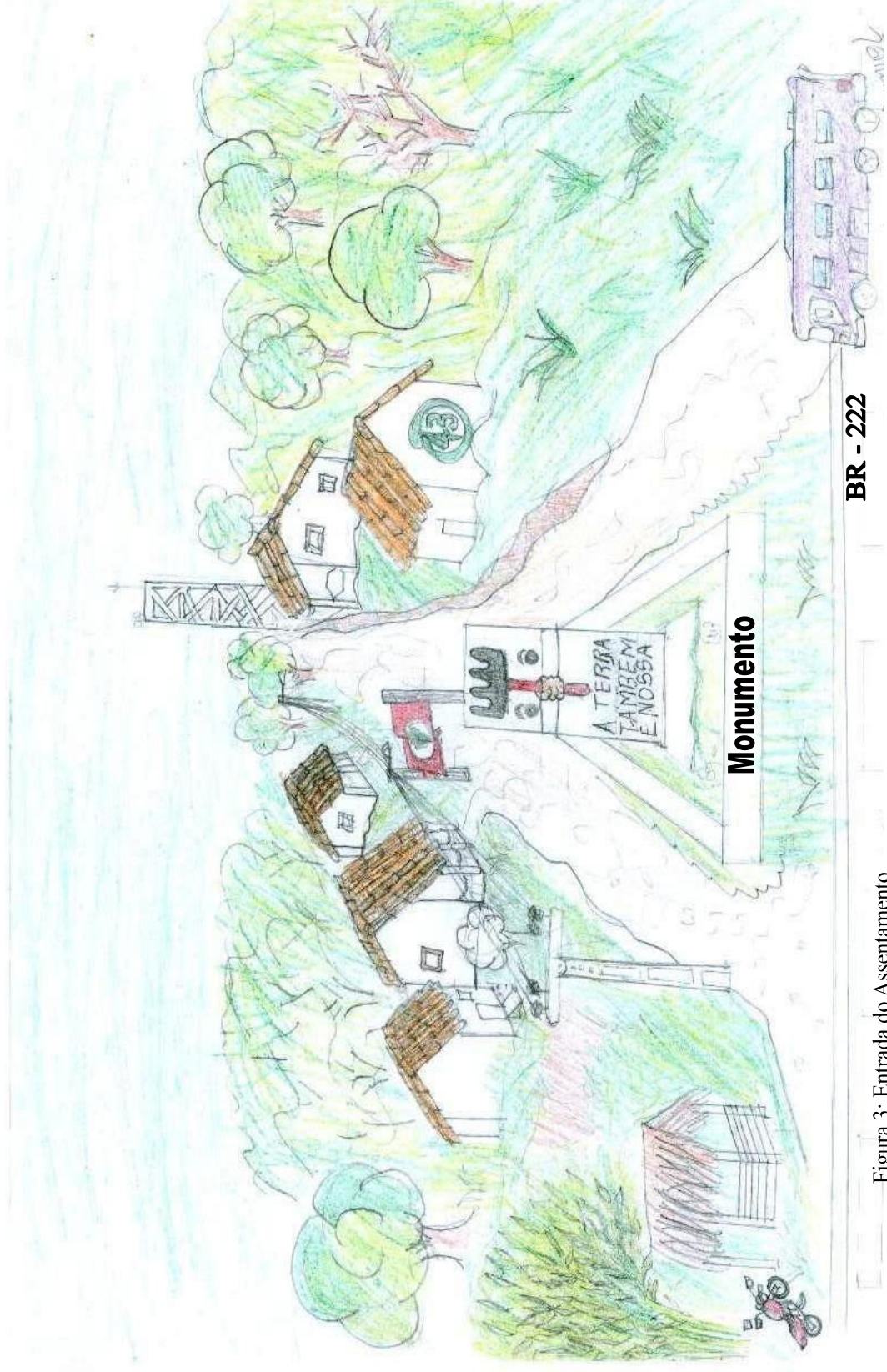
Figura 3: Entrada do Assentamento