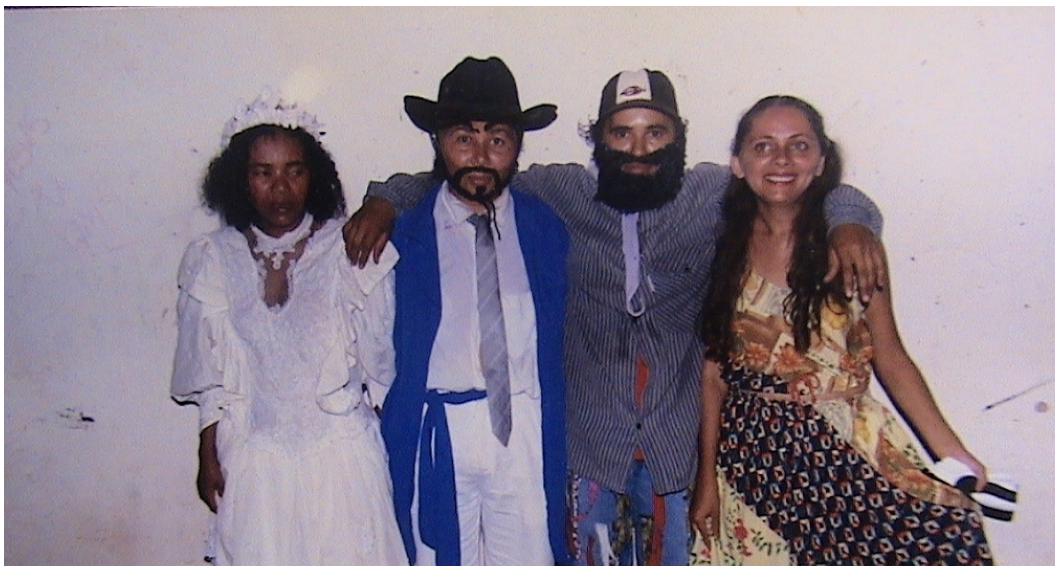
FIGURA 8 – Quadrilha no Assentamento.

O “lado de dentro da cerca”, conforme apresentamos traz consigo especificidades, riquezas culturais incontestáveis, bem como formas de resistências às opressões socialmente impostas. De uma fazenda com expressivas áreas de terra praticamente devolutas a um Projeto de Assentamento vivo, que trouxe paz, tranquilidade e esperança a um povo forte, que num momento de suas vidas acreditou no poder da reivindicação, da união, da coletividade e, sobretudo, da legitimidade da luta pela terra.