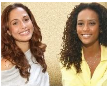
Imagem 3 – Taís Araújo e Camila Pitanga, as protagonistas das novelas "Viver a Vida" e "Cama de gato".

Para Camila Pitanga, que é protagonista pela primeira vez, estamos vivendo um outro momento, “Obama está aí e representa bastante isso, o primeiro presidente negro dos Estados Unidos. Não foi isso que fez com que fôssemos protagonistas, mas reflete uma conjuntura comum, pois vivemos no mesmo tempo” (CHAVES, 2009).