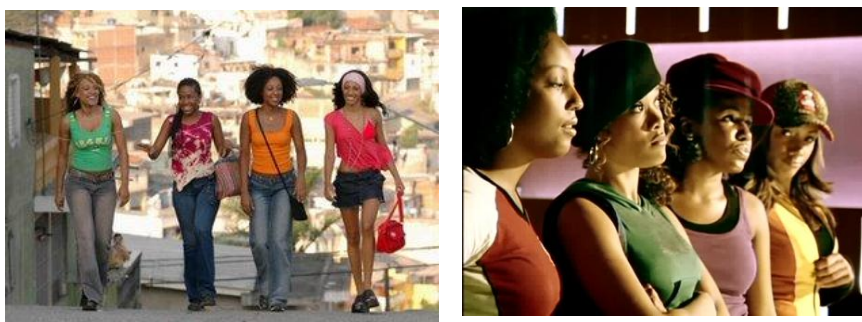
Imagem 27 – As Antônias.

O cabelo, nessa perspectiva, foi um importante veículo de comunicação por destacar na mulher e por ser um dos elementos constituintes da identidade da negra, pela cor e pela textura, e pode ser uma marca social.