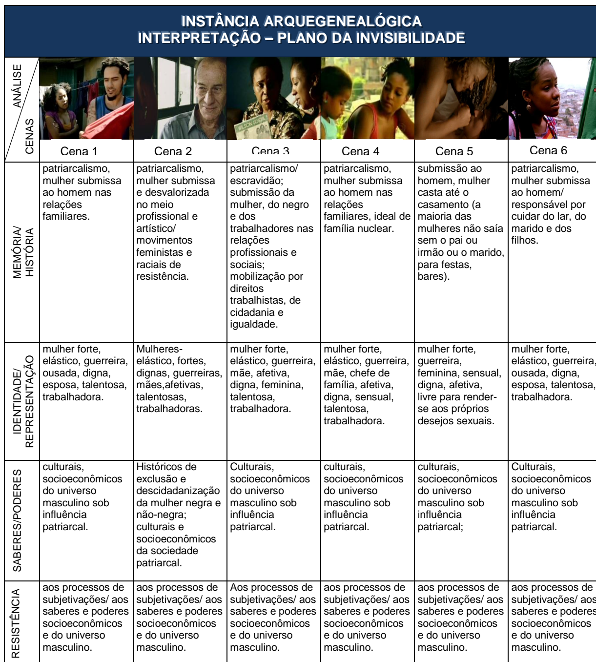
Quadro 2 – Quadro analítico