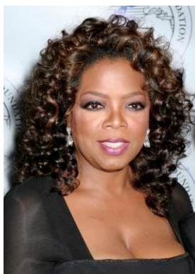
Imagem 1 – Oprah Winfrey.

perante o mundo, tal como nos Estados Unidos, onde os negros, em vez de permitirem ser influenciados ou controlados pelos brancos, criaram uma imagem própria e autêntica, buscando sua identidade histórica. O resultado de tudo isso pode ser conferido em figuras ícones, como Oprah Winfrey (56). Ela apresenta o talk show de maior audiência da história da televisão norte-americana, “The Oprah Winfrey Show”, no ar há mais de 10 anos. Venceu vários Emmys pelo seu programa, é atriz, indicada a um Oscar pelo filme “A Cor Púrpura”, editora da revista “The Oprah Magazine”, e também uma influente crítica de livros. De acordo com a revista “Forbes”, Oprah foi eleita a mulher negra mais rica no mundo do entretenimento do século XX, a negra mais filantrópica de todos os tempos, a única pessoa negra bilionária por três anos seguidos, uma das mulheres mais influentes e ricas do mundo 18 , estando em 2007 e 2008 em primeiro lugar nessa lista.