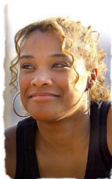
Imagem 10 – Personagem Barbarah.

A série Antônia , conforme Matos (2006) 45 , teve todos os seus episódios filmados em película e apresentou um elemento inédito na televisão brasileira: o enfoque em mulheres negras e pobres, moradoras de uma favela paulistana. Embora a mulher, muitas vezes, tenha papel destacado na produção ficcional da televisão brasileira, historicamente a televisão não mostra representações relevantes de mulheres negras. Tanto ela quanto o homem negro sempre ocuparam papéis subalternos e, frequentemente, estereotipados. Além disso, considerando-se que o país tem grande população formada por afrodescendentes, a minoria absoluta de personagens negros na produção televisiva brasileira entra em contraste com a população que compõe o país.