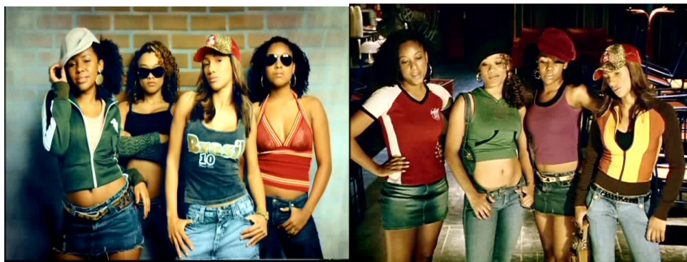
Imagem 14 - Grupo Antônia.

As marcas verbais dessa resistência estão em algumas estrofes, como fica evidenciado no verso “Sei que sou capaz de lutar”; entretanto, na letra da música essas marcas dialogam com a menção de que essa luta ocorre com honestidade, paz e dignidade. Em resposta ao saber sobre a negra e a mulata, que, como mencionado, muitas vezes eram objetos de fornicção dos senhores brancos, as