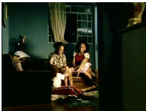
Imagem 19 – Cena 3: Sonho que ultrapassa gerações.