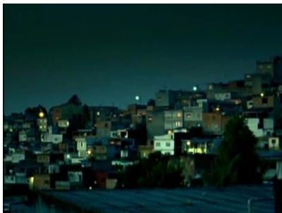
Imagem 4 – Periferia – Vila Brasilândia.

lugares mais privilegiados estruturalmente, a mídia explora esse lugar de exclusão social para que os moradores desses lugares marginalizados possam se ver representados.