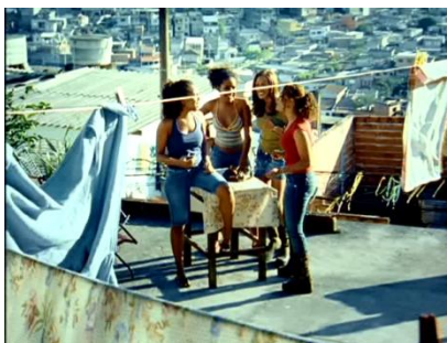
Imagem 5 – As Antônias na periferia.

Segundo o IBGE (Instituto Brasileiro de Geografia e Estatística), uma área é considerada favela (aglomerado subnormal de barracos ou cortiços) quando apresenta algumas características, tais como: ter no mínimo 51 casas e a maioria das unidades habitacionais da área não possuir título de propriedade ou documentação recente (obtida após 1980). Além disso, é necessário que o aglomerado tenha, pelo menos, uma das seguintes características: urbanização fora dos padrões (vias de circulação estreitas e de alinhamento irregular); construções não regularizadas por órgãos públicos; precariedade de serviços públicos (a maioria das casas não conta com redes oficiais de esgoto e de abastecimento de água nem é atendida por iluminação domiciliar).