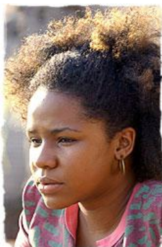
Imagem 8 – Personagem Lenah.