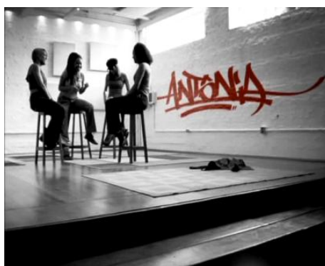
Imagem 11 – Vinheta de abertura Antônia .

A vinheta pode exercer várias funções, e é assim denominada em decorrência delas; por isso existem, entre outras, as vinhetas de identidade; de chamada; de passagem, e de abertura e encerramento, a qual nos interessa neste estudo. Segundo Aznar (1997, p. 44), “a vinheta tornou-se um apelo decorativo imagético e sonoro, que, além de identificar a emissora de forma característica, ainda tem a função de auxiliá-la a vender os seus produtos”. Utilizando elementos imagéticos, sonoros e mensagem de expressão verbal, a vinheta pode ser uma peça de curta metragem que aparece nos espaços interprogramas e em breaks , na abertura e no encerramento de produção e das seções, muitas vezes fazendo parte da própria produção dos programas. As imagens das vinhetas trazem consigo, quase sempre, um signo de identificação; no nosso objeto de estudo, o nome Antônia em vermelho, contrastando com o preto e branco da cena, conforme consta na imagem abaixo.