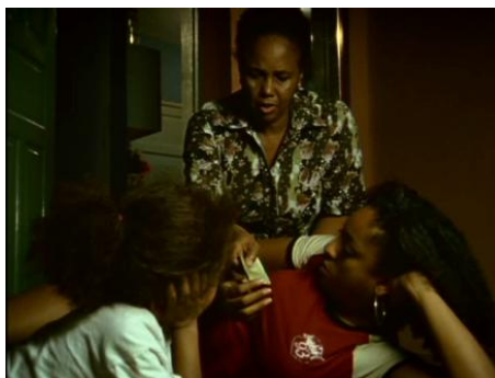
Imagem 21 – Cena 3: Disco das Antônias, um sonho possível.

A cena apresentada ilustra como o sujeito mulher era constituído no cenário artístico de décadas atrás, considerando-se que, ao longo dos séculos, o homem tinha institucionalmente autoridade sobre esposa, filhos e filhas no âmbito familiar, a qual se estendia a toda a organização social, de forma que as atividades exercidas pelo sexo feminino eram desvalorizadas.