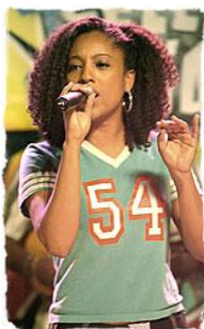
Imagem 7 – Personagem Preta.