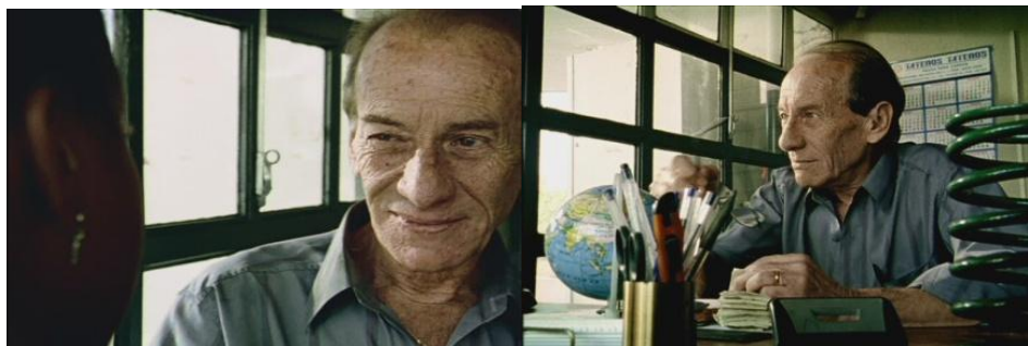
Imagem 18 – Cena 2: Preta e seu chefe.

Na cena selecionada, manifestam-se relações que se encontram além da oposição homem versus mulher. Como ocorreu na cena anterior, os enunciados são produzidos entre uma mulher que é hierarquicamente subordinada e um homem, aqui no seu trabalho.