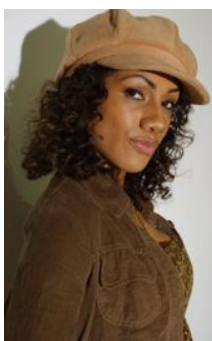
Imagem 9 – Personagem Maiah.