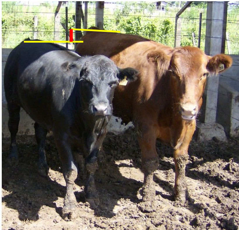
Figura 2 – Vista frontal da diferença na altura do quadril dos bovinos da raça Aberdeen Angus, traço horizontal em destaque vermelho.