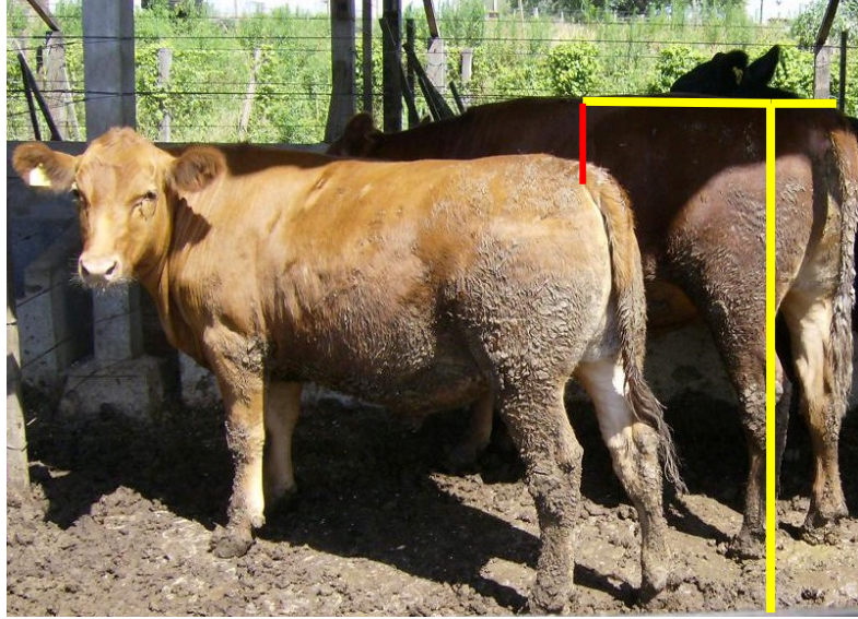
Figura 1 – Vista lateral da diferença na altura do quadril dos bovinos da raça Aberdeen Angus, traço vertical em destaque vermelho.