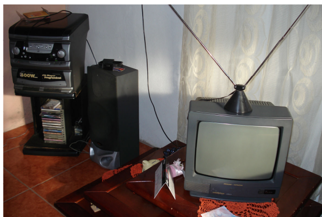
Figura 19 – Televisão e aparelho de som de Emanuele