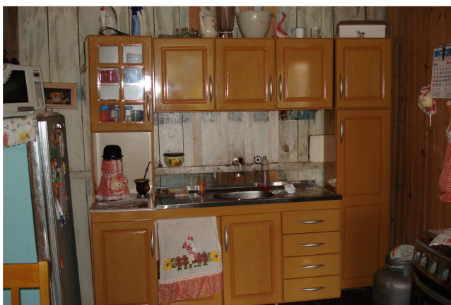
Figura 12 – Cozinha de Paola

Seus canais de TV preferidos são Globo, SBT e Record, e os programas de que mais gosta são Domingo Legal , Fantástico e novelas. Seu ídolo da TV é o cantor Amado Batista, pois cresceu ouvindo suas músicas por causa da mãe. Ouve rádio de duas a três vezes por semana, preferencialmente Medianeira FM, e seus estilos musicais favoritos são tchê music e forró. Lê livros raramente, e não chega a ler uma obra completa por ano. Lê jornal raramente, normalmente A Razão. Nuca lê revistas e nunca foi ao cinema. Usa a internet em casa todos os dias, por menos de uma hora, para fazer pesquisas para trabalhos de aula, buscar notícias, informações sobre a vida de celebridade, conferir o Orkut e conversar no MSN.