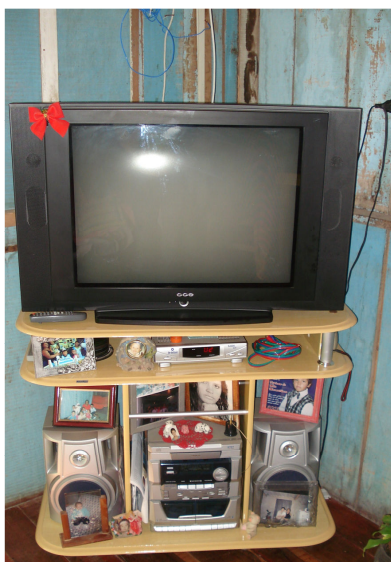
Figura 23 – Televisão e aparelho de som de Paola