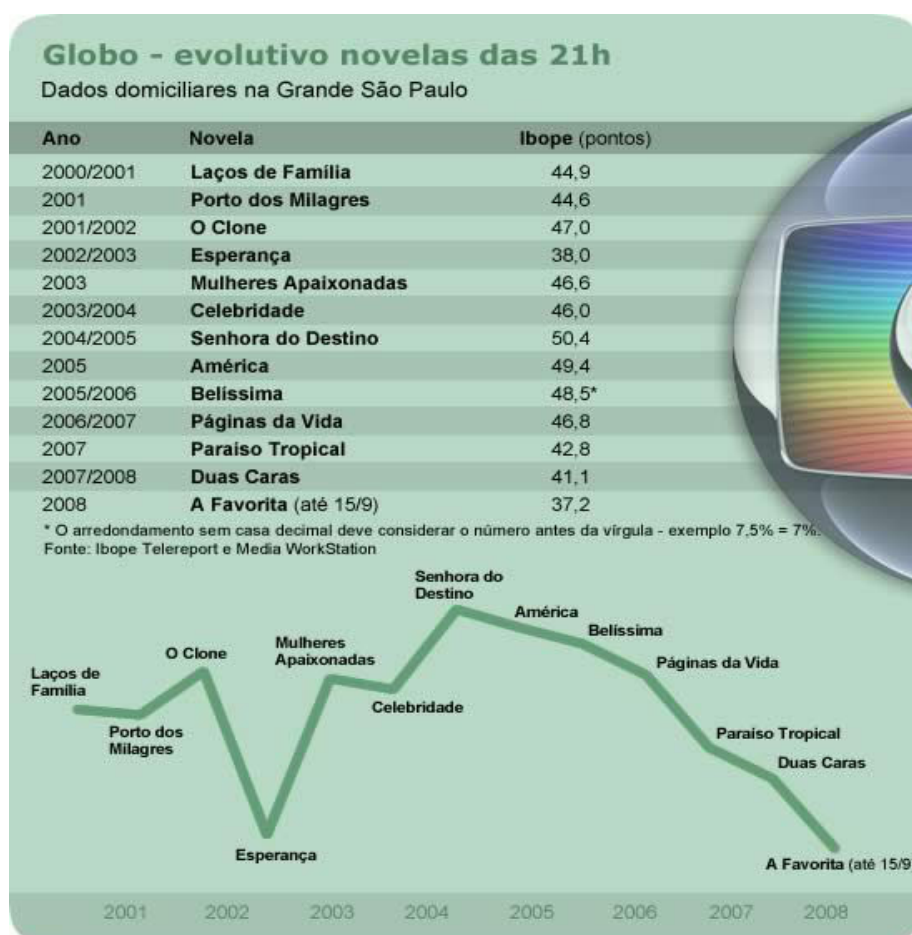
Figura 2 – Evolutivo da audiência da telenovela das 21h na década de 2000