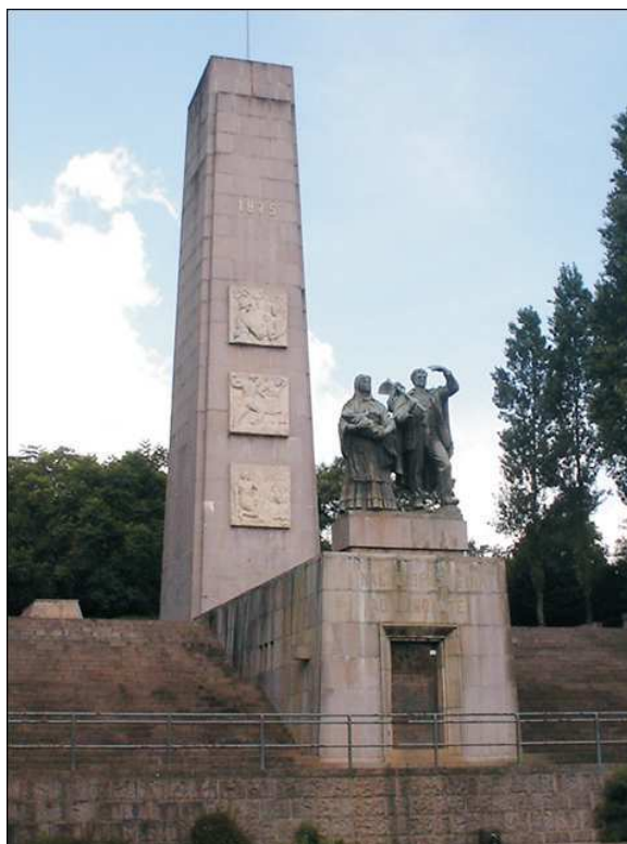
Figura 10 – Monumento ao Imigrante, 2002.

verbas pelo próprio Ministério para o restauro, a instalação de Museu e a urbanização das áreas próximas com o assessoramento de técnicos do IPHAN. 160