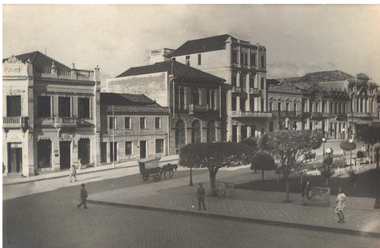
Figura 1 - Entroncamento Av. Julio de Castilhos e Rua Dr. Montaury, 1947.

Parece que a utopia do país da cocanha, situação oposta ao que viviam os imigrantes italianos no último quartel do século XIX, manteve-se como resultado da projeção dos desejos das gerações vindouras, que a partir do espaço construído buscaram consolidar a efetivação daquelas aspirações. Entretanto, a visão de mundo dos grupos que a constituíram nunca foi homogênea, tampouco os discursos sobre a preservação da herança edificada que, cem anos após o processo imigratório, revelam diferentes formas de arquitetar uma cidade moderna.