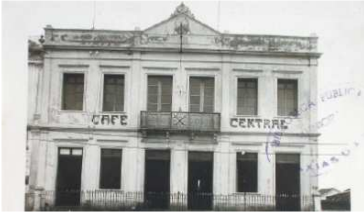
Figura 4 - De Intendência e Café Central, 1908...