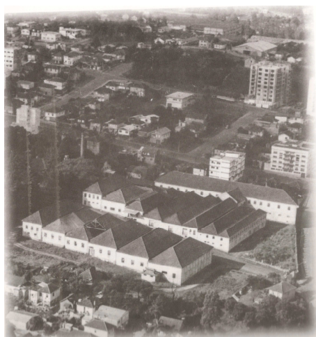
Figura16 – Complexo antes da destruição, 1985.

Tendo em vista a velocidade com que se processam as transgressões, sem que se tenha conseguido até o presente momento apurar as responsabilidades, decidi o grupo de professores convidados e de estudantes tomar duas decisões: Encaminhar à Promotoria de justiça providências para a abertura de inquérito civil com o objetivo de apurar as responsabilidades da União e/ou Município [...]; Elaborar a presente perícia técnica informando oficialmente a Prefeitura Municipal de Caxias do Sul, a Receita Federal, a Universidade de Caxias do Sul, a Universidade do Vale do Rio dos Sinos e a comunidade caxiense, dos danos de que estão sendo passíveis as edificações componentes da Cantina Antunes. 193