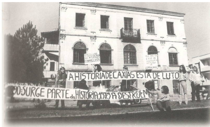
Figura 12 – Antigo Hospital Carbone, 1979. Manifestação.

preservação do passado se tenha tornado em nosso tempo, uma necessidade vital, quase sinônimo de sobrevivência. 179