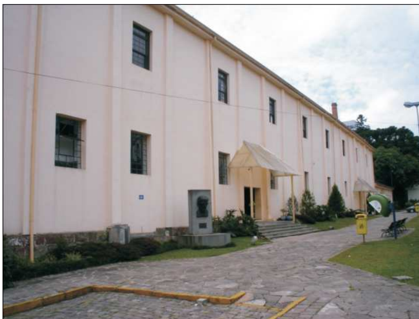
Figura 19 - Centro de Cultura Dr. Henrique Ordovás Filho, 2002.

Dos seis prédios que restaram e para reorganizar e dar andamento ao projeto, entre 1997 e 1999, foi retomado o investimento pelo poder executivo municipal a partir de seu orçamento juntamente com a Lei de Incentivo à Cultura que teve participação de empresas da cidade. 198 Ainda assim, a execução das obras retorna em ritmo lento e apenas em 1997, o projeto do complexo foi retomado pela nova administração municipal. 199 Parte do terreno já havia sido ocupada por uma empresa particular que o desocupou mediante uma ação de reintegração de posse, já que as tratativas convencionais não tiveram o resultado esperado.