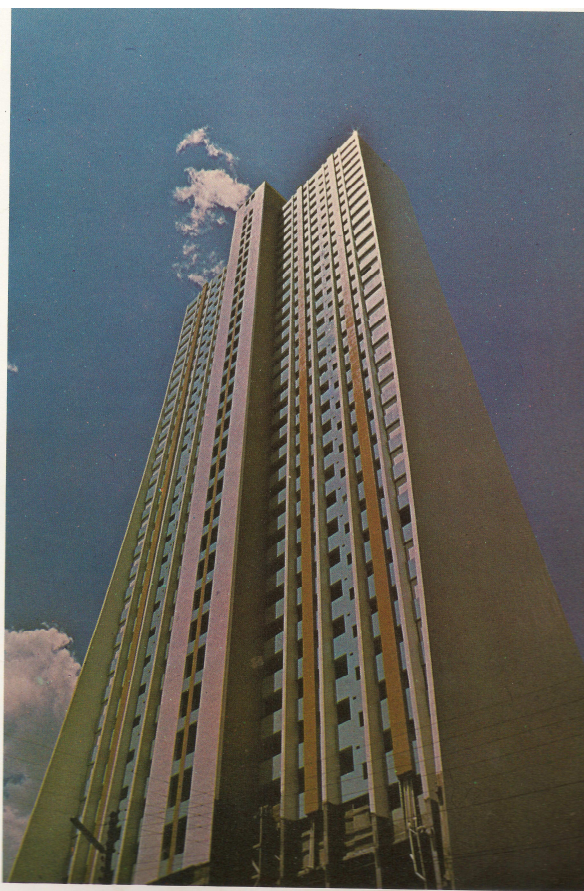
Figura 6 - Reprodução de um dos edifícios mais altos do Estado: Parque do Sol (construído em 1972) no Álbum do Centenário da Imigração, 1975. A imagem dá conta do modelo de cidade pensada pelos poderes.

Esse período marca a transição para o momento da verticalização da cidade compreendendo que o desenvolvimento econômico deveria se transferir para a malha urbana e suas edificações. Ainda na primeira metade do século XX, somando-se na função original de escritório ou habitação, o edifício alto é o elemento dominador na forma urbana contemporânea e torna-se elemento de identificação com o progresso. Em virtude de sua universalidade, o edifício alto é tratado como imposição sobre as edificações vizinhas, já que se trata de uma idealização da sociedade mecanicista. Símbolo de certo progresso era almejado por todas as cidades, desde o século XIX, visto que significava o passaporte para integrar o rol das cidades desenvolvidas. Representando poder os edifícios altos e os automóveis foram os grandes personagens da configuração da cidade contemporânea.