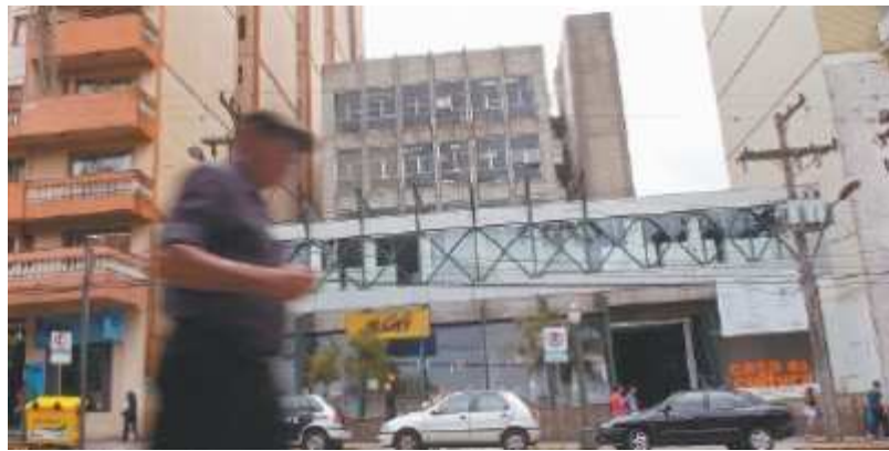
Figura 5 - ... à Mc Café, 2009.

Assim, Caxias do Sul tinha sua imagem constantemente modificada, e esse fato simulava a uma parcela da população afirmação de status . Portanto, a memória sobre as edificações não era alvo de política preservacionista, pois, por um lado, o controle do Estado se dava apenas sobre as cidades que continham reminiscências do passado colonial português ou outros que, de alguma maneira tinham relação com o projeto de identidade brasileira. Por outro lado, a crescente modificação dos prédios que compunham a cidade era visto como contemporâneo aos seus habitantes que ambicionavam modernizar seu espaço, sem levar em conta as condições de salubridade. Isso não explica por completo, mas relaciona-se com o esquecimento dos vestígios da Região Nordeste do Estado do Rio Grande do Sul até a década de 70.