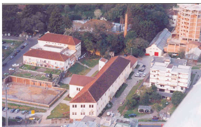
Figura 18 - O que foi possível preservar tornou-se um Centro de Cultura, 2000.

Assim, iniciaram-se as intervenções no restante do patrimônio edificado, ficando a área onde não havia mais edificações para a construção da sede do Fórum Jurídico Municipal. Uma das dúvidas foi sobre o destino do material das ruínas do complexo, já que “não competia” ao executivo municipal intrometer-se na questão. A resposta foi encontrada em documento interno informando que o destino havia sido incorporado ao estoque do banco de material. 196 Em 1991, quando a área foi liberada o GAMAPLAN foi informado que: “Centenas de famílias foram beneficiadas com o material de lá retirado”. 197