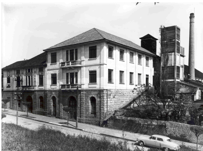
Figura 14 - Cantina Mosele, demolida na década de 1980.

Houve uma tentativa não concretizada de fusão entre as empresas Luiz Michelin Agricultura, Indústria e Comércio (Cantina Antunes) e E. Mosele (Cantina Mosele), sem sucesso, o que ocasionou o encerramento de ambas. No caso da Cantina Antunes, em dezembro de 1984, as dívidas com a União aumentaram de forma que os maquinários, bens móveis, pipas foram retirados do local e leiloados. O espaço da Cantina foi cedido pela União à Prefeitura em 1988, enquanto o prédio da E. Mosele foi demolido para reutilização do espaço pela União.