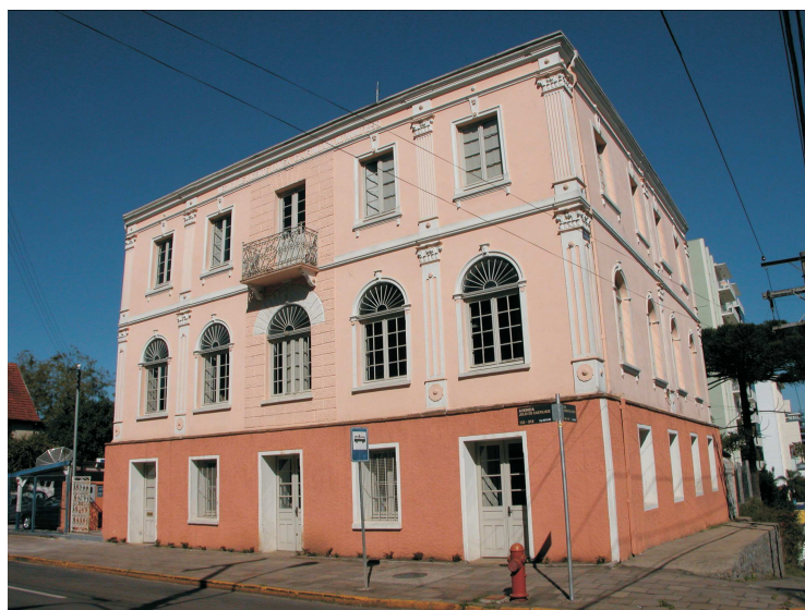
Figura 13 - Após 20 anos de debates, restaurado e transformado em Arquivo Histórico Municipal.

Após a consolidação, o Museu Municipal e o Arquivo Histórico Municipal iniciaram outra etapa que seria transformar a edificação em um centro de documentação, já que milhares de documentos estavam arquivados em condições precárias no anexo do Museu da cidade. Mesmo legalmente existindo 185 , o arquivo histórico não dispunha de local oficial para o acondicionamento adequado de todo o material ainda existente.