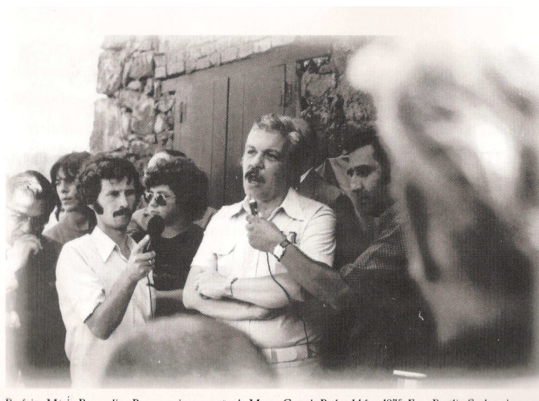
Figura 8 - Casa de Pedra, 1975. Inauguração.

Diferentemente, a memória criada pelo poder público estabeleceu naquela edificação um teor ideológico, que recorrendo ao discurso da distinção laudatória, além de inferir que a urbanização salvou a casa, quando na realidade, se não fosse a própria urbanização a cidade ainda teria outros tipos de edificações a ser preservadas. Contudo, é relevante indicar que se tratou de uma preservação e revitalização, resguardada o período, realizado, pelo poder público mesmo sem existir uma legislação própria para tal, com intenções bem definidas, o que indica que o poder político sempre teve grande influência na produção de símbolos que garantem a unidade pacífica de sua população. De certa forma, isso inicia os debates, pois mais tarde mesmo com legislação garantida, o processo preservacionista não foi tão simples.