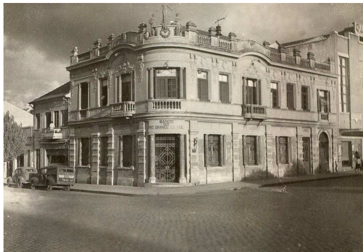
Figura 3- Banco do Estado do Rio Grande do Sul, 1947.

De maneira geral, o processo de urbanização de Caxias do Sul estava associado aos ciclos econômicos que marcaram sua evolução desde a fase inicial de ocupação de terras, marcada por atividades primárias, até a fase industrial e de prestação de serviços. Esta última assinalada pelo dinamismo em que a economia local se integrava às exigências do modelo desenvolvimentista brasileiro do governo Juscelino Kubitschek, balizadas pela promoção de um crescimento da economia e na industrialização. 116 No Brasil havia um esforço de internacionalização da economia representado pelo modelo econômico associativo dependente, o que estimulou a acumulação de capital e a expansão industrial, beneficiando diretamente a economia regional.