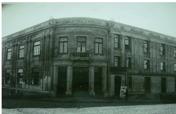
Figura 21- Após sua construção, década de 1930.

Quando João Spadari Adami resolve escrever em sua obra sobre a história da cidade de Caxias do Sul, datada da década de 60, a construção simbólica sobre o Apollo/Ópera já aparece em registros como complemento da “evolução” urbana. 206