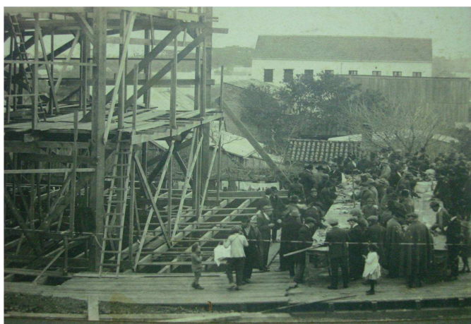
Figura 20- Construção do Teatro, aproximadamente 1927.

Nesse período, assim como em outras localidades, havia a necessidade de espaço de encontro, para o comércio e das relações de capital, local para a devoção religiosa e da distração.