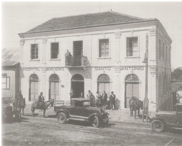
Figura 11 – Casa Comercial deu lugar ao Hospital Beneficente Santo Antônio, 1931.

Defesa do Acervo Cultural Gaúcho e da Coordenaria do Patrimônio Histórico e Artístico do Estado – CPHAE. 174