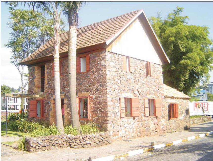
Figura 9 - Casa de Pedra, 2002.

Mesmo com o fim das comemorações do Centenário da Imigração Italiana, a ideia de produção de uma imagem que se vinculava ao mito se mantinha. A partir do caso da reforma do Monumento do Imigrante 156 em 1984, pode-se observar a clivagem do que se considerava patrimônio e os caminhos para preservá-los. Em uma sessão na Câmara de