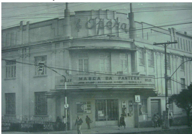
Figura 22 - Transformado em cinema e abandonado pelo poder público, década de 1980.

Apesar de a cidade de Caxias do Sul, no final da década de 1980, contar com importante legislação sobre a preservação do patrimônio histórico edificado, bem como um Conselho Municipal de Patrimônio Histórico que tratava dessas questões, e diversos convênios com o IPHAN, o processo de preservação nem sempre obteve sucesso em seus propósitos. Um caso emblemático a ser referido foi o caso do Teatro Apollo que mais tarde passou a se chamar Cine-Teatro Ópera.