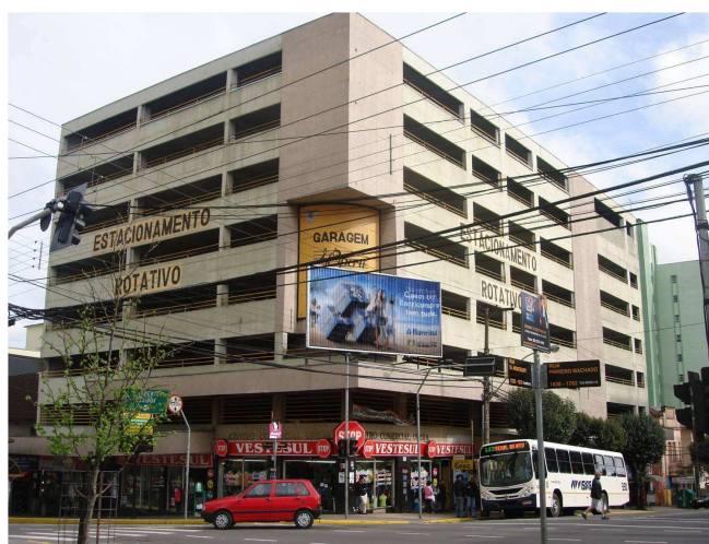
Figura 24 – A Garagem Ópera, 2007.

A discordância do valor solicitado pela proprietária do imóvel e o poder executivo municipal que não tinha interesse em adquirir o prédio levou a proprietária, no dia 1º de abril de 1993, a determinar o desmonte de toda a parte interior do Teatro, o que descaracterizou a edificação e implicou problemas para manter sua estrutura. O laudo da Universidade de Caxias do Sul, solicitado pela Prefeitura Municipal apontava a proprietária como responsável pela perda da estrutura e afirmava que a situação era irreversível.