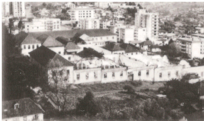
Figura 17 - A metade do complexo comprometida pelo descaso, 1988.

pelo COMPAHC. Os projetos não foram encontrados, transparecendo a real intenção do poder público com a edificação e dos 18.900m 2 repassados, 16.000m 2 foram destinados à construção do Fórum da Comarca a cargo do Governo do Estado, mesmo permanecendo parte da edificação naquele local.