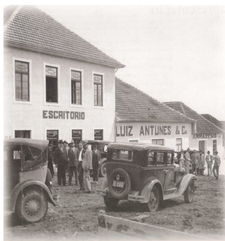
Figura15 - Cantina Antunes, aprox. 1935.

Aconteceu outra mobilização iniciada pela sociedade civil organizada que resultou na Lei nº 2.927 de 07 de novembro de 1984 que determinava que a localização onde