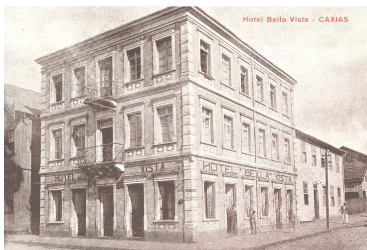
Figura 2 – Hotel Bela Vista, década de 1940.

Houve diversas fases da trajetória da economia do município. A primeira caracterizou-se por um regime de subsistência e de manutenção familiar; a segunda abastecia o mercado regional e nacional; já na terceira houve a integração dos anteriores resultando na construção de uma indústria de perfil tradicional, que possibilitava o acúmulo de capital entre os comerciantes 115 . Decorrente deste, houve a ampliação da zona colonial, o fortalecimento de um sistema financeiro local, a criação de associações e o embelezamento sobre a rede urbana e suas edificações.