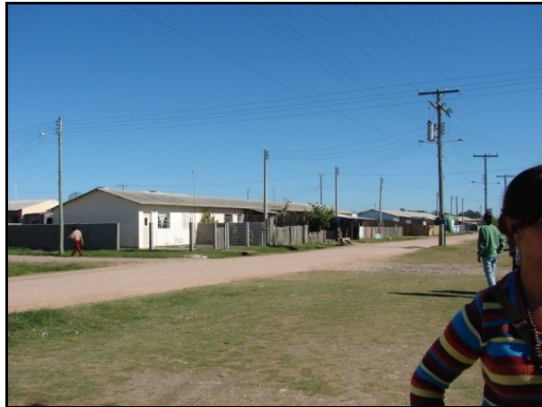
Figura 7: Saída de Campo ao Bairro Cidade de Águeda