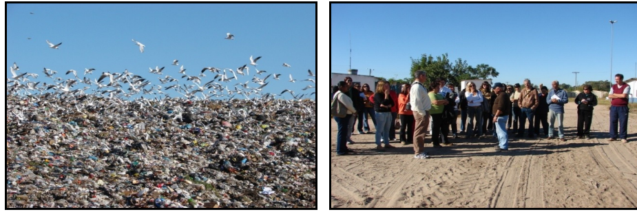
Figura 9: Saída de Campo ao Lixão Municipal.