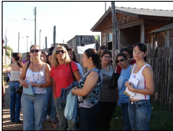
Figura 6: Saída de Campo ao Bairro Getulio Vargas