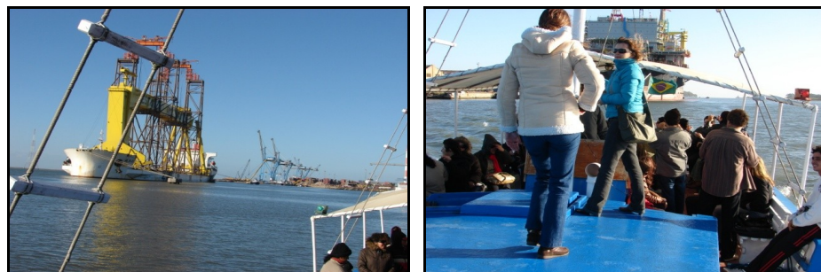
Figura 12: Saída de Campo ao Estuário da Lagoa dos Patos.