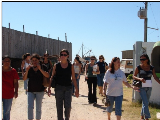
Figura 8: Saída de Campo ao Bairro Barra Nova

Todo este contexto configura-se como um espaço de formação desenvolvido na linha de ação em foco, além de proporcionar aos professores uma maior inserção no contexto de atividades de cunho socioambiental, como por exemplo, a participação na III Conferência Infanto-Juvenil pelo Meio Ambiente.