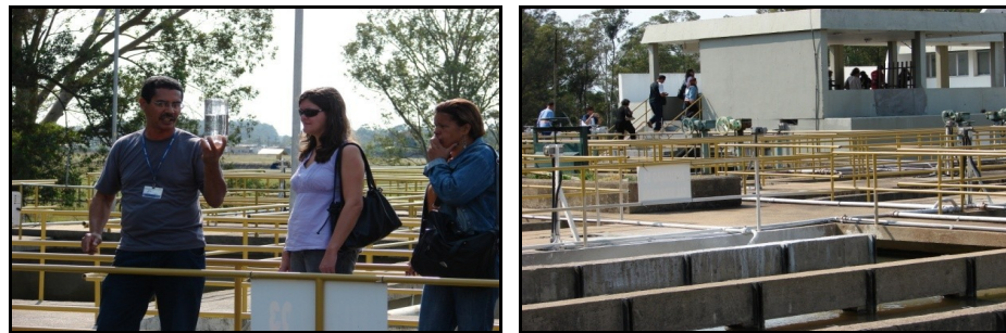
Figura 11: Saída de Campo Estação de Tratamento de Água do Rio Grande.