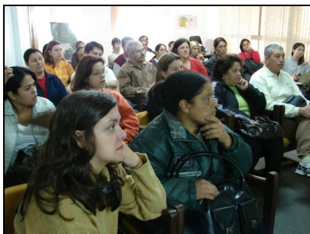
Figura 1: Aula teórica, ministrada no Armazém 5 do Porto Velho

A primeira etapa do trabalho é desenvolvida entre aulas teóricas e saídas de campo.