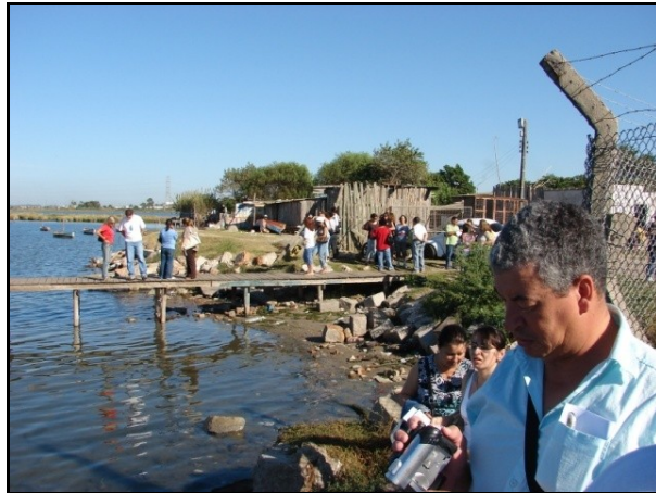
Figura 5: Saída de Campo a Vila Santa Teresa