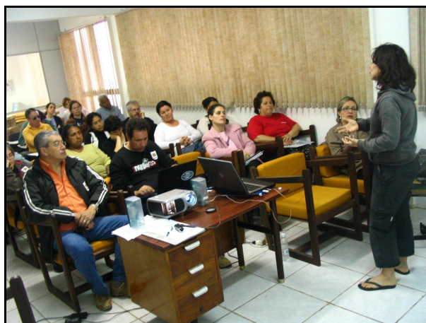
Figura 2: Aula teórica, ministrada no Armazém 5 do Porto Velho

O trabalho de capacitação é ministrado pela equipe do ProEA-PRG e sua carga horária respeita as características de cada público, sendo que cada aula tem uma carga horária de 4 horas aula/dia, totalizando entre 20 horas/aula, 40 horas/aula ou 60 horas/aula. Como já mencionado anteriormente, o enfoque da formação gira em torno da relação entre atividade portuária, meio ambiente, cidade e a idéia relacional local/global.