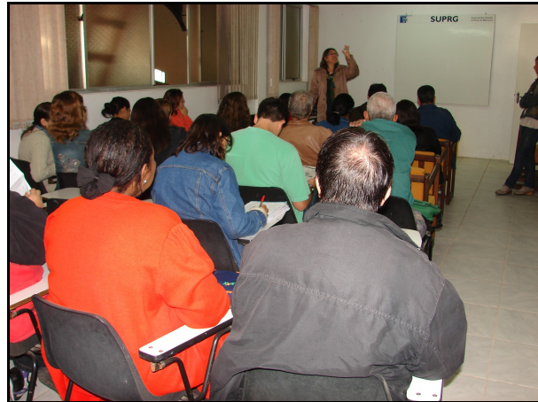
Figura 3: Aula teórica, ministrada no Armazém 5 do Porto Velho

Ainda segundo o Relatório de atividades desenvolvidas (2008), a união da teoria à prática é feita por meio das saídas de campo, na qual os participantes são convidados a formar grupos visando uma abordagem prática dos problemas (causas e efeitos) e soluções (meios e fins) do ambiente onde estão inseridos. Nessa saída, busca-se apresentar o Estuário da Lagoa dos Patos por via fluvial ou terrestre, visitas aos ecossistemas locais, a fim de apresentar os principais pontos de impactos causados pela ação humana, bem como aqueles que apresentam grandes potenciais do ponto de vista socioambiental.