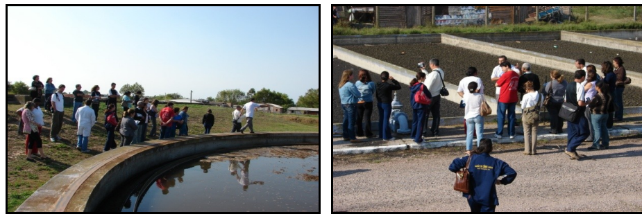
Figura 10: Saída de Campo Estação de Tratamento de Água do Parque Marinha