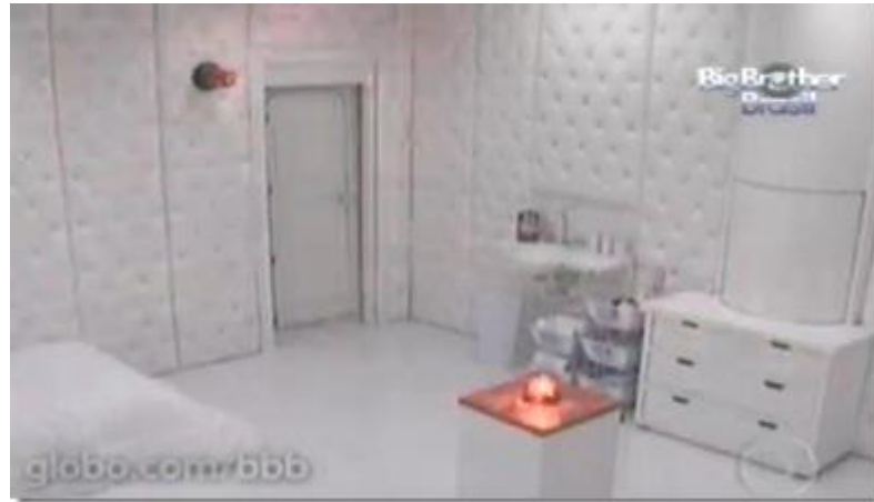
Foto 1 - Quarto Branco