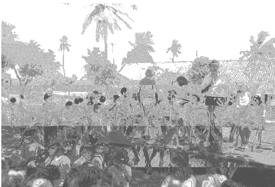
Figura 9. Foto do piquenique. Arquivo do O Povo, de 1985.

Novamente as pessoas se reuniram, em apoio aos ambientalistas, participaram das discussões e atividades artísticas, conforme fotografia.