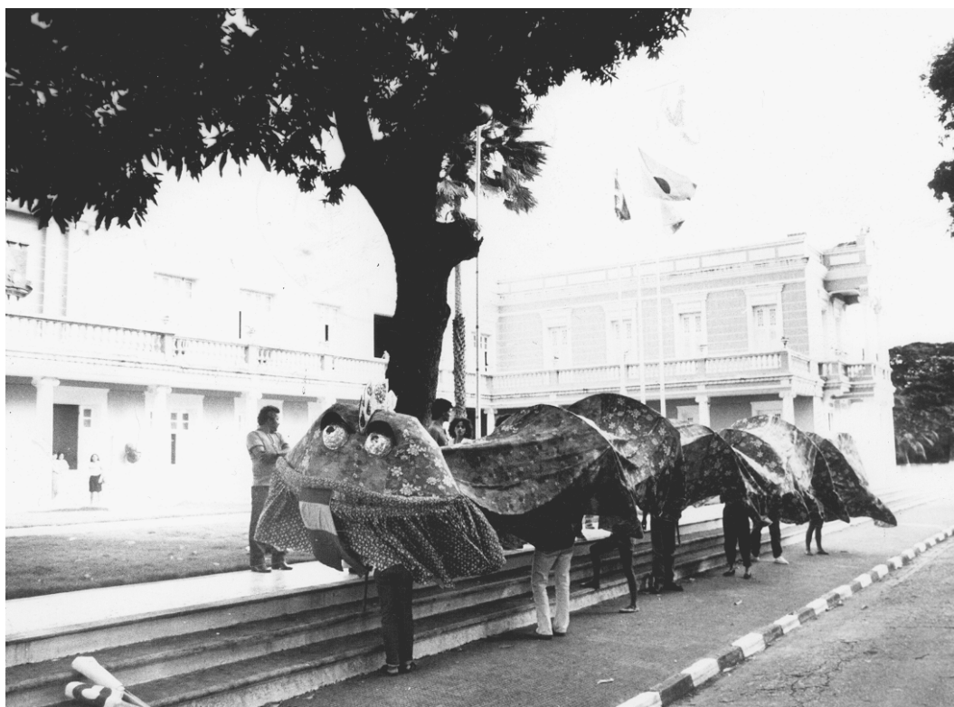
Figura 8. Foto da Cocobra.

O piquenique, em 1985, foi o segundo grande evento de luta pela defesa do Cocó, com a participação da população convocada pelos jornais, exposição de cartazes nas universidades e convites às comunidades ribeirinhas. Artistas plásticos criaram, para o evento, um boneco gigante, símbolo do movimento SOS Cocó, a Cocobra , para chamar a atenção das crianças e do público em geral. Os militantes visitaram bairros do entorno do Cocó, vestidos no boneco convidando a população para o piquenique.