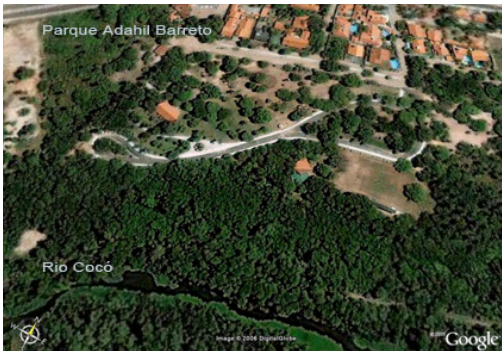
Figura 5. Parque Adahil Barreto. Fotografia do Google Earth.