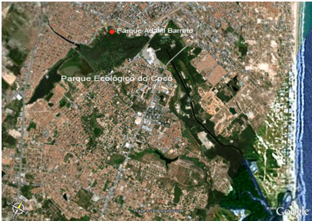
Figura 4. Rio Cocó em Fortaleza.