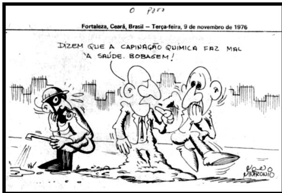
Figura 1. Charge sobre aplicação do herbicida. O Povo, dia 09.11.1976.

Esta charge apresenta uma senhora, dona de casa, de classe social popular, que, consultada a respeito da capinação química, demonstra preocupações com o destino do capim que se transforma em lixo, depois de aplicado o produto. A imagem traz a observação sobre a produção de resíduos, chama a atenção para o percentual do produto exposto ou absorvido pelo solo, podendo contaminar o lençol freático ou outras vias de contaminação. Ainda neste quadro pode-se observar a expressão de surpresa do pesquisador alerta que, provavelmente, não foi informado do processo de capinação.