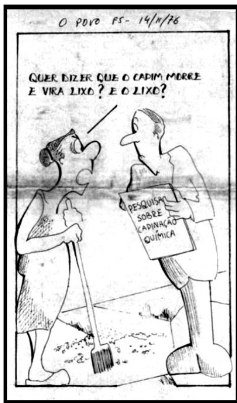
Figura 2. Charge sobre aplicação do herbicida. O Povo, dia 14.11.1976.

A suspensão da capinação química pela Prefeitura Municipal de Fortaleza foi a primeira vitória do grupo da SOCEMA. Todavia as ações e o debate contra o método de capinação química ficaram concentrados entre os técnicos e gestores, e não houve a participação mais efetiva da população dos bairros atingidos pela capinação química. O grupo da SOCEMA demonstrou ousadia ao opor-se à administração pública, ao levantar críticas e exigir mudanças em projetos lançados pelos órgãos governamentais, em período em que não havia espaço para intervenção na sociedade. Outro foco de críticas, no mesmo período, demonstrou a ousadia dos membros da SOCEMA, para sugerir mudanças em projeto do Governo do Estado, pela Companhia de Água e Esgoto do Ceará – CAGECE, que derrubaria os coqueiros da Avenida Beira Mar.