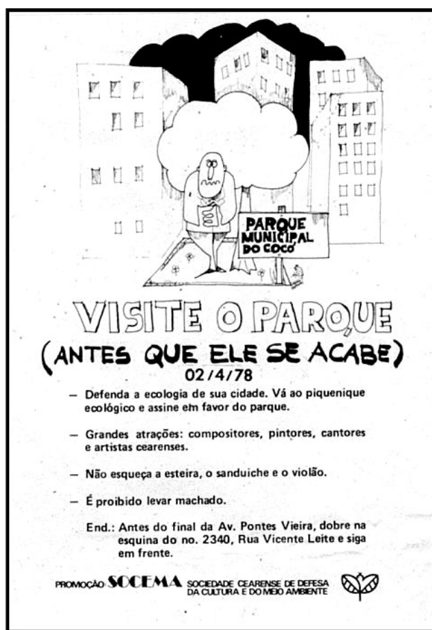
Fig.6. Panfleto de divulgação do piquenique realizado em 1978.

área retangular, com a imagem de pequeno tapete, que dá a idéia de limitação do parque municipal, caso a especulação imobiliária continuasse desordenada. Os desenhos para alertar sobre perigos futuros e os textos apresentavam convencimento e sensibilização para que as pessoas se engajassem na luta pela preservação do meio ambiente da cidade. No convite para participação no piquenique, a frase não esqueça a esteira, o sanduíche e o violão , demonstra a junção do dever de tomar uma atitude de cidadão e assinar em favor do parque, em defesa da ecologia de sua cidade . O convite à manifestação demonstra o formato artístico e lúdico do evento, servindo como estratégia para sensibilização, mas também de disfarce da ação política, que tinha o objetivo de criticar decisões tomadas pelo governo e pela iniciativa privada, e tentar mudar os rumos de projetos imobiliários e de obras públicas, que aumentavam o processo de degradação do ambiente urbano.