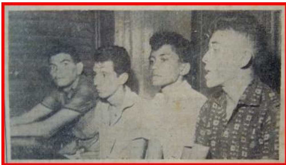
Foto dos rabos-de-burro da segunda geração.

Em ambas as fotos, os rabos-de-burro foram fotografados, na delegacia, depois do cometimento de delitos. Na primeira imagem, os rapazes são todos brancos, posam para a fotografia e se mostram descontraídos e leves à saída da delegacia. Na segunda, dos quatro rapazes um é mulato e todos aparentam ter sido, de certa forma, flagrados pela câmera e exibem uma expressão de preocupação e apreensão diante do delegado. É possível observar também a mudança de visual. Na primeira foto, todos usam bigodes, e já exibem topetes, no segundo, os topetes permanecem, mais nenhum deles usa bigode (James Dean, também não usava).