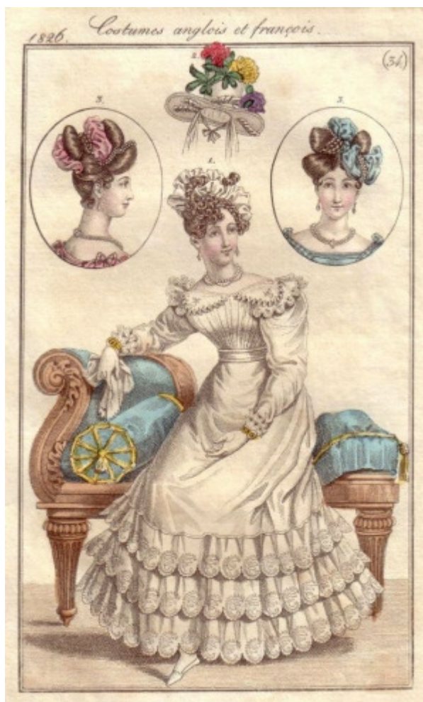
Fac-simile do Journal des Dames et des Modes em

conteúdo em “três linhas básicas: aperfeiçoar o gosto, apresentar temas de interesse público e defender certas causas, às vezes triviais, às vezes idealistas.” 24