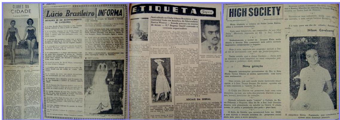
Exemplos de algumas colunas sociais dos jornais de Fortaleza.