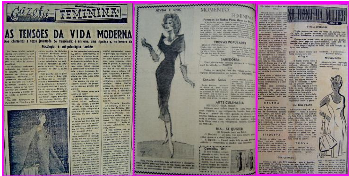
Gazeta Feminina Gazeta de Notícias /58

prioritariamente por mexericos do high society e de Hollywood, receitas de bolos e de máscaras para esticar a pele, moda e outros temas afins. Assuntos semelhantes aos tratados, nas páginas femininas de O Cruzeiro , identificados ou situados a partir de termos como feminino/ feminina, para mulher e para ela , grafados suavemente, com letras inclinadas e curvilíneas. Nota-se, pois, intenção nítida de individualizar um espaço feminino do conteúdo restante.