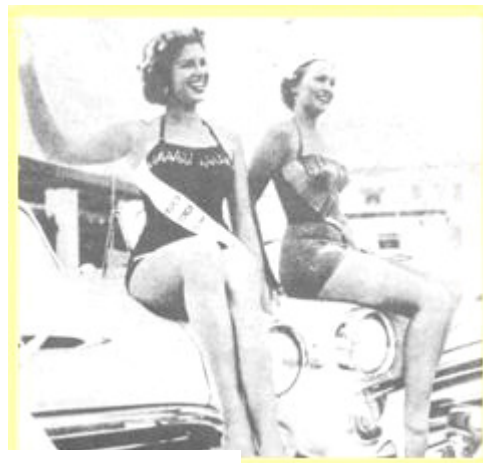
Martha Rocha e Miriam Stevensor,