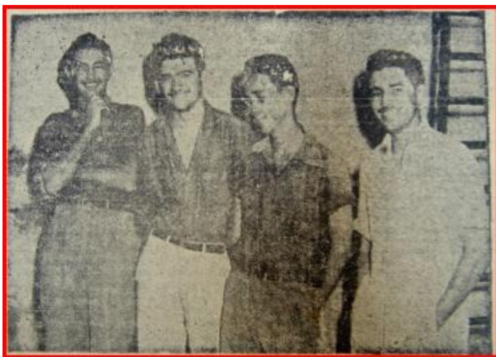
Foto dos rabos-de-burro da primeira geração. 417

É possível dizer-se, que já não eram mais os filhos das grandes famílias do Estado. Um indicativo dessa afirmação é de que esses jovens não tinham mais o nome divulgado, e passaram a ser retratados pelos jornais. Na primeira geração, isso só ocorreu duas vezes, e fazendo uma análise das duas fotos, é possível visualizar algumas diferenças que caracterizaram os dois momentos. 416