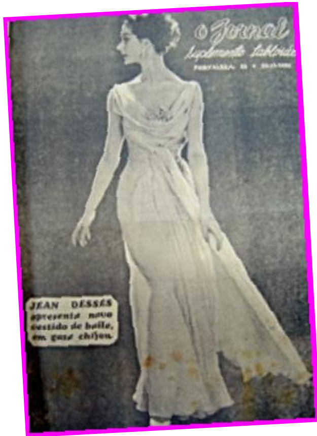
Frontispício da O Jornal Tablóide /59