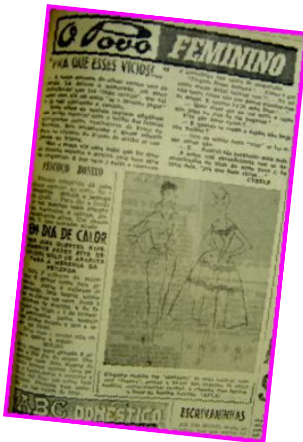
Frontispício de O Povo Feminino / 59

Apesar das divergências ideológicas e partidárias dos jornais O Povo , Gazeta de Notícias , O Jornal e o Correio do Ceará , as páginas femininas têm similitudes no padrão estético e no próprio conteúdo, inclusive com a revista O Cruzeiro (que diante da dificuldade de acesso a jornais de outros estados, serve de parâmetro para comparar o local com o nacional). Nota-se a repetição de alguns textos ou de textos assinados pela mesma pessoa, em diferentes colunas. É o caso, por exemplo, das consultas e conselhos de etiqueta da norte-americana Amy Vanderbilt 41 , cujos escritos faziam-se presentes em O Correio do Ceará , e em O Jornal , com menor regularidade.