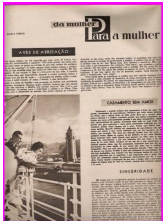
Da mulher para a mulher Frontispício da página feminina de O

Se quem produz a coluna Da mulher para a mulher , no O Cruzeiro , é uma mulher sofisticada e rica, semelhante à americana Amy Vanderbilt, acredita-se que eram mulheres (ou homens que assumiam um papel de mulher) de perfis semelhantes que escreviam os textos de outras colunas publicadas nos jornais locais. O Povo Feminino , mesmo tendo, por algum tempo, textos assinados por Cybele, tinha o restante do material provavelmente originado de cópias ou recortes de outras revistas. Fato semelhante se observa com a Gazeta Feminina , uma combinação de noticiário local, como a cobertura de festas e concursos de beleza, e material mais didático de moda, beleza, culinária. Já o Momento Feminino (de O Globo ), que substituiu A Gazeta Feminina , era uma coluna de noticiário totalmente externo, curta e padronizada, com itens fixos de moda, beleza, etiqueta e comportamento.