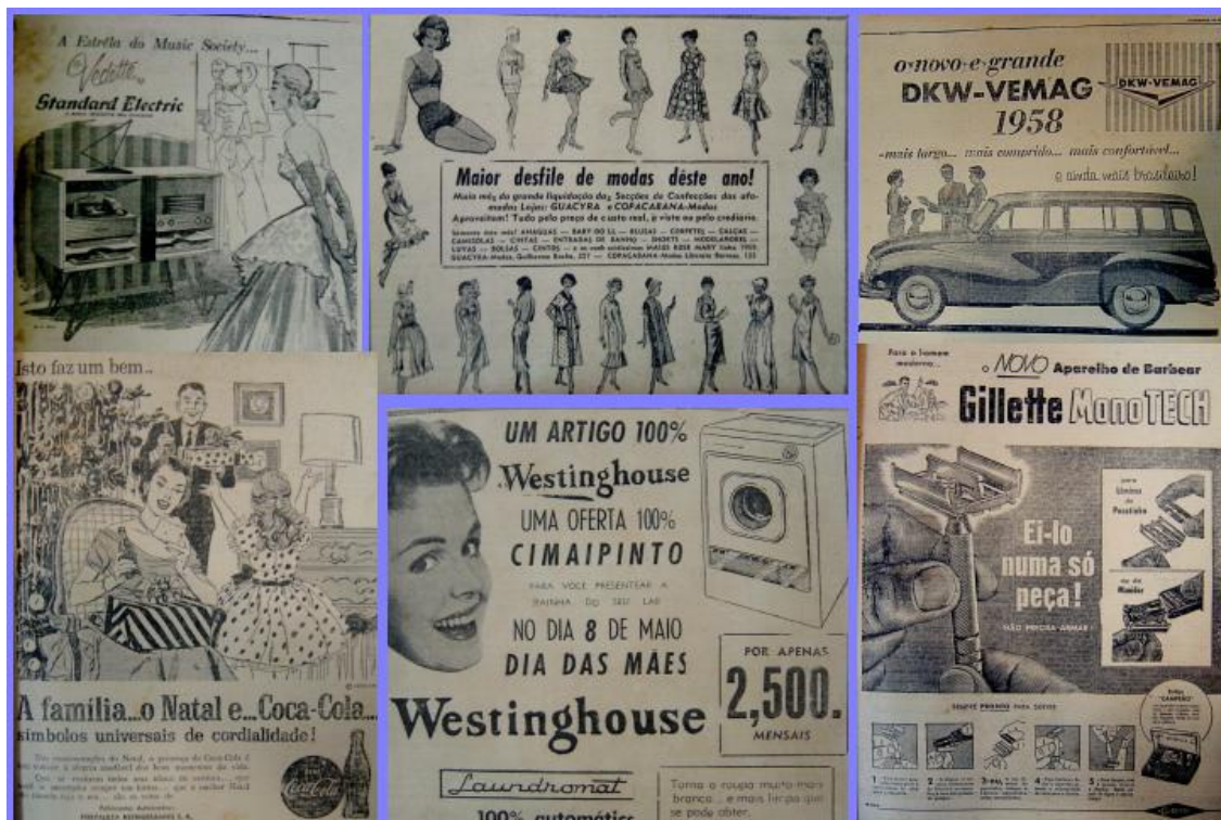
Anúncios Publicitários retirados dos jornais de Fortaleza nos anos 50.

Para a pesquisadora Ana Cristina Camargo Moraes Figueiredo, o aumento significativo de peças publicitárias, nos órgãos de imprensa brasileiros, na década de 50, se explica pela expansão da classe média, no período, formada por profissionais liberais, funcionários públicos, empresários e comerciantes ávidos por conforto, praticidade. A nova classe média detinha o meio primordial para conquista: dinheiro. 91