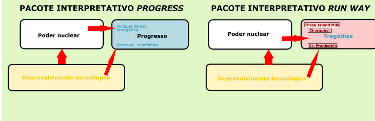
Figura 1: Exemplo de pacotes interpretativos (Gamson & Modigliani, 1989)

Para os propósitos dessa pesquisa, a identificação desse eixo comum permite evidenciar que, entre o âmbito dos media e o âmbito interacional do Greenpeace na internet, há um intercruzamento entre ambos, de modo, então, a permitir que a audiência possa se valer de insumos complementares para interpretar o tema da exploração da floresta amazônica. Nossa expectativa é que a complementaridade entre esses âmbitos se demonstre a partir da idéia de que, enquanto o âmbito dos media venham a fornecer os enquadramentos básicos para identificar o problema em discussão, esses enquadramentos viriam a receber um tratamento discursivo mais elaborado e complexo no âmbito do Greenpeace , assumindo aí níveis mais densos de discutibilidade.