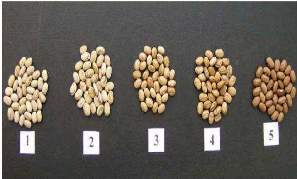
FIGURA 1 Escala de notas utilizada na avaliação do escurecimento das sementes de feijão.