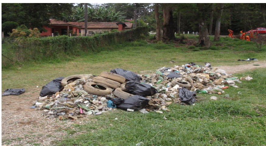
Figura 7 - Resultado do mutirão de limpeza organizado por grupos de monitoramento do programa Mãos à Obra pelo Tietê .