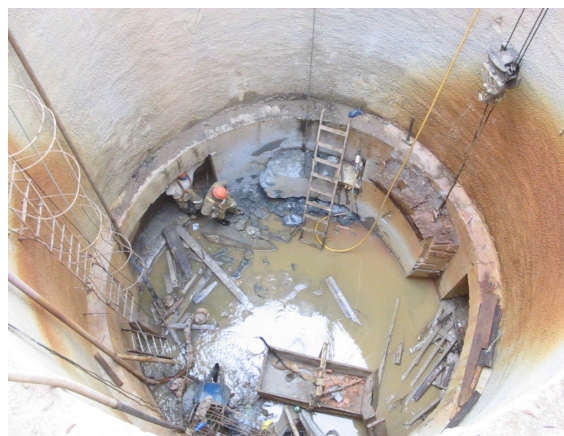
Figura 5 - Obras de construção de um interceptor de esgoto às margens do rio Tietê – Projeto Tietê .

As informações sobre o Projeto Tietê são repassadas aos grupos por e-mail ou em determinados eventos como no Dia Mundial da Água, dia 22 de março do ano de 2005, ocorrendo, um encontro entre Sabesp, membros da Fundação SOS Mata Atlântica, grupos de monitoramento e sociedade civil, visando divulgar informações tanto do Projeto Tietê quanto do programa Mãos à Obra pelo Tietê . Neste evento foi divulgado, pela coordenadora do Núcleo União Pró-Tietê, os resultados das análises de qualidade da água registradas entre 2003 e 2005. Estes dados revelaram que