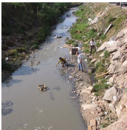
Figura 1 - Integrantes de grupo de monitoramento do programa Mãos à Obra pelo Tietê , coletando amostra para análise da qualidade da água.

Atlântica. Esse kit contém um Guia de Avaliação da Qualidade da Água para a análise de 14 parâmetros 21 . Alguns desses parâmetros, medidos com o auxílio de reagentes e cartelas específicas, são: oxigênio dissolvido, DBO (demanda bioquímica de oxigênio), pH, nitratos, fosfatos, coliformes fecais, turbidez; e outros, medidos por observação, são: lixo flutuante ou acumulado nas margens, espumas, cheiro, material sedimentável, presença de peixes, larvas e vermes vermelhos/larvas e vermes transparentes ou escuros, conchas (ANEXO A).