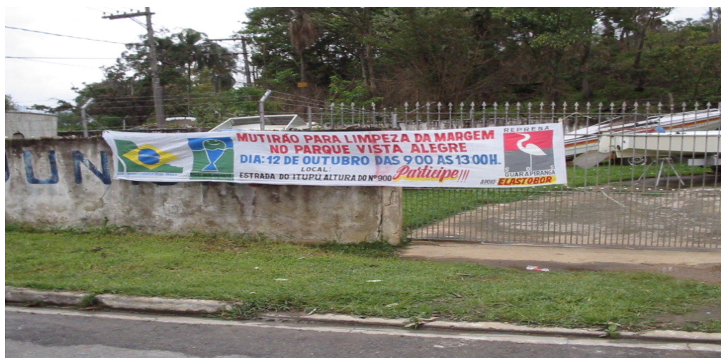
Figura 6 - Faixa com informações sobre o mutirão de limpeza organizado por grupos de monitoramento do programa Mãos à Obra pelo Tietê .

em prol da conservação das nascentes do rio Jundiaizinho, desfile da escola de samba com a temática água, realização de um curso intitulado “Conhecendo a Guarapiranga” para a comunidade desta represa, entre outras. Algumas dessas ações são propostas pelos próprios grupos e outras pelos educadores, mas, independentemente desse aspecto, sempre há o acompanhamento e o apoio institucional da Fundação SOS Mata Atlântica nesses momentos.