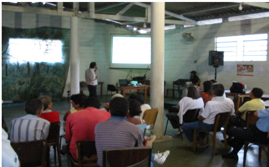
Figura 8 - Reunião entre um grupo de monitoramento do programa Mãos à Obra pelo Tietê , comunidade local e Sabesp para discutir os problemas gerados pela falta de coleta de esgoto, como também para reivindicar tal serviço público à Sabesp. (arquivo Núcleo União Pró-Tietê, 2005)

Percebemos, contudo, que há grupos que não vão além do monitoramento da qualidade da água do rio Tietê, fazem suas coletas, analisam as amostras, registram os resultados e encerram-se aí suas atividades. O que será que ocorre com tais grupos? Será que é possível dar um respaldo maior, já que cada educador trabalha em média com 60 grupos em uma área geográfica extensa, região metropolitana de São Paulo?