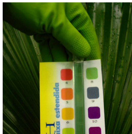
Figura 2 - Cartela utilizada para medir o valor de pH de uma amostra de água coletada por um grupo de monitoramento do programa Mãos à Obra pelo Tietê . (arquivo Núcleo União Pró-Tietê, 2005)

Os dados coletados em campo pelos grupos, são registrados por seus integrantes, diretamente num banco de dados alocado na página eletrônica do programa Mãos à Obra pelo Tietê ( www.rededasaguas.org.br ) ou no caso de o grupo não possuir meios de acesso a essa página eletrônica, são entregues ao educador ambiental responsável. As informações cadastradas constituem um banco