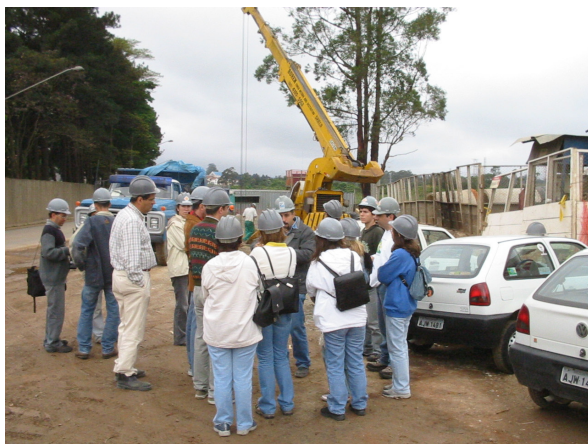
Figura 4 - Grupos de monitoramento do programa Mãos à Obra pelo Tietê em visita ao canteiro de obras do Projeto Tietê .

Uma outra atividade deste programa é informar e “aproximar” os grupos do processo de desenvolvimento do Projeto Tietê . Nesse sentido, um momento bastante interessante são as visitas técnicas às obras de despoluição do rio Tietê e às ETEs (Estações de Tratamento de Esgoto). Nessas visitas, os grupos encontram a oportunidade de acompanhar e entender in loco o sistema de funcionamento das obras do Projeto Tietê e das estações de tratamento, sendo essas sempre monitoradas por um funcionário da empresa responsável pela obra em questão.