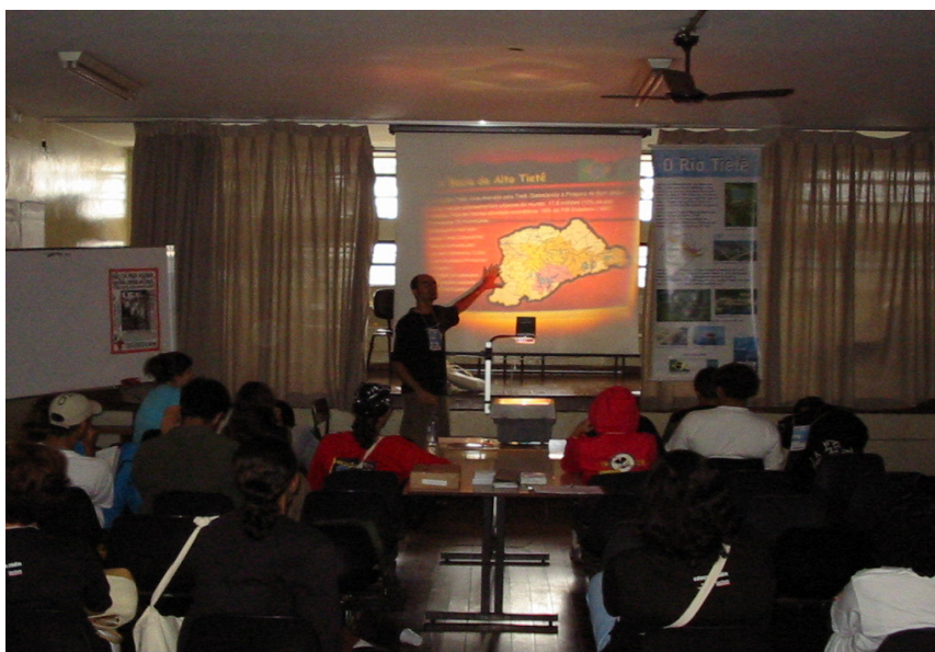
Figura 3 - Educador ambiental ministrando palestra sobre o programa Mãos à Obra pelo Tietê , utilizando o arquivo eletrônico, a alunos do ensino médio de uma escola particular na cidade de São Paulo.

Uma atividade recorrente é a realização de palestras sobre o programa Mãos à Obra pelo Tietê para atores sociais e instituições diversas, tais como: alunos, professores, comunidades, igrejas, empresas, associações, universitários, etc. Para essas palestras, os educadores utilizam-se de uma apresentação em arquivo eletrônico contendo informações e fotografias de temas concernentes ao programa. Essas exposições são requisitadas aos educadores por esses grupos variados, com o objetivo de obterem mais dados sobre o programa. Alguns deles, após esse contato, se integram ao Mãos à Obra pelo Tietê como grupos de monitoramento.