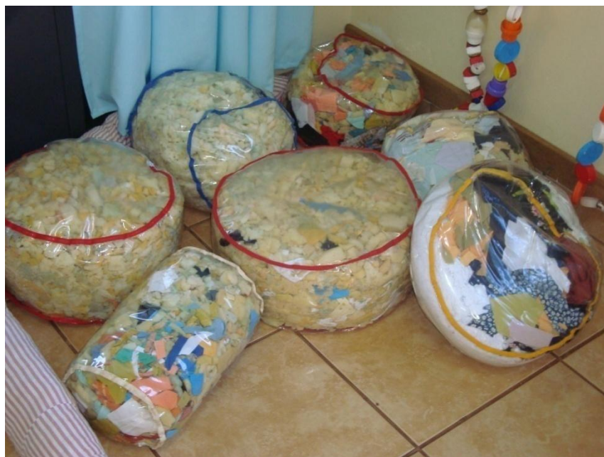
Figura 10: Almofadões de espuma.

Uma menina que estava começando a andar, ainda sem muito equilíbrio, apóia-se num almofadão e sai andando pela sala. (Diário de Campo, 11/09/08).