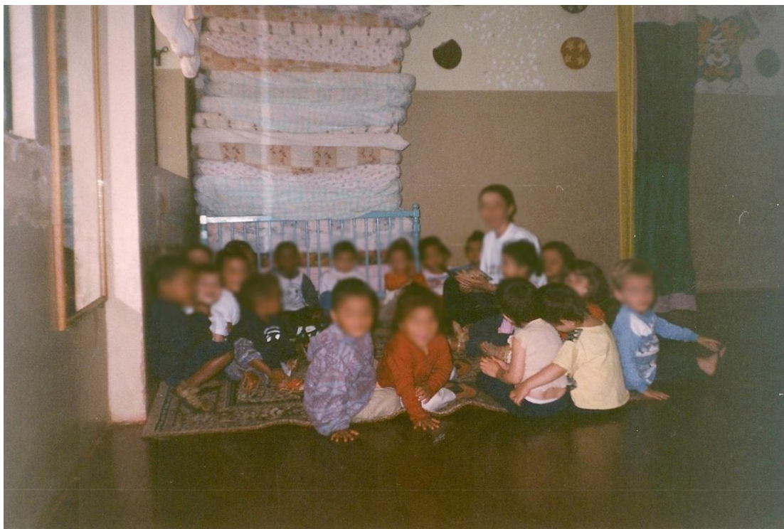
Figura 2: Crianças na sala do maternal I.

A forma como as salas eram organizadas, com poucos móveis, sem prateleiras para guardar os brinquedos e com um amplo espaço vago em seu meio, fazia com que as crianças se sentissem mais perdidas do que acolhidas. Ao entrarem na sala, não tinham o que fazer, com o que se envolver, pois não havia nada à sua disposição e nenhum canto onde pudessem brincar e conversar com os seus pares.