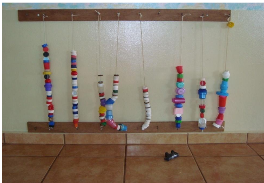
Figura 8 – Intervenção com tampinhas no berçário.

Duas crianças aproximaram das tampinhas penduradas na parede. Uma delas puxava o elástico para ouvir o barulho que faziam ao bater na parede. A outra, de joelho no chão, ficava brincando de movimentar as tampinhas para cima e para baixo. (Diário de campo, 05/05/08).