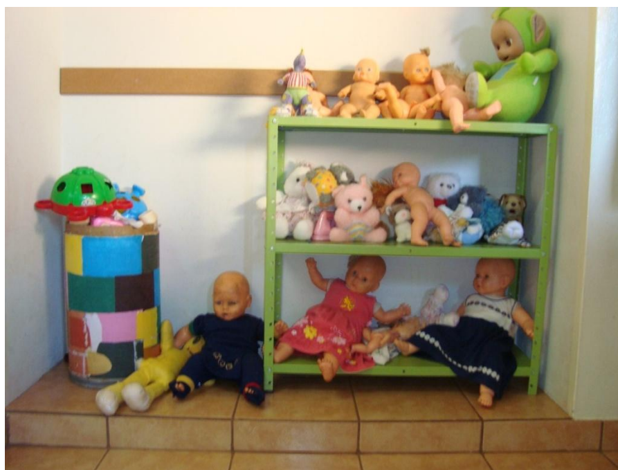
Figura 16: Prateleira no canto da sala.

Nem dá para acreditar que eles brincam tão bem com os brinquedos na prateleira e o quanto isso facilita o nosso trabalho. E a gente achava que tinha que esconder tudo para eles não mexerem. (Conversa com as educadoras, Educadora E, 15/10/08).