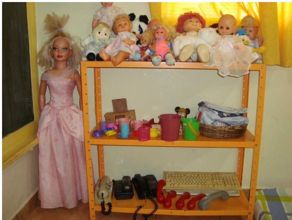
Figura 14: Prateleira da sala do maternal II.

As prateleiras baixas possibilitaram às crianças fazerem escolhas e brincar com os brinquedos e objetos do seu interesse e não somente com aqueles oferecidos pela educadora. Essa intervenção possibilitou ainda, realizar atividades significativas e desenvolvendo, favorecendo o desenvolvimento psíquico. A exploração de objetos com cores, formas, tamanhos, pesos diversos e a comparação entre os objetos, mantinha-as mais atentas na medida em que brincavam com aqueles do seu interesse e desejo. Acabavam imitando as ações dos adultos.