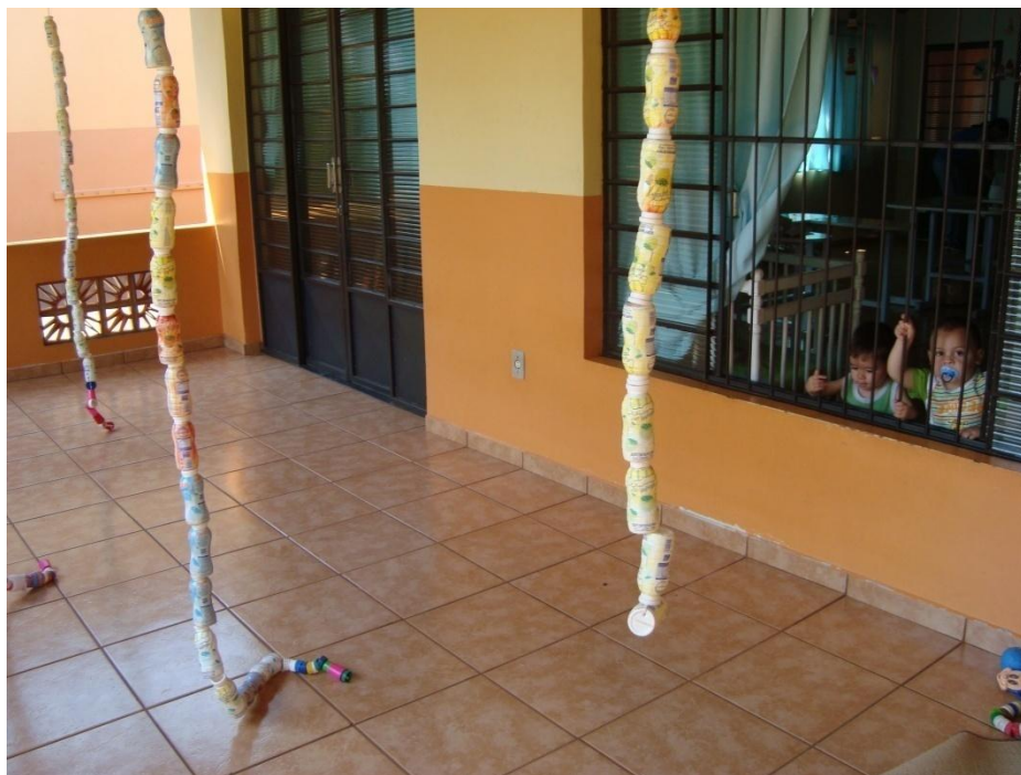
Figura 7: Solário do berçário.

Entre a sala e a área construída à sua frente, foi instalada uma porta de correr para que as educadoras, junto com as crianças, pudessem movimentar-se melhor, de um ambiente para o outro.