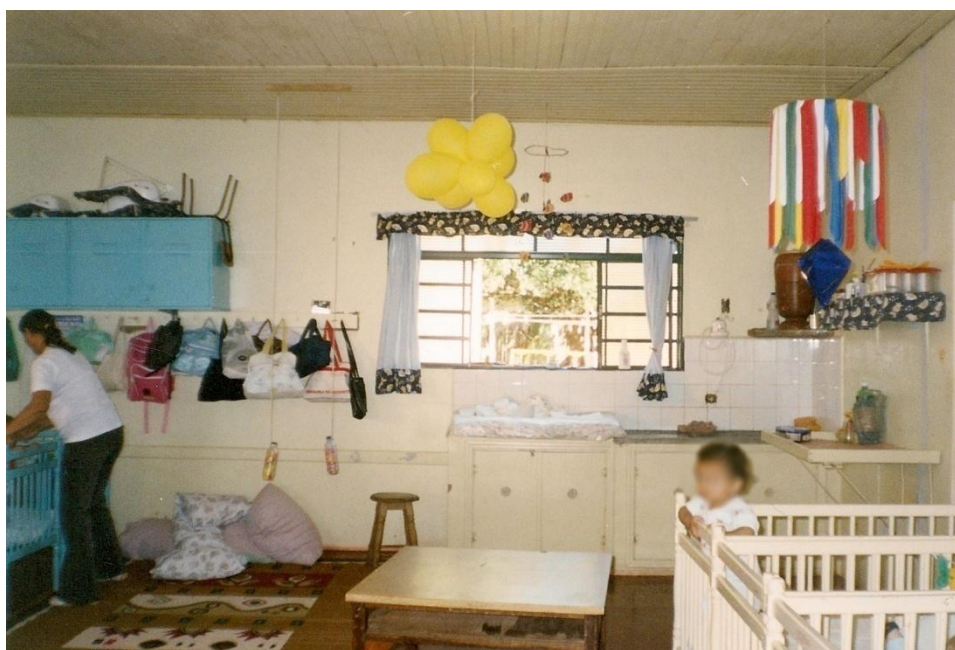
Figura 5: Nova disposição dos berços no berçário.

Aos poucos, alguns berços foram sendo reposicionados na sala para deixar o espaço mais livre, mas os brinquedos e objetos continuavam inacessíveis.