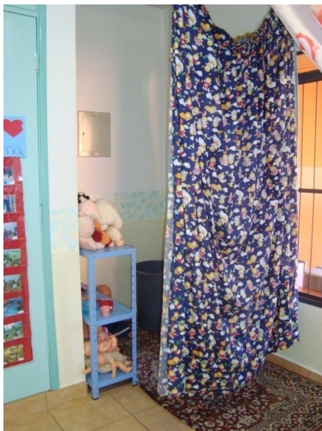
Figura 21: Canto da sala do maternal II.

apanhou uma boneca, sentou no chão trocando sua fralda. Usava uma fralda de verdade que ficava na sala para eles brincarem. (Diário de Campo, turma do maternal II, 14/10/08).