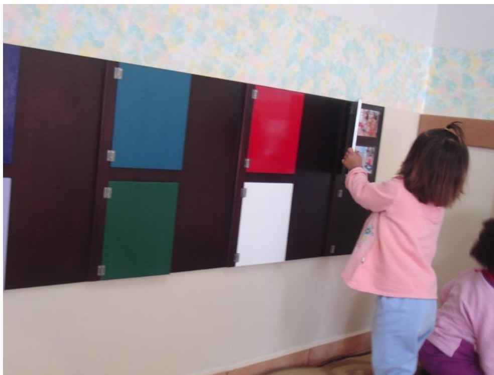
Figura 12: Painel de fotos.

Uma menina estava brincando com o painel de fotos. Abria as janelas e falava os nomes dos amigos que via. Chamou outra amiguinha que estava próxima para olhar também. (Diário de Campo, 14/04/09).