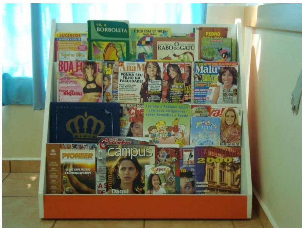
Figura 18: Suporte de livros e revistas.

Saber que antes nós nem contávamos histórias para as crianças. E agora, além de contar, deixamos elas pegarem os livros nas mãos. Na verdade, nós achávamos as crianças muito pequenas para ouvir histórias, pensávamos que não iriam parar para ouvir. Mas as crianças adoram, prestam tanta atenção, que até imitam a gente mostrando os livros para os amigos. A gente estava enganada, elas gostam sim de histórias. (Conversa com as educadoras, Educadora F, 15/10/08).