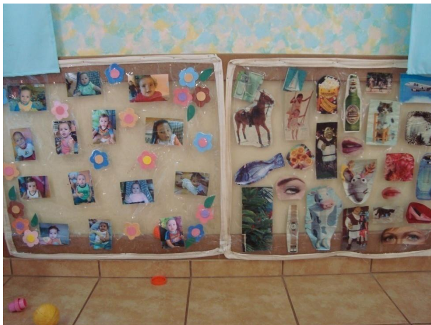
Figura 9: Intervenção com fotos e figuras.

As intervenções continuaram e, no chão da sala, as educadoras colocaram duas cobras feitas de tecido com espuma, de dois metros de comprimento e duas centopéias também de tecido colorido com espuma, de um metro de comprimento. Fizeram ainda alguns almofadões com plástico transparente e espuma. Essas criações passaram a ficar no chão da sala o tempo todo e são muito utilizadas pelas crianças e pelas educadoras.