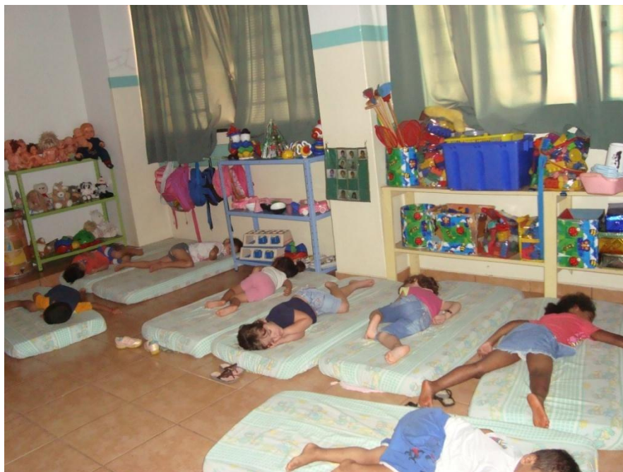
Figura 15: Reorganização da sala do maternal II.

As educadoras reconheceram que as prateleiras baixas contribuíram para o trabalho com as crianças, e como possuíam uma visão equivocada do seu uso.