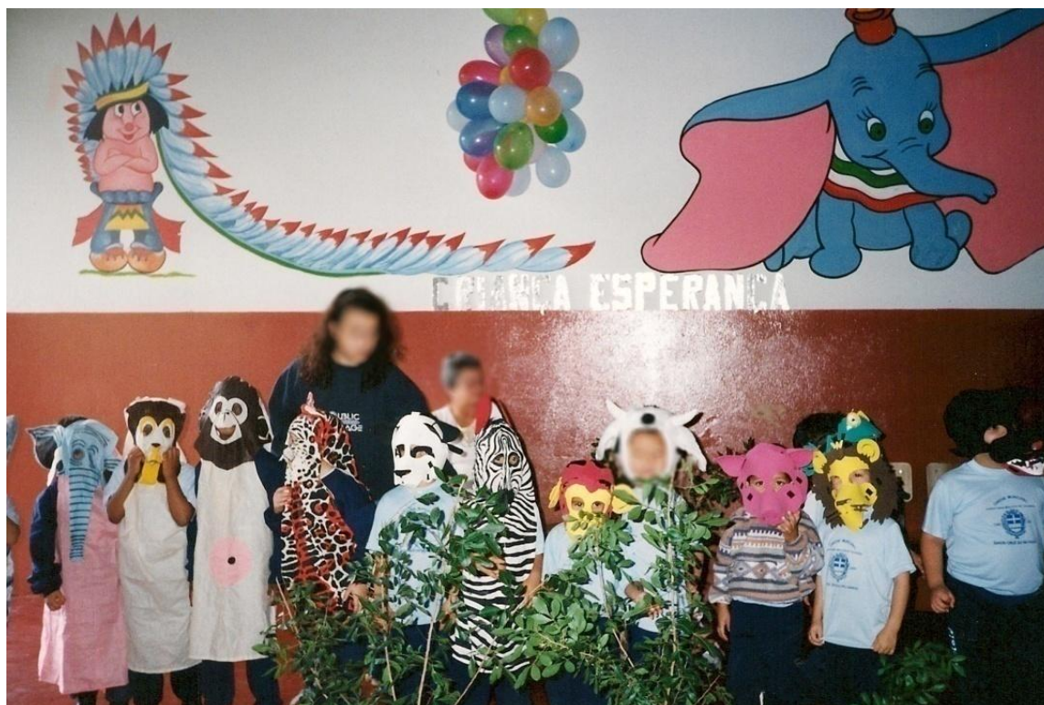
Figura 1: Ilustrações permanentes das paredes.

das crianças, nem os trabalhos feitos por elas ou fotos e registros de algum projeto realizado pelas turmas, e os poucos enfeites pintados nas paredes eram de desenhos estereotipados, feitos pelos adultos. Esses desenhos reforçavam a visão adultocêntrica do espaço, pois eram pintados no alto, próximos da visão dos adultos e não das crianças.