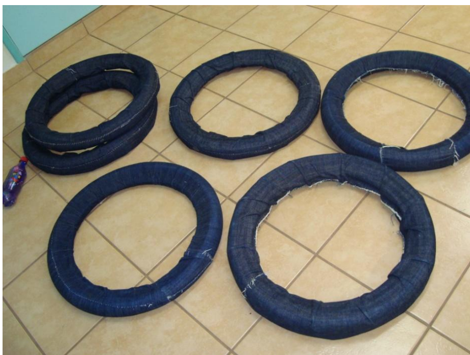
Figura 13: Intervenção com os pneus.

Uma criança foi ao canto da prateleira, pegou um pneu e saiu rolando pela sala. Após de um tempo, mais duas crianças também foram brincar com os pneus. Juntas, o colocaram sobre outro e tentaram entrar neles. Logo outro menino se juntou a elas. Ficaram mudando o monte de lugar. (Diário de Campo, 05/06/08).