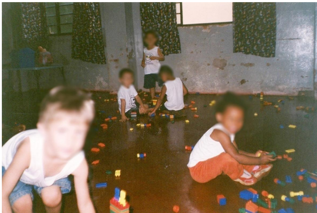
Figura 3: Crianças na sala do maternal II.

Os objetos de uso diário como papel higiênico - para limpar o nariz - e lata de lixo eram mantidos fora do alcance. Somente os adultos podiam limpar o nariz das crianças quando achassem necessário. Se não viam ou percebiam que as crianças precisavam ser limpas, ficavam mal-cuidadas e desconfortáveis pelo nariz sujo. Com o passar do tempo, elas iam se acostumando com aquele estado e não demonstravam insatisfação.