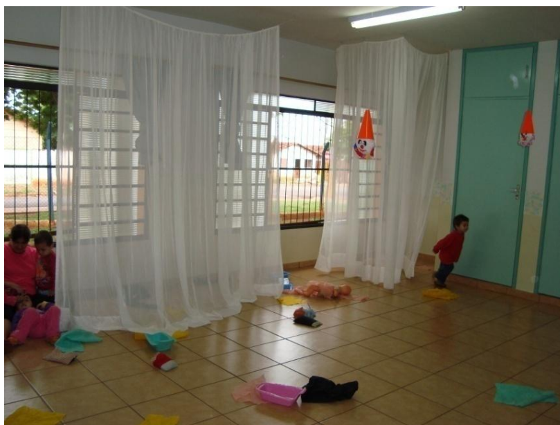
Figura 20: Canto com tecido transparente.

A primeira intervenção feita após as observações foi a retirada da mesa que ficava no canto da sala e a colocação, nesse mesmo espaço, de uma cortina transparente de voal, formando um canto onde as crianças pudessem entrar e sair à vontade para brincar.