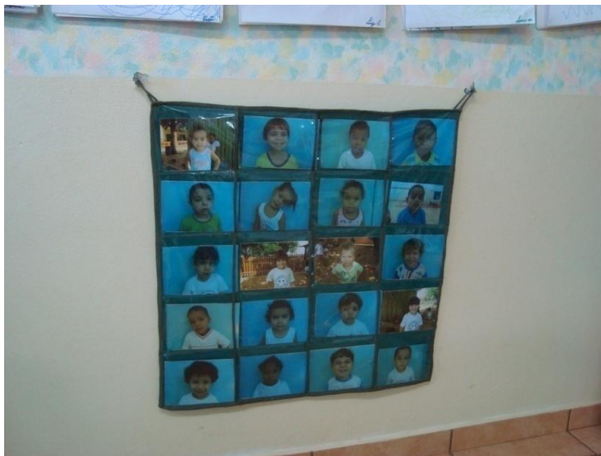
Figura 17: Cartaz de chamada.

Educadora: O cartaz de chamada deu super certo. As crianças adoram colocar a sua foto no cartaz e durante o dia várias vezes param em frente ao cartaz e ficam olhando as fotos.