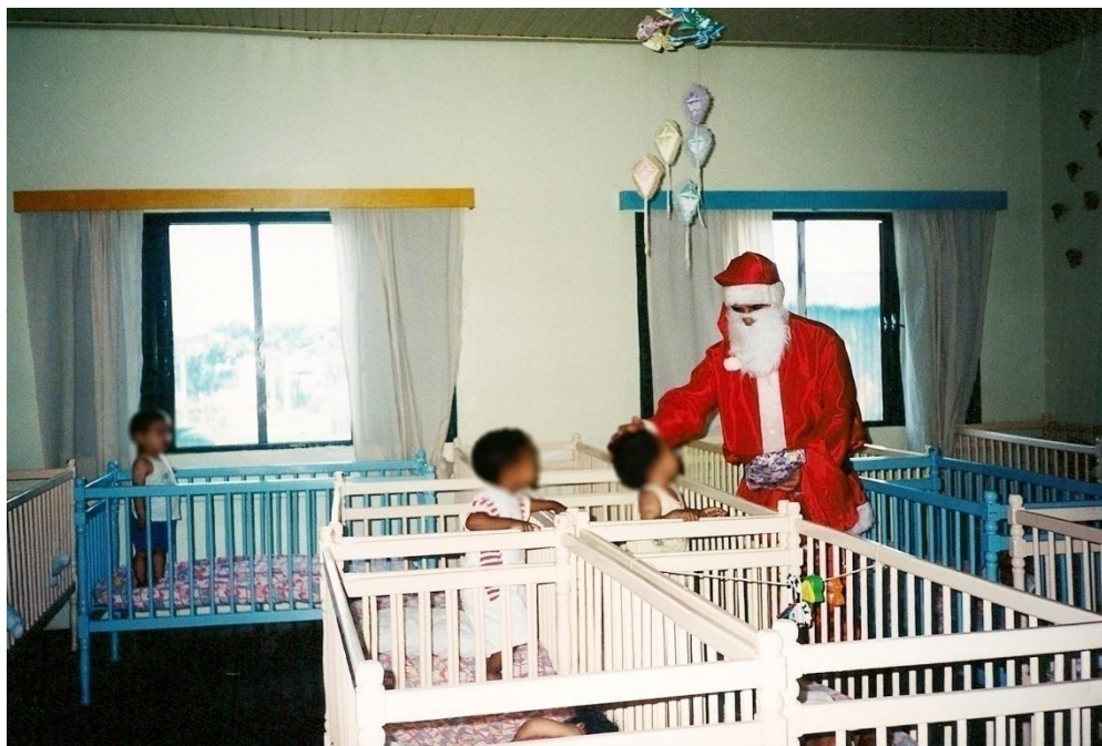
Figura 4: Disposição dos berços na sala do berçário.

Aos poucos, alguns berços foram sendo reposicionados na sala para deixar o espaço mais livre, mas os brinquedos e objetos continuavam inacessíveis.