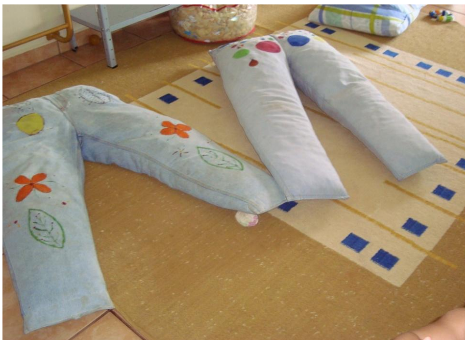
Figura 19: Calças de apoio para os bebês.

Algumas crianças chegam na creche com o corpinho todo mole de tanto ficar no carrinho. Então a gente vai colocando ela no chão, apoiada nas almofadas, na calça, deixa ela se virar um pouco e rapidinho ficam com o corpinho firme. Quando a gente vê, já estão engatinhando. (Conversa com as educadoras, educadora A, 03/06/09).