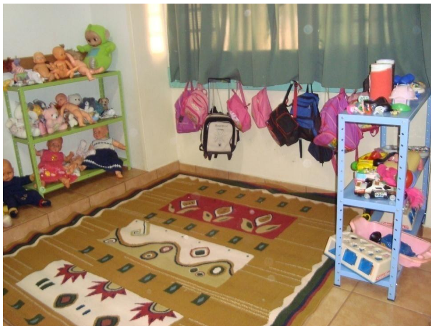
Figura 22: Disposição das prateleiras do maternal II.

Para Mukhina (1996), a atividade principal das crianças de 2 a 3 anos é a atividade com os objetos, mas as crianças também acumulam outras atividades e começam a utilizar tais objetos para imitar as ações realizadas pelos adultos. Ou seja, a própria atividade com os objetos vai dando ensejo ao jogo de papéis, que se inicia propriamente no terceiro ano. Para Venguer e Venguer (1993), no terceiro ano de vida a criança começa a brincar com jogos de papéis e argumentos. Nessa brincadeira, a criança executa o papel assumido, agindo conforme suas características reais.