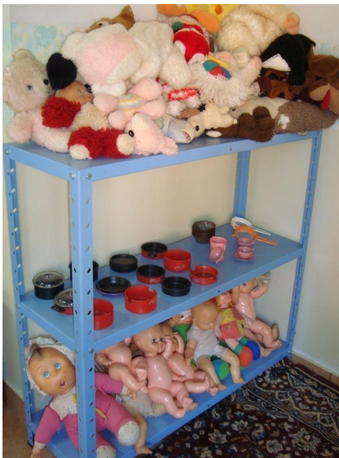
Figura 11: Prateleira acessível às crianças.

Elas gostam mais de brincar com o que pegam. Eu dei as bonecas, mas foram na prateleira e pegaram outras coisas também: garrafas, argolas, bolas e espalharam na sala para brincar. (Conversa com as educadoras, educadora C, 07/04/08).