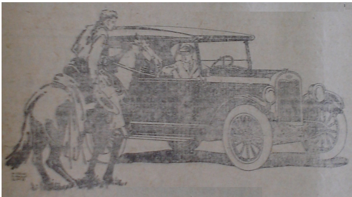
Figura 04 – Propaganda de automóvel fabricado pela Chevrolet cuja tônica se concentra na mobilidade de locomoção.

A ausência do transporte férreo na imagem demonstra o quanto o seu poder de mobilidade era relacionado à idéia de ineficiência, pois o automóvel apresentado nem mesmo poderia surgir superando o trem, dado que, no anúncio, a mensagem que se pretendia divulgar era que a modernidade, em termos de locomoção, significava poder ir e vir de qualquer parte. Esse fato pareceria equivocado se considerado que o trem, em sua ‘essência’, estava intimamente relacionado à idéia de movimento. No entanto, a velocidade em linha reta, progressista foi sinônimo de modernidade no século XIX, positivista. Com o passar dos anos e o continuado desenvolvimento de tecnologias, em meados do XX, o conceito de velocidade é completamente alterado: a partir de então ela devia seguir qualquer percurso, o que era impossível ao trem.