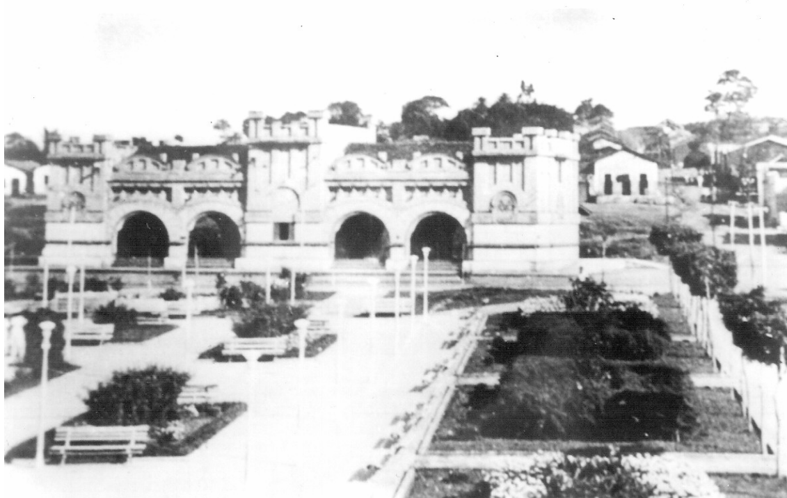
Foto 1 – Praça Francisco Sá e Estação Ferroviária do Crato na década de 1940.