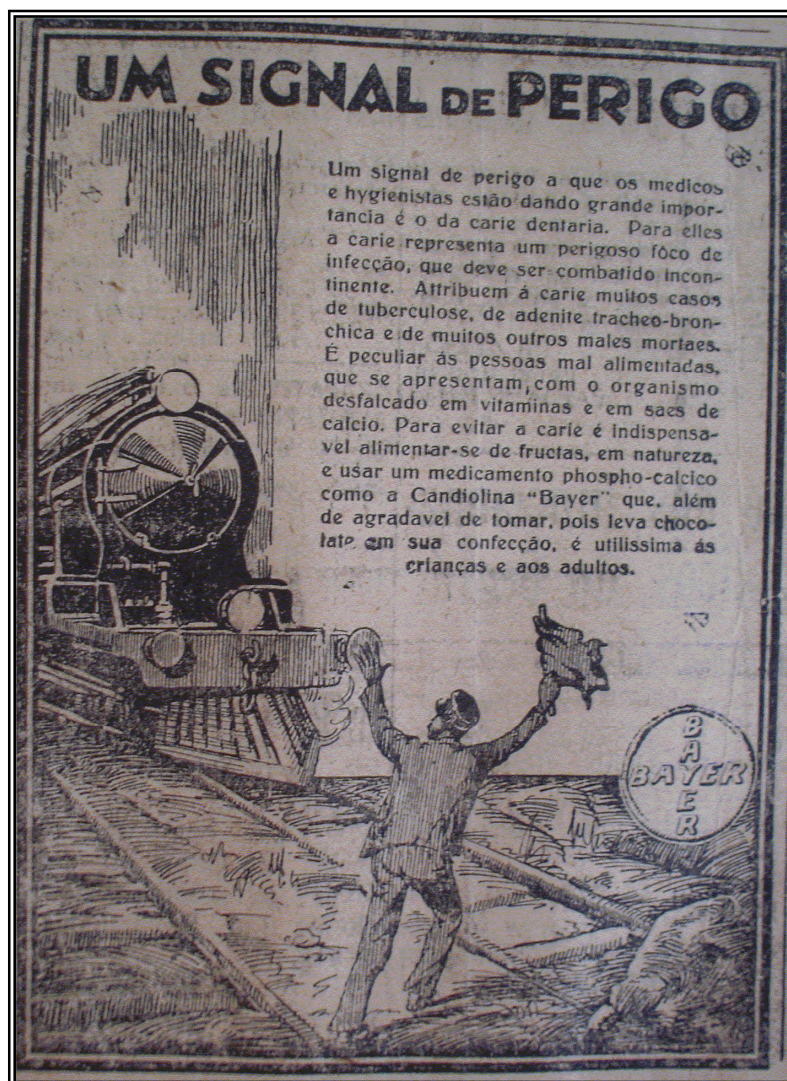
Figura 02 – Anúncio que se utiliza do imaginário do perigo do trem para advertir sobre os riscos da cárie dentária.