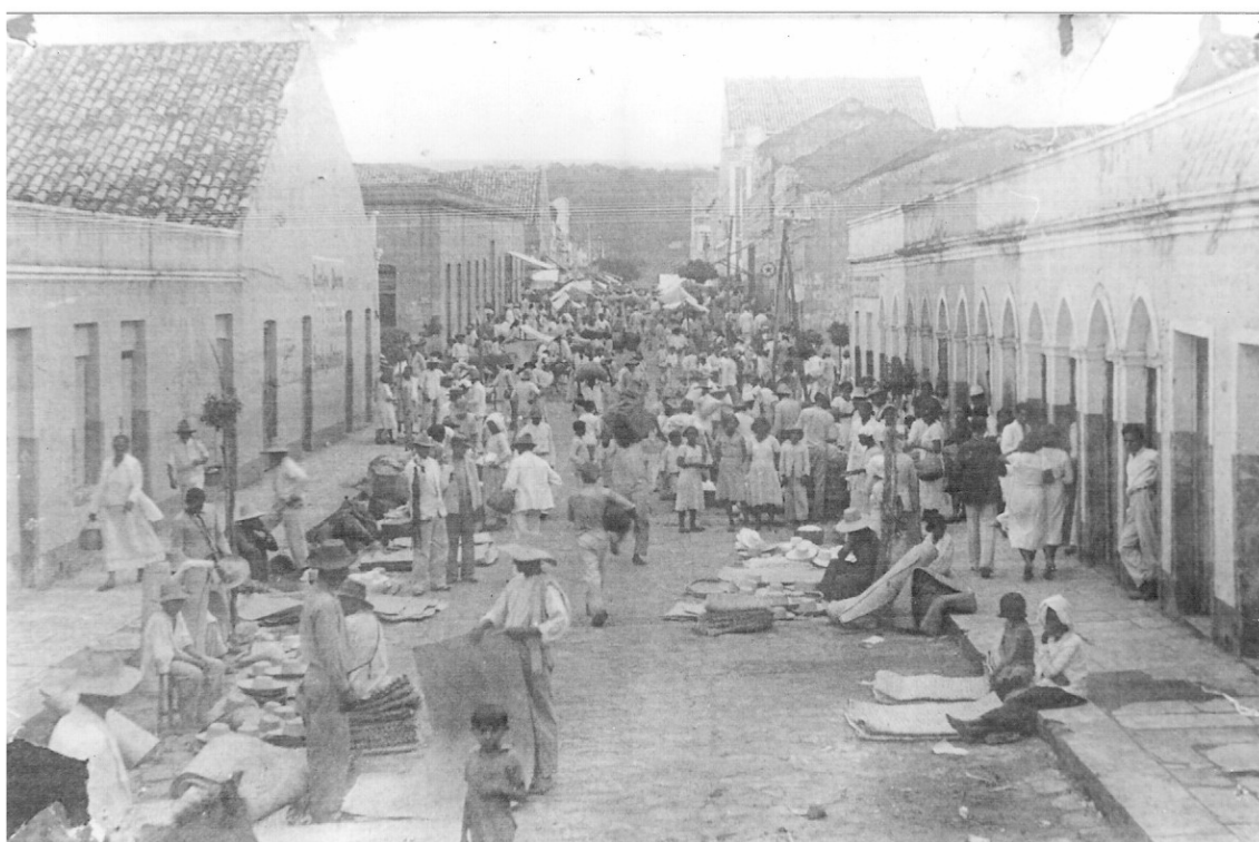
Foto 2 – Rua Grande, atual Dr. João Pessoa, em dia de feira, na década de 1940. O fotógrafo estava posicionado próximo ao cruzamento com a rua do comércio, hoje Monsenhor Esmeraldo, lado no qual se comercializava artigos de palha. À outra extremidade se amontoavam os sacos de farinha, conforme José de Figueiredo Filho.