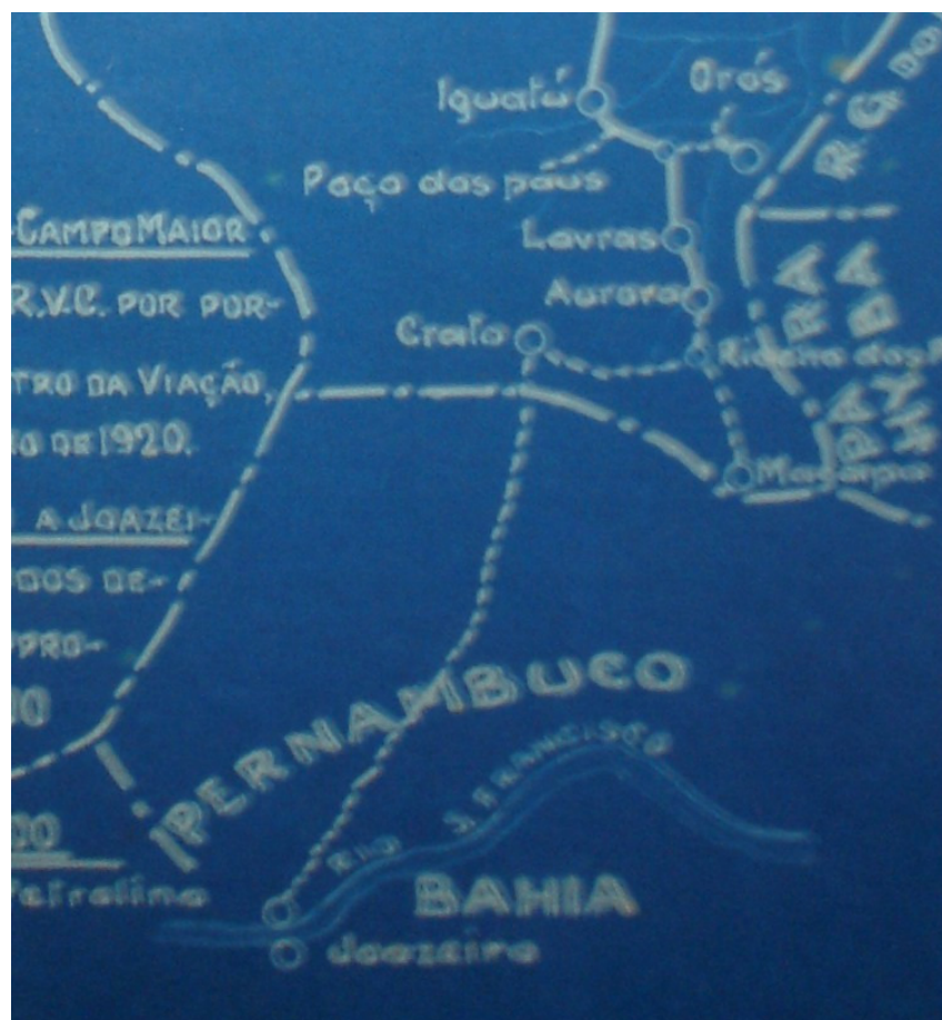
Mapa 1 – Extraído do mapa produzido para o Relatório anual da RVC do ano de 1921, o qual prevê o prolongamento dos trilhos até as margens do Rio São Francisco.

Da mesma forma que ocorreu no restante da malha ferroviária do país, as questões financeiras e burocráticas influenciaram a construção dos trilhos de Baturité. A falta de recursos também implicou em variações na velocidade com que os trabalhos eram realizados. As concessões passaram de uma empresa a outra até que o governo do Estado do Ceará encampou a obra.