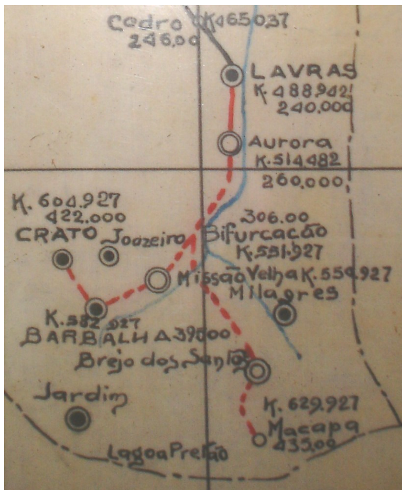
Mapa 3 - Projeto da Rede de Viação Cearense no qual a cidade de Juazeiro era excluída do traçado

Mapa 2 – Extraído dos documentos constantes no Arquivo da RVC, em cujo traçado da Estrada de Ferro de Baturité ainda não havia a substituição da cidade de Barbalha pela de Juazeiro do Norte.