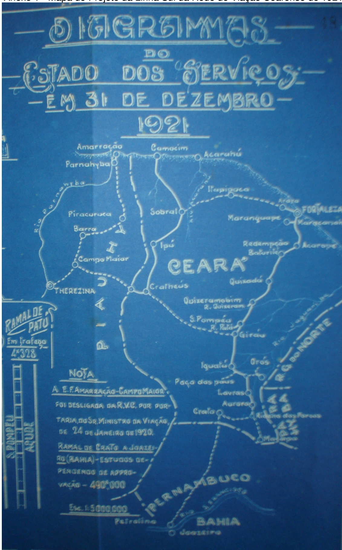
Anexo 1 - Mapa do Projeto da Linha Sul da Rede de Viação Cearense de 1921