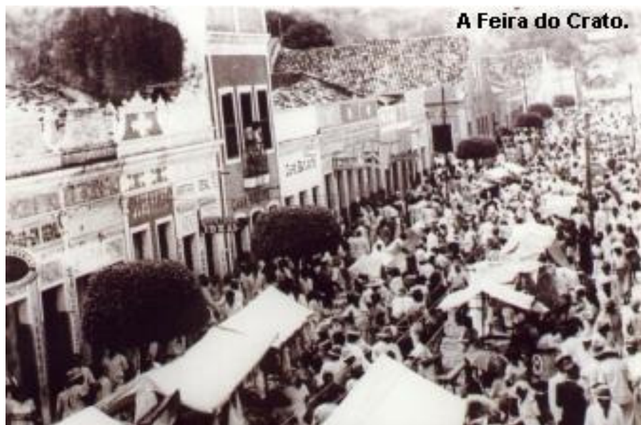
Foto 1 – Continuação da Rua Grande, atual Dr. Miguel Limaverde, em dia de feira, na década de 1950. O fotógrafo estava posicionado próximo a Igreja da Sé Catedral.