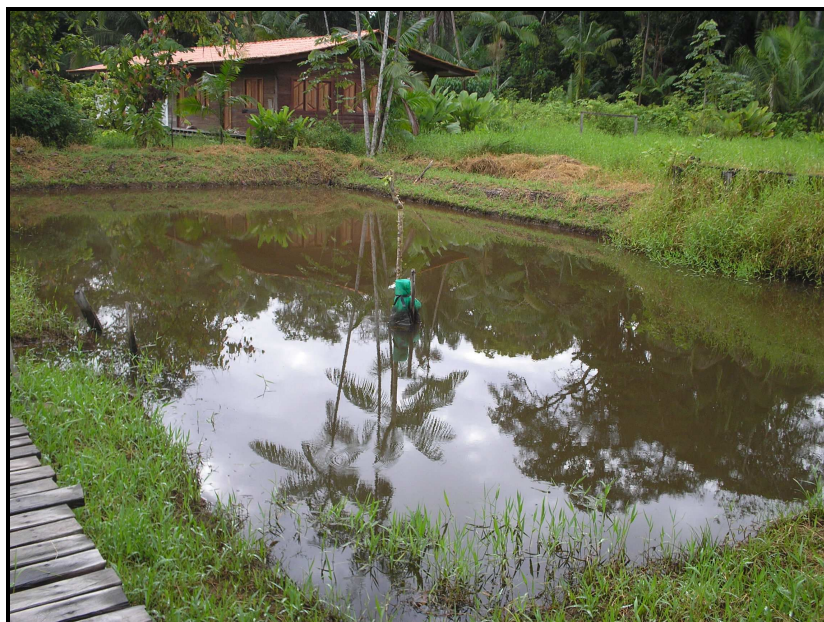
IMAGEM 13: Tanque de Piscicultura na CFR

Piscicultura: a idéia de criação de peixes em tanques surgiu na CFR, se estendeu a comunidade do Rio Uruaí onde fica localizada a CFRG e se disseminou por outras comunidades do município. De acordo com o Monitor Alaércio, a demanda de tanques de peixes chega a ser de 27 por alunos, necessitando por ano de 40 mil alevinos. Isso está sendo desenvolvido na propriedade familiar de cada um. À medida que as experiências vão acontecendo, ocorre um processo de disseminação de tecnologia, e outras famílias vão se apropriando e desenvolvendo em sua propriedade.