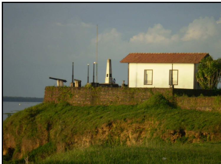
IMAGEM 01: Forte de Santo Antonio de Gurupá Fonte: Acervo de Genésio Oliveira (março de 2008)