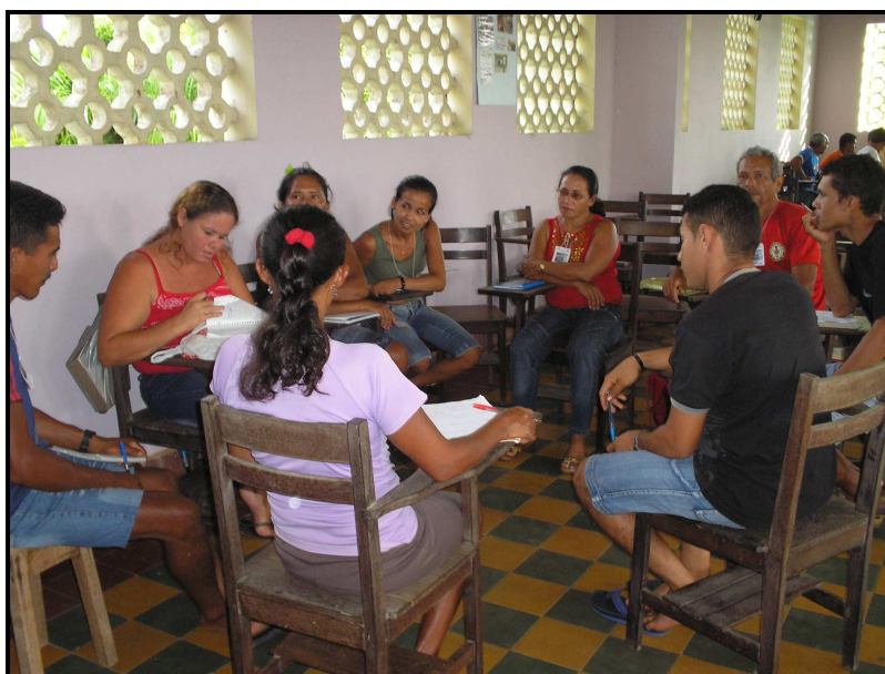
IMAGEM 05: Debate em grupo durante a Semana Catequética, Julho de 2008.

Observamos que a Igreja Católica tem apoiado sua prática nos processos de Educação Popular “considerada como uma forma de educação política cuja definição é qualificada por uma clara conotação classista que a diferencia de outras formas de educação não-formal” (BRANDÃO, 2002, p.86). Neste sentido, a Educação Popular é uma pratica pedagógica mediadora que cria e reforça instâncias de organização popular, de mobilização de classe no mundo e na cultura do povo.