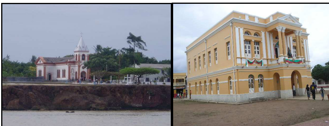
IMAGEM 02: Igreja Matriz de Santo Antonio de Gurupá Fonte: Acervo de Genésio Oliveira (março de 2008)