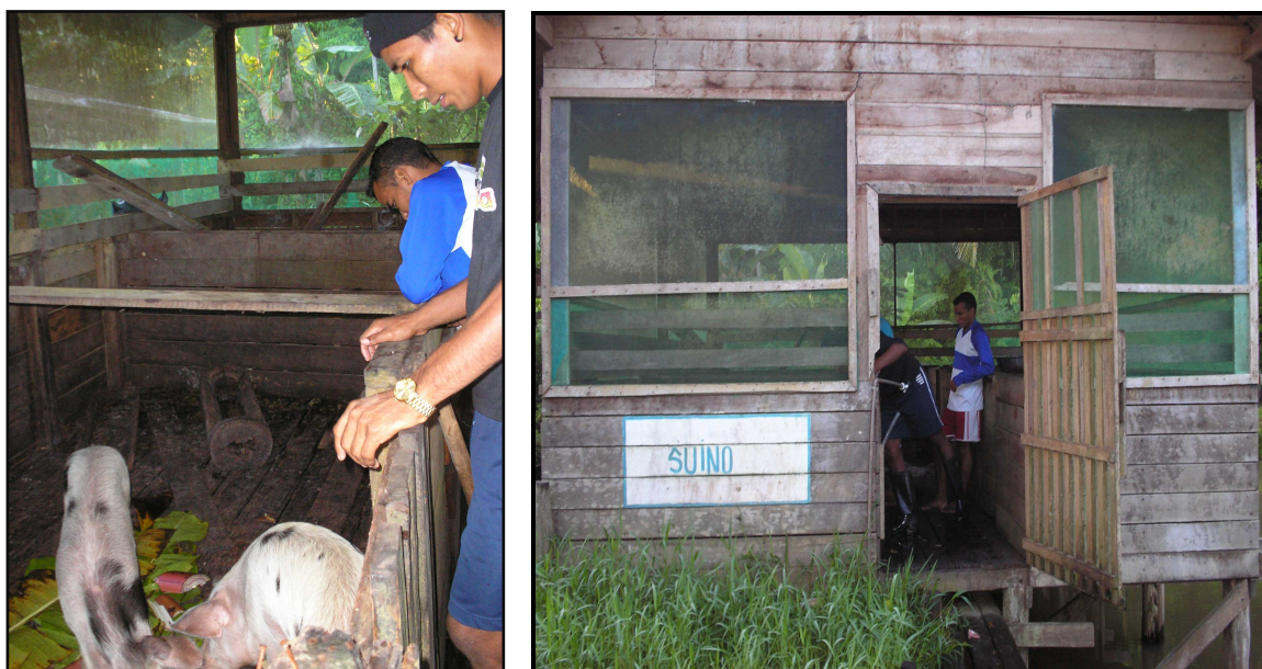
IMAGEM 14: Espaço de criação e melhoramento de suínos

Criação de Suínos: começou na CFRG com o melhoramento na questão raça e na forma correta de criar, tem se disseminado nas comunidades.