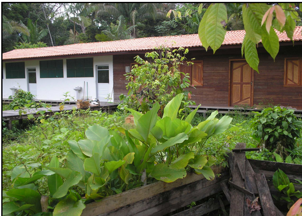
IMAGEM 10: Unidades de Estudo e Produção: agroindústria (cozinha industrial e oficina de artesanato)

A Casa Familiar Rural possui uma infra-estrutura diferenciada em relação às demais escolas situadas no campo e pertencentes à rede municipal, isso tem provocado questionamentos na sociedade sobre a necessidade de ampliação da CFRG e também de melhorias nas escolas municipais que possam também usufruir de uma boa infra-estrutura. A coordenadora do Sindicato dos Trabalhadores em Educação Pública no Pará- Sub-sede Gurupá, esclarece sobre as condições de funcionamento das escolas municipais