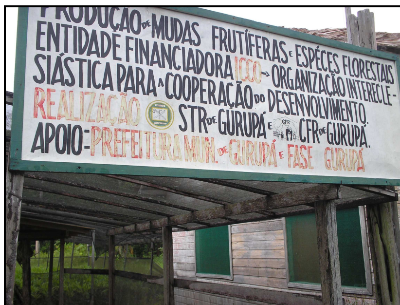
IMAGEM 12: placa na CFRG informando as parcerias no desenvolvimento do projeto de produção de mudas frutíferas e espécies florestais