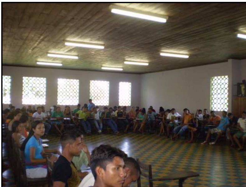
IMAGEM 04: Encontro de Formação de Lideranças Jovens, julho de 2008.