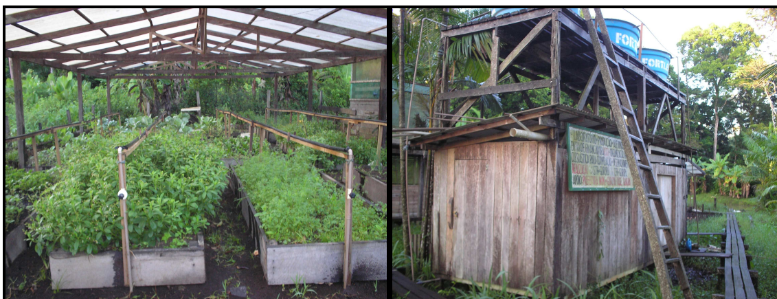
Imagem 8: Horta da CFRG

Para que a CFRG possa operacionalizar suas atividades didático-pedagógicas conta com o seguinte quadro de funcionários: sete monitores, sendo dois agrônomos e 5 técnicos agropecuários; três técnicas pedagógicas, dois professores com licenciatura plena (curso Formação de Professores), um corpo administrativo composto de assistente administrativo e diretor operacional, dois auxiliar de serviços gerais e 2 vigias.