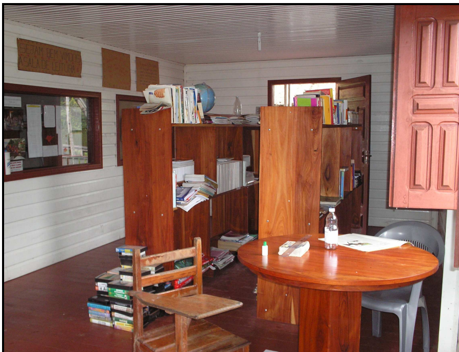
IMAGEM 11: Biblioteca Fonte: arquivo da autora/ 2008

A CFRG já formou 4 turmas de ensino fundamental desde 2000 correspondentes a 96 jovens. Possui uma turma de ensino fundamental com 21 alunos e seis (6) turmas de ensino médio, que iniciaram no ano de 2007, todas as turmas de ensino médio estão cursando o 2º ano desta etapa de ensino. Cinco turmas funcionam na estrutura da Casa no rio Uruaí e uma turma funciona em um espaço alugado no Rio Itatupã a 12 horas de distância da cidade até esta localidade. É um curso de ensino médio integrado ao Técnico em Agroextrativismo e possui 141 alunos. No terceiro ano serão desenvolvidos projetos a fim de potencializar a produção na propriedade de cada jovem. Em relação ao funcionamento do ensino médio, informa a técnica pedagógica que