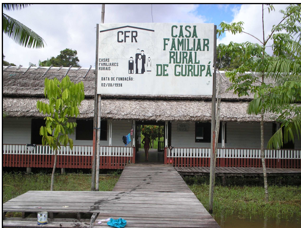
IMAGEM 06: Visão frontal da CFRG/ Fonte: Arquivo da autora, julho de 2008

Para um melhor entendimento apresentaremos a Associação da Casa Familiar Rural, gestora do projeto, em seguida a infra-estrutura da Casa Familiar Rural para compreendermos as suas condições de funcionamento e posteriormente a dimensão político-pedagógica para termos uma visão global desta e podermos compreendê-la no contexto do desenvolvimento local.