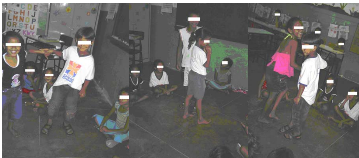
Foto 10 (Alunos da Escola A dramatizando a cantiga “Fui no Itororó”)

Fui no Itororó beber água não achei achei bela morena que no Itororó deixei Aproveite, minha gente, que uma noite não é nada Se não dormir agora, dormirá de madrugada Ó dona Maria, Ó Mariazinha, entrarás na roda e ficarás sozinha Sozinha eu não fico nem hei de ficar porque eu tenho o fulano para ser meu par .