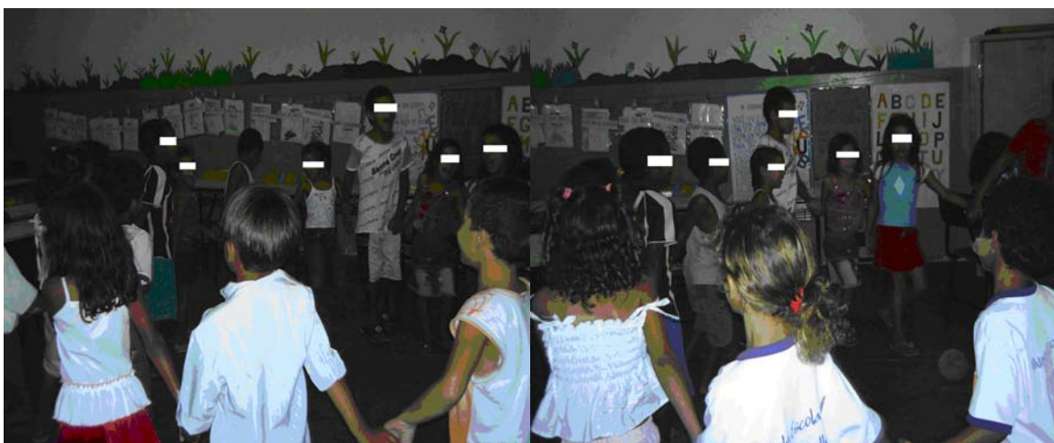
Foto 9 (Alunos da Escola A brincando de roda dentro da sala de aula)

“brincar significa sempre libertação” e a sensação que demonstraram foi exatamente a de um momento liberto da mesmice escolar, mesmo sendo alunos de uma professora que se preocupa com os interesses infantis, contudo, a escola tem sido um espaço onde a razão e o raciocínio lógico tem lugar garantido e de destaque em detrimento dos aspectos mais espontâneos, tais como a brincadeira e a afetividade.