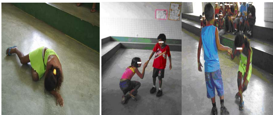
Foto 20 (alunos da Escola B dramatizando a cantiga “Terezinha de Jesus”)

O uso do CD estimulou muito as crianças e facilitou a aprendizagem de algumas músicas de maneira mais rápida. As fotos abaixo nos mostram alguns desses momentos: