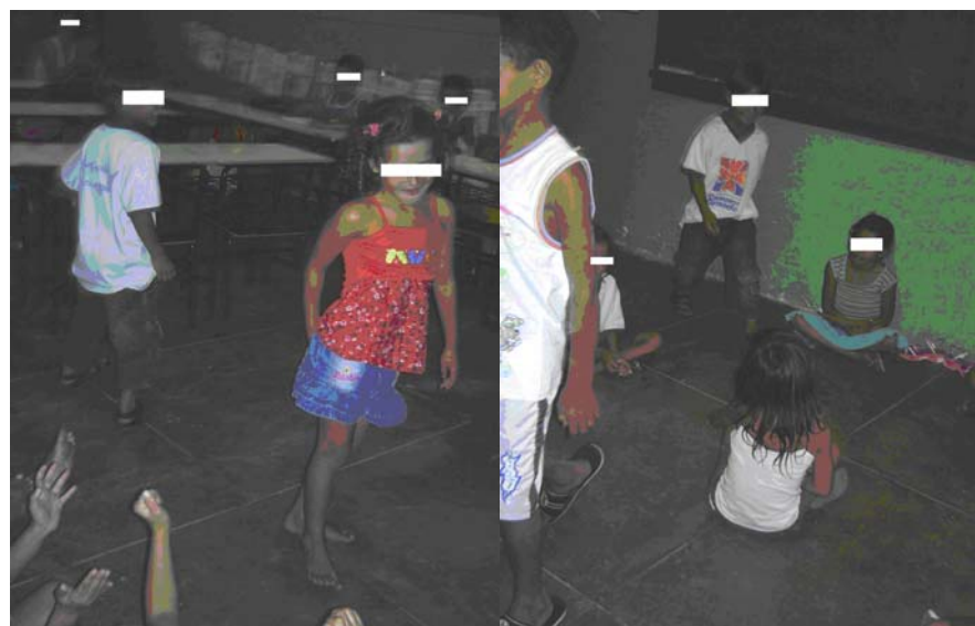
Foto 12 (Alunos da Escola A dramatizando a cantiga “Escravos de Jó”)

Escravos de Jó, jogavam caxangá Tira, põe, deixa o Zabelê ficar... Guerreiros com guerreiros fazem zigue zigue zá Guerreiros com guerreiros fazem zigue zigue zá