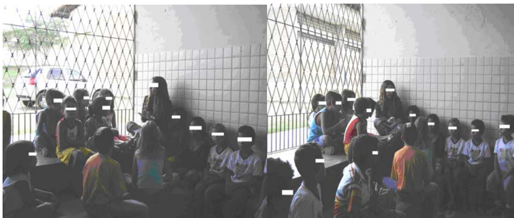
Foto 22 (Pesquisadora e alunos da Escola B no momento de recepção dos textos poéticos)

Nesse estágio, as crianças já conseguiam evidenciar suas emoções através de conversas informais, que se estendiam durante longos minutos. Demonstravam interesse em falar sobre os textos, dando destaque à inventividade do poeta (e não sobre “o que o autor quis dizer” como insistem alguns professores e livros didáticos).