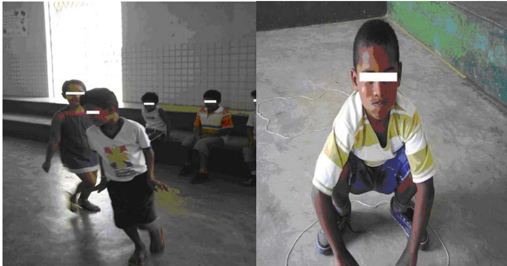
Foto 24 (Alunos da Escola B dramatizando os poemas “O pato” e “Vida de sapo”)