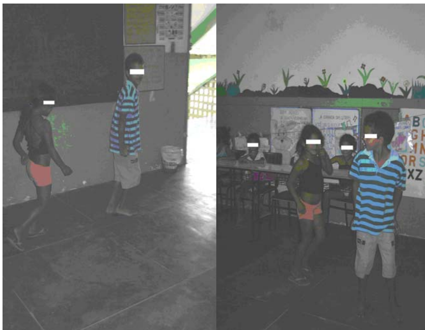
Foto 13 (Alunos da Escola A realizando um jogo dramático com o poema “O pingüim”)

É importante esclarecer aqui alguns aspectos referentes ao jogo dramático, para um melhor entendimento da dinâmica. Segundo Pinheiro (2002, p. 42) “a tentativa de aproximar poesia e jogo dramático nasceu da necessidade de oferecer alternativas lúdicas, criativas, que não se prendam ao meramente formal e informativo”.