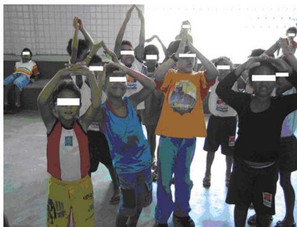
Foto 25 (Alunos da Escola B em momentos de motivação para posterior vivência com os textos poéticos “Bolhas”, “Colar de Carolina” e “A casa”)