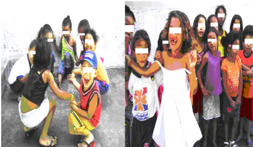
Foto 8 (Alunos da Escola A interagindo durante a brincadeira de roda)

Em meio a esse turbilhão de gritos e sorrisos, ouvimos vozes cantando a música “Atirei um pau no gato”. Procuramos a direção do som e, quando o encontramos, vimos um pequeno grupo de crianças brincando de roda; um outro observava a brincadeira, acompanhando a música.