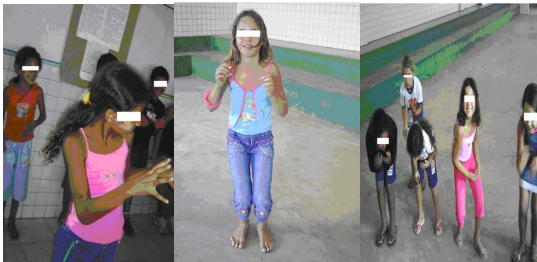
Foto 21 (alunos da Escola B dramatizando as cantigas “A linda rosa Juvenil”, “Samba Lê-lê” e “Carneirinho, carneirão”)

Dentre as cantigas mencionadas acima, as crianças gostaram principalmente da música “Carneirinho, carneirão” e, por isso, a repetíamos diversas vezes de modo que, cada uma delas, pudesse ocupar a posição de rei, no momento da brincadeira.