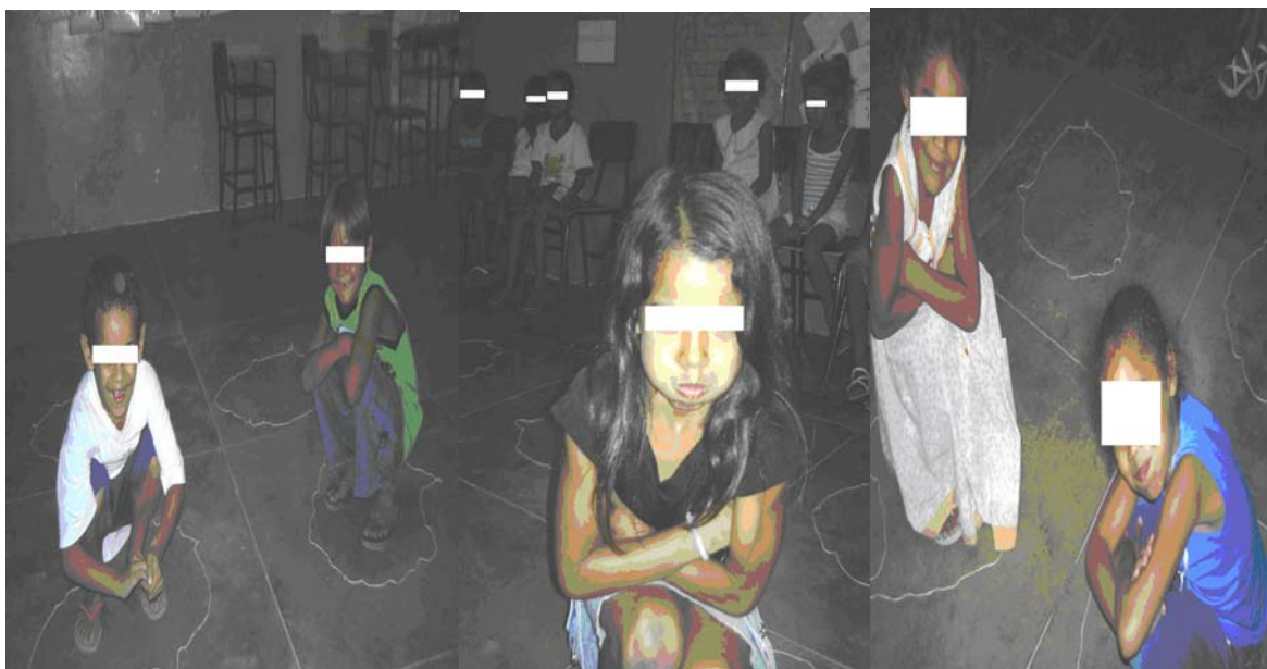
Foto 14 (Alunos da Escola A realizando um jogo dramático com o poema “Vida de sapo”)