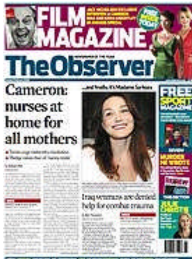
A capa do Observer em 3 de fevereiro de 2008, mês da mudança.

Em fevereiro de 2008, o Observer , um dos principais jornais ingleses alterou dramaticamente o seu visual. Conhecido por ser um jornal semanal analítico, com textos profundos, o Observer ganhou títulos grandes, “olhos” (destaques que aparecem entre as reportagens como “caixas de frases” para chamar a atenção do leitor), fotos, cores fortes e um recurso considerado como uma das últimas tendências neste campo – o uso da “cabeça” (espaço onde se localiza o título do jornal) para destacar chamadas importantes da edição. O objetivo, segundo o designer Ary Moraes foi “favorecer a leitura de grandes blocos de texto sem torná-la massacrante”. 530 Ou seja, um jornal que tradicionalmente se destacou pelo texto mudou para, ao destacar o visual, reforçar junto a novos leitores que o seu texto é aprazível para leitura.