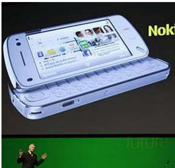
O modelo N97: celular com teclado “qwerty”.

Verifica-se que celulares com funções de rádio são lançados num dia e, dois meses depois, já há celulares com teclados de computador. Os produtos se substituem rapidamente, ressaltando uma ou outra opção mais agradável para um ou outro consumidor e enaltecendo a máxima de que as modernas tecnologias de comunicação são apenas as últimas.