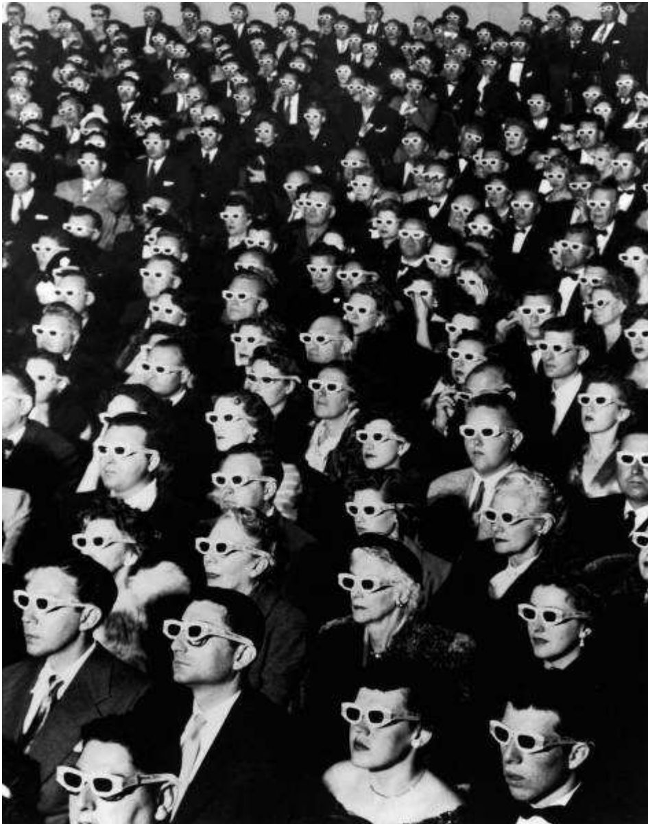
Os óculos em terceira dimensão: estratégia do cinema para combater o advento da TV. 75

Hoje, a distribuição representa o maior faturamento da indústria do cinema. As salas de exibição significam apenas 20% dos lucros, em média. Em muitos casos, os filmes enviados às salas de cinemas logo em seguida são lançados em DVD. E mesmo assim, especialistas já questionam essa nova tendência. O cinema não é apenas uma rede de distribuição de filmes, declarou George Lucas, o famoso cineasta da série Guerra nas Estrelas. É também uma atividade social e um espaço para o debate público. Baseado em Lucas, o cineasta brasileiro José Padilha definiu o cinema, hoje, como uma espécie de “ hub cultural ”. “É um ponto de encontro de opiniões e uma atividade fomentadora de debates públicos”, disse Padilha. Neste contexto, continuou o autor