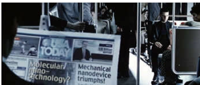
A edição do USA Today lida no metrô, na ficção de 2054. O jornal é em papel, como hoje.

Essa necessidade de realizar contínuas adaptações tornou-se intrínseca a veículos de diferentes meios de comunicação. De modo que a fisionomia do jornal impresso deve ser alterada neste constante processo de mudanças. No filme “Minority Report”, vemos um jornal impresso que atualiza as notícias imediatamente através de células tecnológicas.