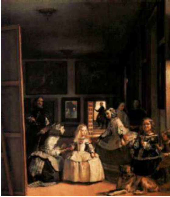
O quadro de Velázquez, no Museu do Prado, em Madri, é um exemplo de interatividade através da pintura, segundo o cineasta Peter Greenaway. 70

O cineasta Win Wenders comparou os DVDs ao significado que os livros possuíam antigamente. “Gosto dos DVDs. Com eles, posso tratar os filmes e tê-los como tenho livros. Posso ir para o capítulo que gosto ou ouvir os comentários do diretor. São experiências completamente diferentes”, disse Wenders, comparando a experiência de assistir a um filme no DVD ou na sala de cinema. A experiência da sala de cinema não se perdeu, concluiu Wenders. “Mesmo gente jovem gosta de sala escura.” O que se ganhou foi uma nova possibilidade de se conviver com a produção cinematográfica, de levá-la para casa e vê-la da forma que lhe melhor convém.