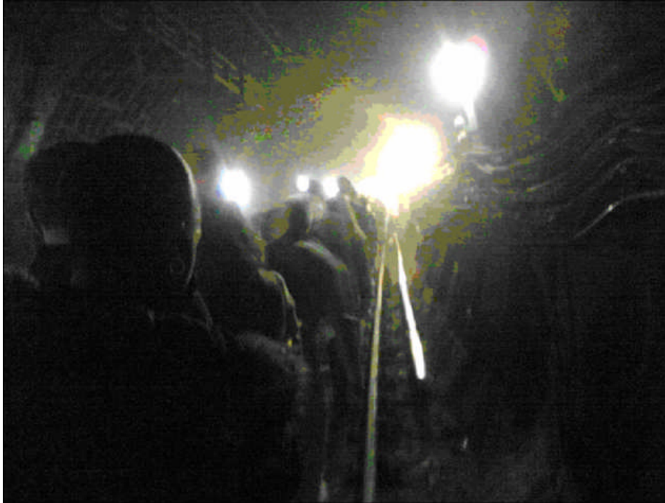
A foto tirada de um celular após os atentados a Londres foi reproduzida por vários jornais.

Observa-se que a foto não tem boa qualidade. Não há rostos, mas apenas vultos de pessoas. Há luzes ao fundo indicando alguma possibilidade de saída de uma situação incomum de penumbra, mas não sabemos ao certo o que são aquelas luzes. Podem ser “luzes de emergência” do sistema do metrô. Os trilhos também não estão bem identificados, apesar de notarmos que as pessoas estão caminhando no lugar destinado aos trens. A imagem não está focada. Dificilmente seria aprovada pela redação de um jornal se tivesse sido entregue por um fotógrafo profissional.