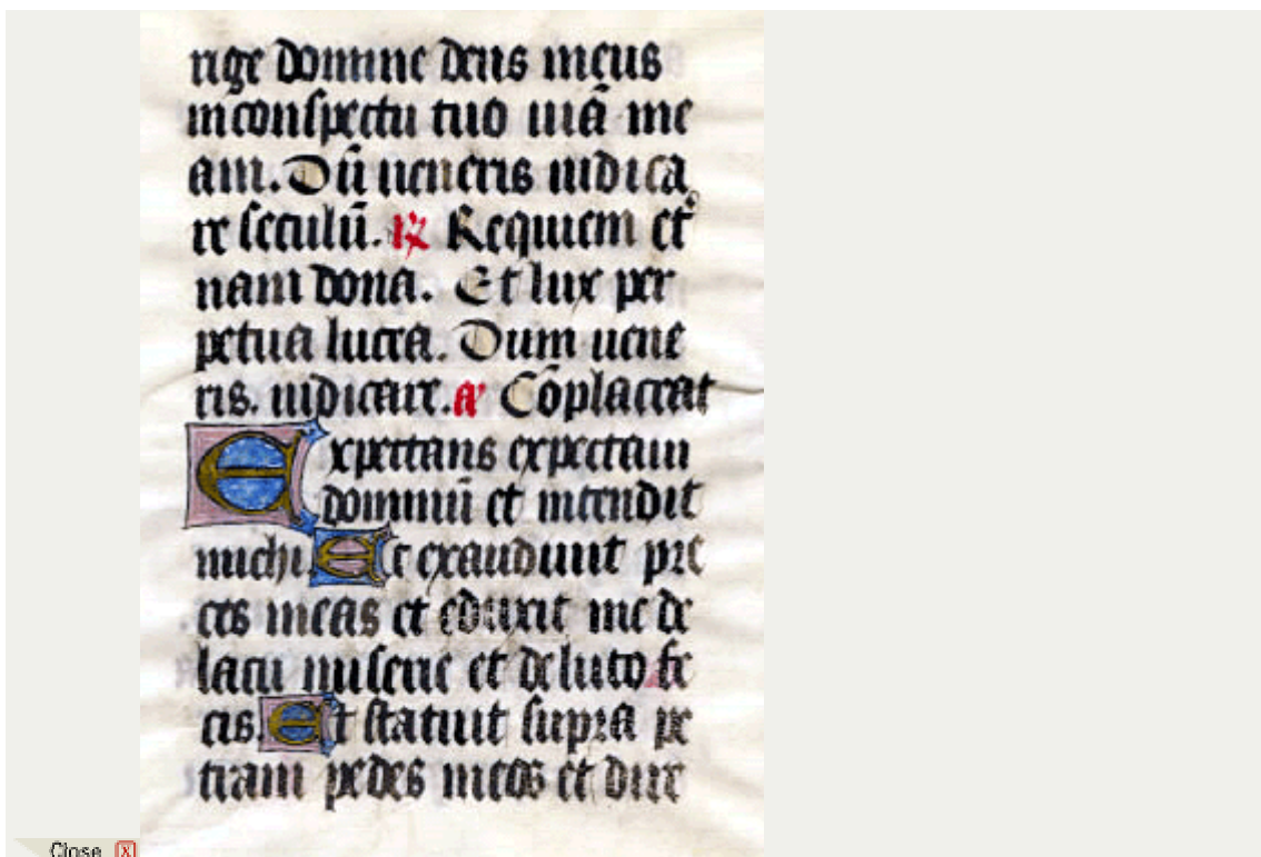
Detalhe da Bíblia de Gutenberg. As primeiras letras impressas da história tinham a aparência manuscrita. 237