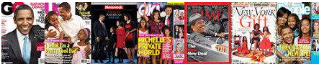
Capas de revistas americanas após a eleição de Obama. 457

Após a vitória de Obama praticamente todas as revistas americanas colocaram-no em suas capas sorrindo e ao lado de sua família, como vemos a seguir.