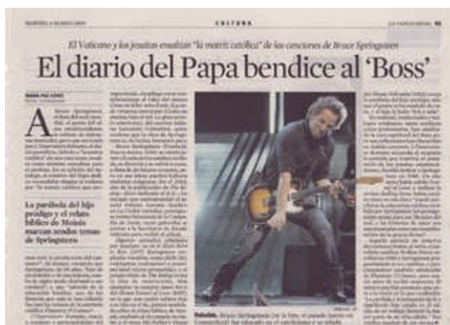
Reportagem do jornal espanhol La Vanguardia sobre a cobertura do L'Osservatore ao show de Bruce Springsteen.

Há diversos casos de jornais que alteraram as suas práticas de atuação e essa discussão tem sido constante nos últimos anos por causa da competição com a Internet. Um dos que mais me chamou a atenção foi o caso do L'Osservatore Romano , o tradicionalíssimo jornal do Vaticano. Editado pela Igreja, desde 1861, é uma espécie de Pravda (ou “jornal de governo”) do Estado do Vaticano. Pois o L'Osservatore decidiu que deveria mudar a sua linguagem para se tornar “um pouco mais sexy”. A cobertura das religiões foi ampliada para abranger outras, além da católica. O jornal passou a contar com a colaboração de agnósticos e de não católicos. Judeus, muçulmanos e pastores protestantes ganharam espaço nas páginas do jornal da Santa Sé. Além disso, ficou mais arejado, com mais fotos e colunas de opinião. Um concerto de rock de Bruce Springsteen obteve crítica elogiável. Houve ainda um esforço para tornar a leitura mais agradável.