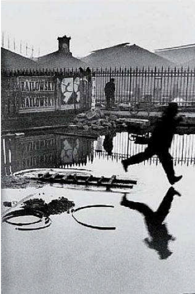
“O momento decisivo”, fotografia precisa de Bresson. 267

Bresson confessou que aquela foto foi um “golpe de sorte”. Ele estava atrás de uma grade e apontou a câmera com as mãos sem mirar a imagem com os olhos. Ele não viu o que estava na lente e voilà . “A sorte só chega para quem está dando condições para que ela apareça”, explicou Bresson. 268