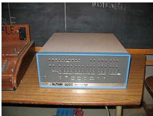
O computador Altair, hoje, no Museu de História Americana em Washington. 118

O primeiro computador pessoal – o Altair – surgiu em 1975 e tinha capacidade para armazenar apenas as primeiras quatro linhas de um parágrafo.