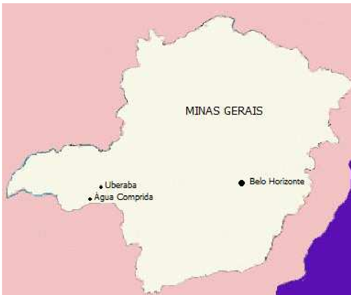
Figura 1: Localização geográfica do município de Água Comprida no estado de Minas Gerais. Fonte: Mapa de Minas Gerais www.suapesquisa.com/mapas/mp-minasgerais.jpg (modificado)

Água Comprida localiza-se a uma distância de 40 km do município de Uberaba e faz parte da macrorregião do Triângulo do Sul. A escolha desse local decorreu do fato de o do município ser de pequeno porte e carecer de pesquisas sobre essa temática em localidades com essa classificação, como visto anteriormente. De acordo com o Censo Demográfico 2000, esse município é classificado como de sendo de pequeno porte I, ou seja, com população menor que 20.000 habitantes (IBGE, 2002). Além disso, esse município possui convênio com a Universidade Federal do Triângulo Mineiro (UFTM), que sedia o Programa do Mestrado em Atenção à Saúde, para o desenvolvimento de estágios na área de saúde pública.