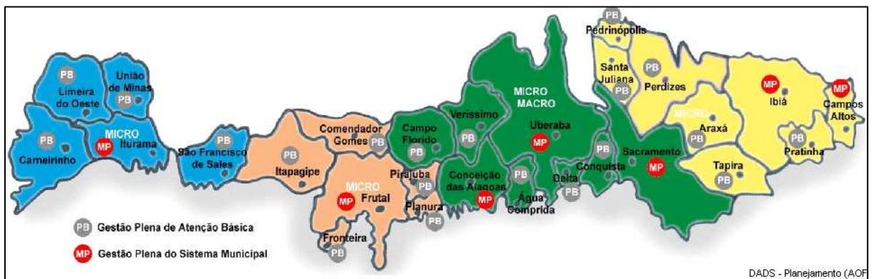
Figura 2 – Macrorregião de Saúde do Triângulo Sul segundo Microrregiões definidas pelo Plano Diretor de Regionalização de Saúde do Estado de Minas Gerais, 2003/2006.