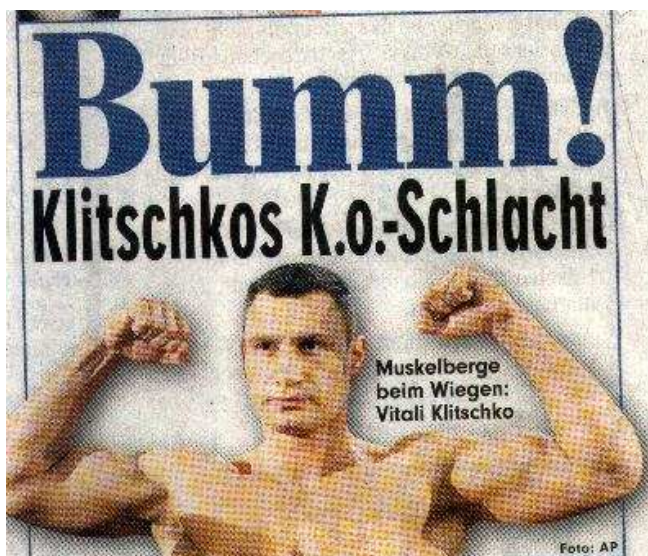
FIG.7: Foto do BILD 06/10/08.

Interessante ressaltar que ambos os jornais utilizam estratégia semelhante para conquistar a fidelização de seus leitores, como a distribuição de prêmios aos seus leitores. Para informar seus leitores sobre esta modalidade do jornal, ambos os jornais utilizam o cabeçalho do mesmo e expõem os prêmios através de fotografias. Nestes casos, o uso da cor é muito variado e, como os prêmios e as formas de ganhá-los são diferentes nos dois jornais, a exposição também é configurada de forma divergente.