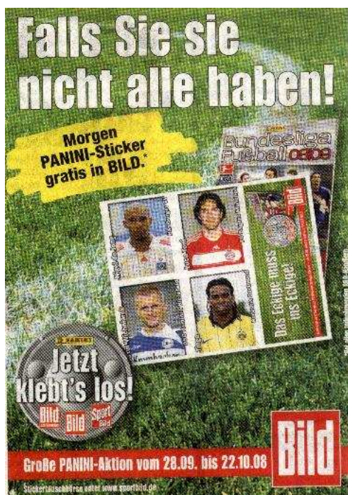
FIG.9: Anúncio do BILD .

Na semana em que o corpus foi recolhido, os prêmios foram os seguintes: no BILD , é realizado um sorteio de prêmios tais como viagens internacionais ou mesmo carros esportivos a partir do sorteio de números de série de uma nota de 5 euros. Assim, o leitor deve comprar o jornal e conferir quais foram os números sorteados pelo jornal, aquele que possuir a cédula com o número, ganha o prêmio. No SUPER , o leitor deve juntar determinada quantidade de selos, impressos no jornal, e trocar por uma miniatura de motocicleta. Interessante notar que estes anúncios estão presentes em todas as edições dos referidos jornais, o que demonstra ser este um dado tido como relevante para o leitor dos mesmos.