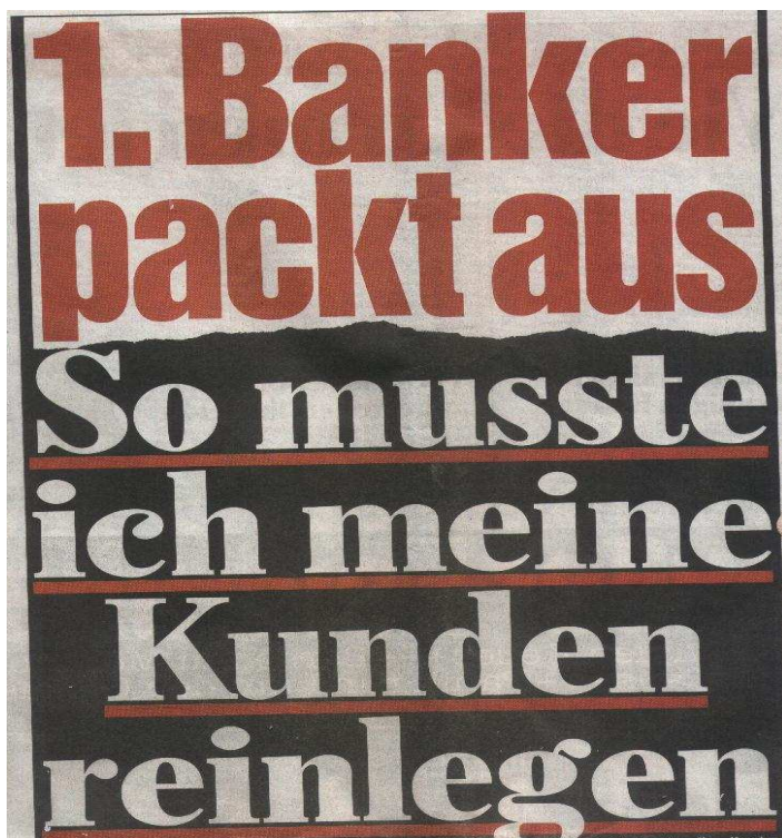
FIG.5: Manchete do BILD 06/10/08.

Desta forma, o uso das cores acaba criando uma desvinculação entre cores e significados, ou seja, entre as cores e toda a história, simbologia e capacidade comunicativa que elas poderiam proporcionar (GUIMARÃES, 2003). Segundo o autor, esta postura da mídia parece imaginar um leitorado acrítico, incapaz de receber a informação que a cor proporcionaria.