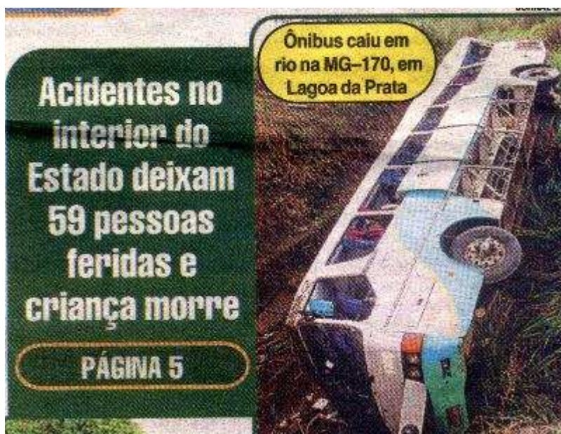
FIG. 11: Foto do SUPER 10/10/08.

A análise de tais elementos que ajudam a constituir a primeira página dos jornais nos fornece indícios para a construção da imagem de leitor que as instâncias de produção envolvidas imaginam ser o seu. Assim, de acordo com Mouillaud (1997), o pôr em visibilidade contém modalidades do poder e do dever.