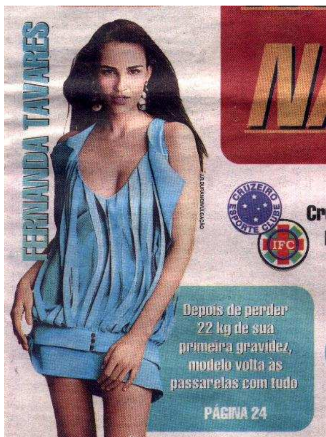
FIG.1: Mulher no SUPER .