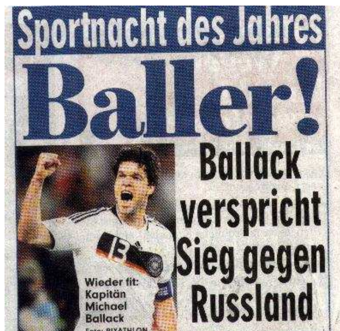
FIG.6: 11/10/08.

A posição em que o sujeito da manchete, Ballack, aparece enquadrado na foto - um dos braços na vertical, mão fechada e semblante configurando uma expressão de vitória - já