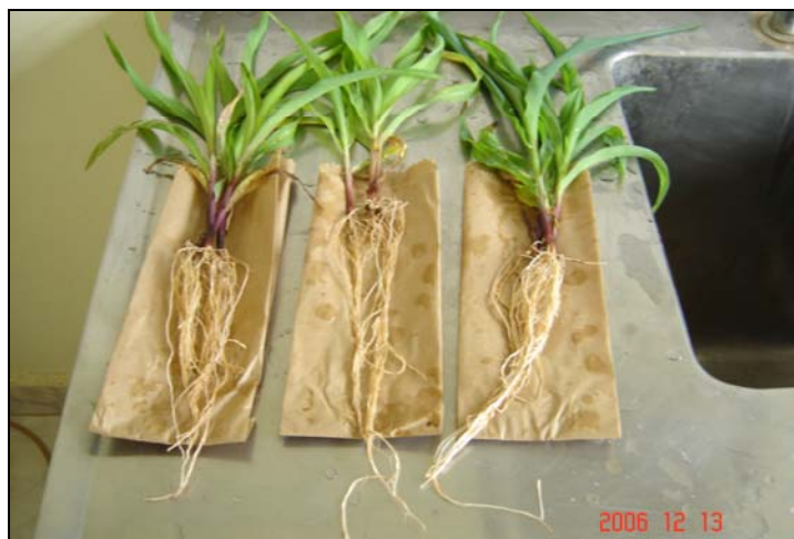
FIGURA 1. Raízes de genótipos de milho após o processo de lavagem.