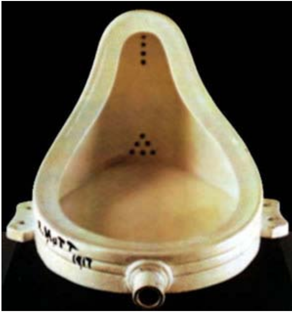
FIGURA 2 - Marcel Duchamp Fontaine ready-made 1917