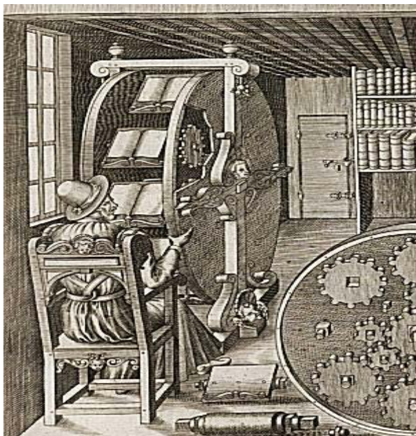
FIGURA 4 - Le Diverse ET Artificiose Machine - Agostino Ramelli – 1588 http://www.lettras.ufrj.br/ciencialit/encontro.htm

A primeira máquina interessante é encontrada em uma gravura renascentista atribuída ao Capitão Agostino Ramellium, um sistema que possibilita ao pesquisador o acesso a um conjunto de livros. As obras são ordenadas e alocadas numa espécie de roda que, girando sobre um eixo, permite saltar de uma informação a outra rapidamente.