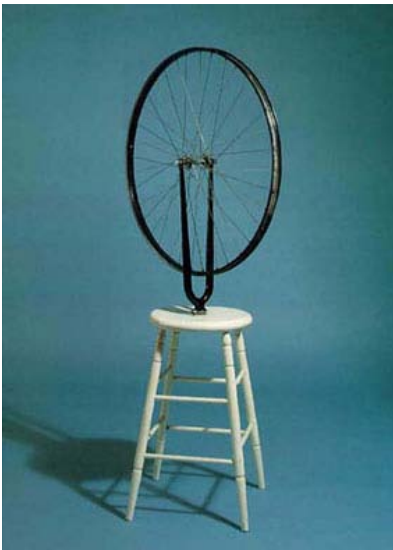
FIGURA 3 - Marcel Duchamp Roda de bicicleta 1913 http://www.revistaea.org/artigo.php?class=13&idartigo=584