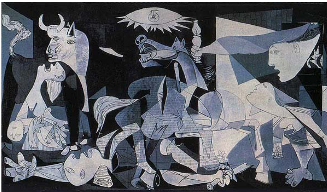
FIGURA 1 - Guernica – Pablo Picasso http://www.artchive.com/artchive/P/picasso/guernica.jpg.html

Sólo le pido a Dios que la guerra no me sea indiferente, es un monstruo grande y pisa fuerte toda la pobre inocencia de la gente. León Gieco