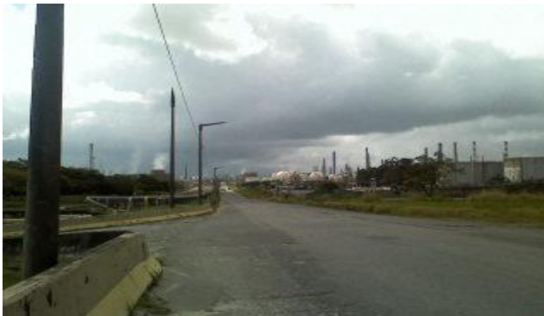
Foto: Pólo Petroquímico e Industrial de Camaçari, acervo pessoal, 2009.

Um longo trajeto. É o que penso ao retornar ao ambiente industrial, pois esta era a característica que mais me perturbava ao despertar todos os dias e ir para o trabalho: Teria pela frente uma viagem, muitas vezes até menor do que as urbanas, com seus pequenos e irritantes congestionamentos, mas o momento de entrar no transporte – um ambiente frio, fechado, silencioso, no qual a maioria das pessoas dorme até a chegada ao trabalho, estes fatores que fariam qualquer pessoa sentir-se feliz, com a idéia de “mordomia”, me deixava incomodada. Enfim, mas agora eram outras motivações, o caminho era longo, mas o transporte diferente, desta vez um ônibus interurbano cheio de pessoas conversando, cantarolando, vidros claros, “ar fresco”.