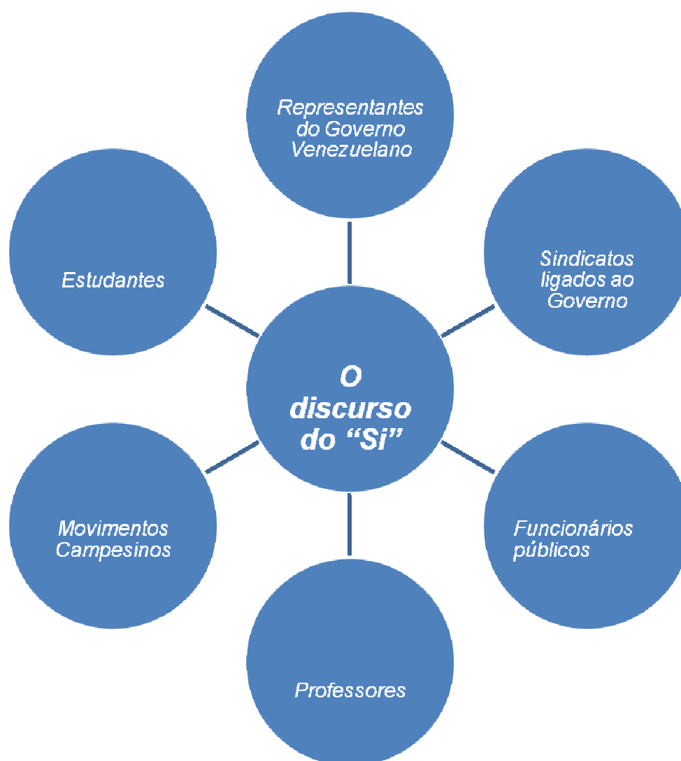
Fig. 01: Representação da Cadeia Equivalencial do “SÍ”

É pertinente ressaltar acerca do discurso do “Si” a importância dos significantes vazios na formação do apoio que Chávez obteve no Referendo demonstrado nas regularidades acima. Na Primeira Parte do respectivo trabalho, foi apresentado capítulo específico sobre Bolívar, para ilustrar o principal significante vazio nos discursos de Chávez. Pois, conforme a concepção básica desta categoria discursiva, os significados que Simon Bolívar reflete são os de liberdade, igualdade, revolução e luta contra o opressor. Ou seja, todos estes significados representam grandes aglomerações de sentido, o que torna indeterminados seus sentidos.