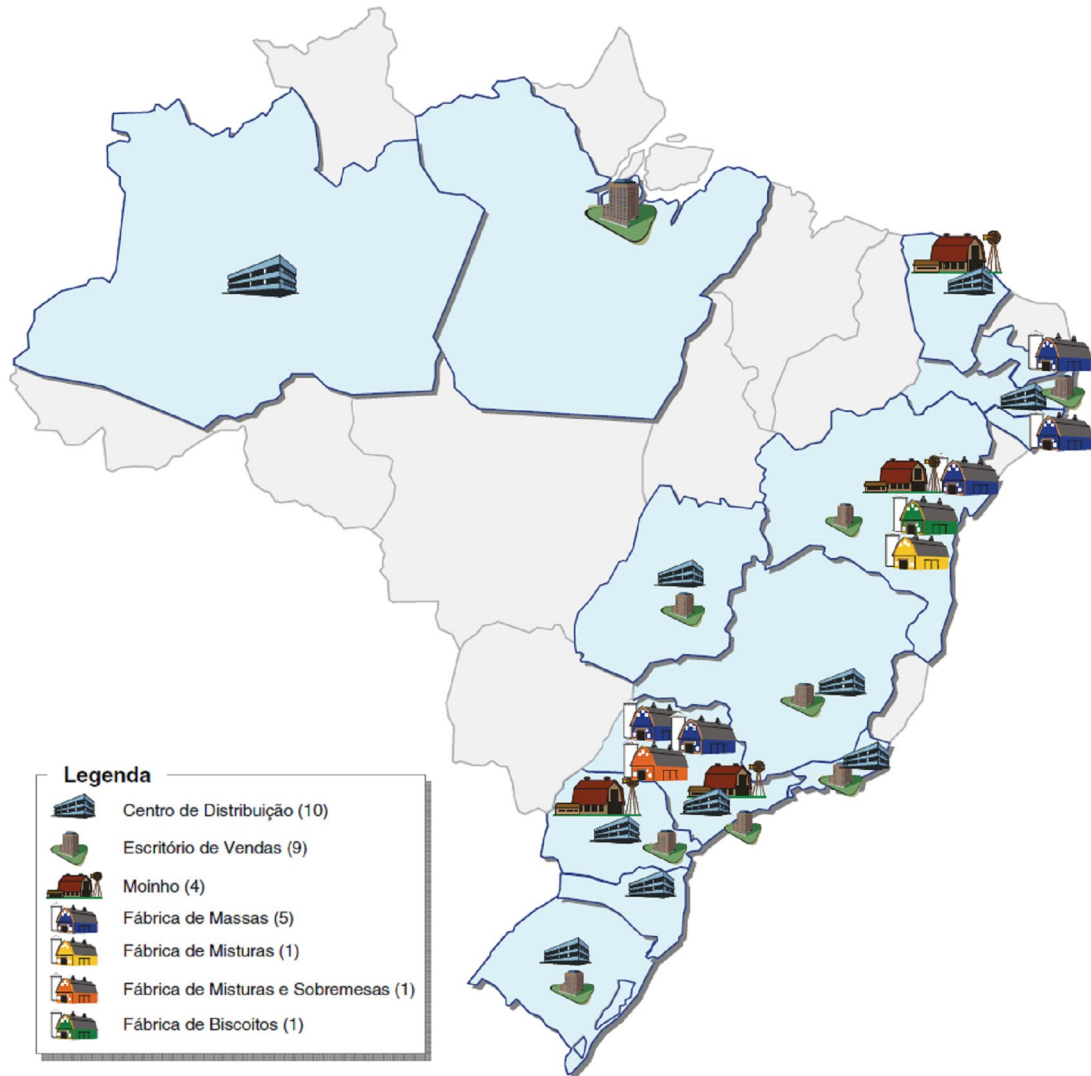
Ilustração 5.1: Mapa das unidades do grupo JKL

A Ilustração 5.1 mostra as diversas unidades da empresa distribuídas no território brasileiro no ano de 2007.