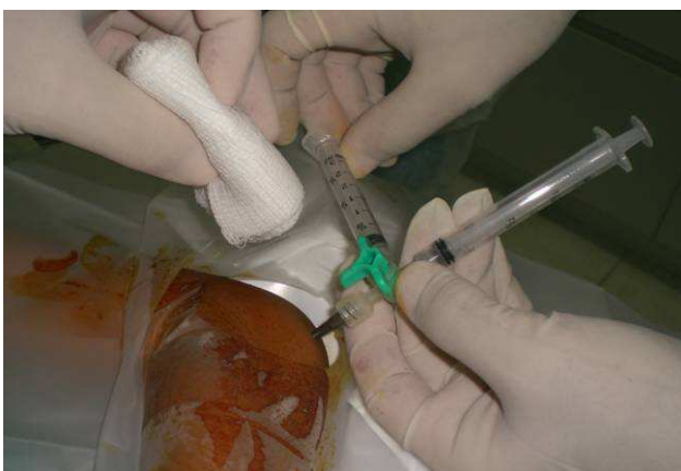
Fig. 3 SR em cotovelo utilizando o dispositivo three-way .