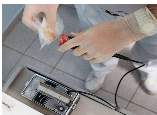
Fig. 4. Monitorização de gaze com contador Geiger-Müller .