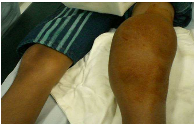
Fig. 1 . Joelho com sinovite crônica.