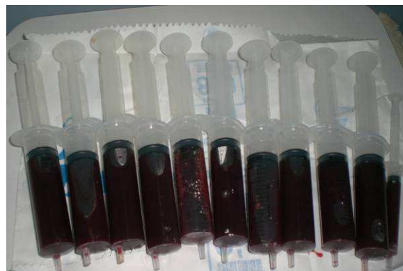
Fig. 2. Seringas com líquido sinovial aspirado de joelho com sinovite crônica.