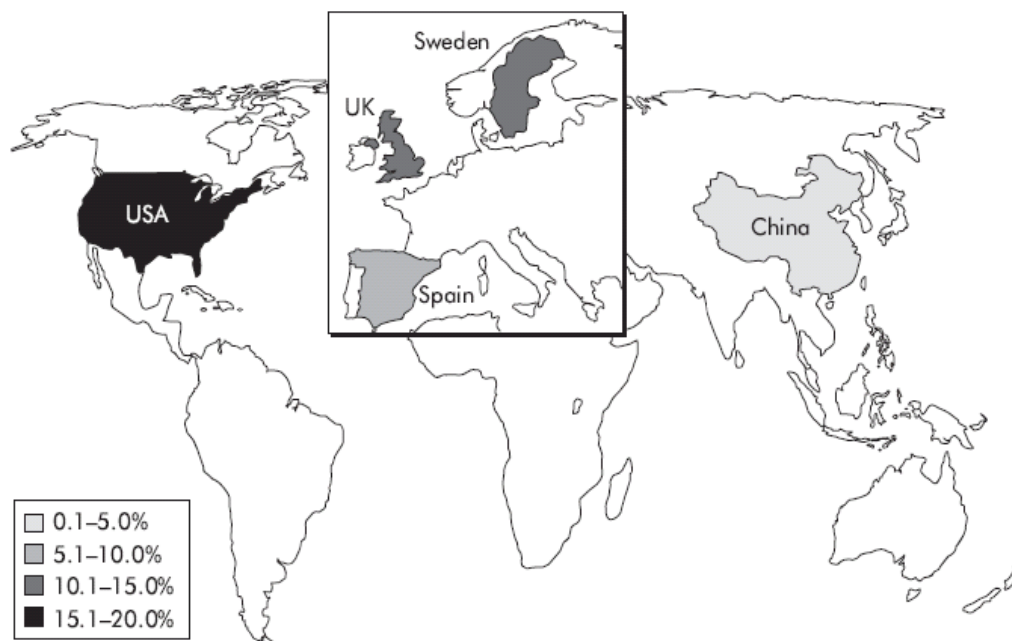
Figura 1: Epidemiologia da DRGE (Adaptado de Dent J, El-Serag HB, Wallander MA, Johansson S. Epidemiology of gastro-oesophageal reflux disease: a systematic review. Gut 2005;54(5):710-7).